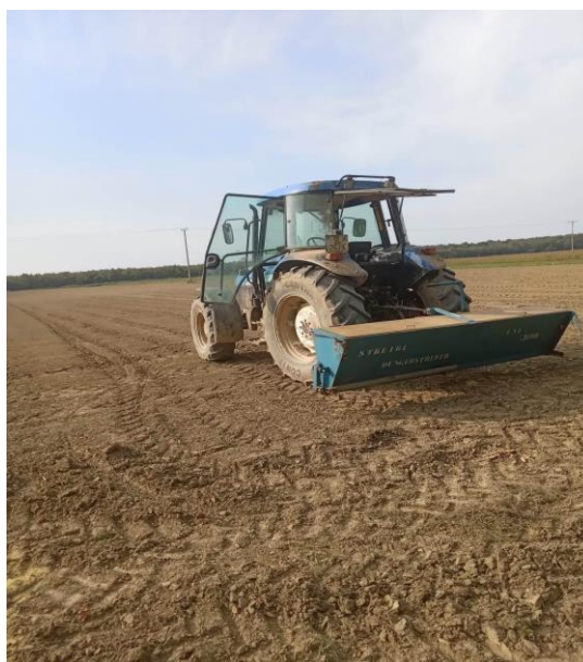
Slika 13. Gnojidba kamilice

Budući da kamilica zahtjeva vrlo malo hraniva, a najmanje dušika, u osnovnoj obradi nisu aplicirana gnojiva. Ovisno o količini oborina, na proljeće, čim vrijeme dozvoli, treba krenuti u folijarnu prihranu. Prva prihrana obavljena je u veljači te je dodano 200kg/ha 15-15-15 NPK gnojiva (Slika 13.). Druga prihrana obavljena je u travnju te je dodano 120 kg KAN gnojiva po hektaru. Broj prihrana varira ovisno o vremenskim uvjetima.