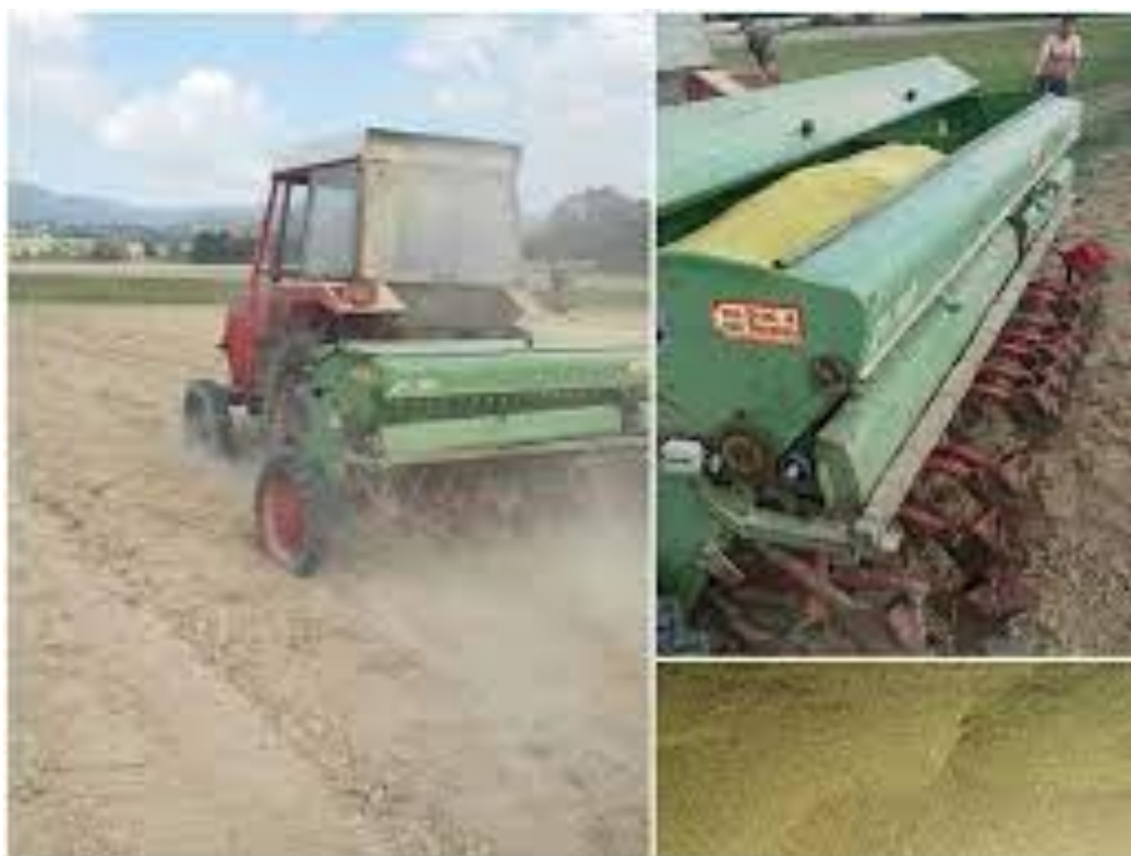
Slika 7. Sjetva kamilice

Uz nepravilan raspored padalina, jesenska sjetva počinje u rujnu (Franke i Schiler., 2005.). Prema Šilješu i sur. (1992.) u našim uvjetima sjetva do veljače je razumna, a optimalni jesenski rokovi kreću se od sredine rujna do kraja listopada. S obzirom na sjetvenu površinu kamilice i kratko razdoblje cvatnje, najbolje je sijati kamilicu u više sjetvenih rokova, čime se može osigurati produljenje razdoblja cvatnje. Tijekom izrazito sušne jeseni, budući da jutarnja rosa vlaži površinu tla, a tlo se ne isušuje zbog umjerenih dnevnih temperatura, usjevi će brže nicati i ravnomjernije rasti ako se sade kasnije. Ako se kamilica sije u prvom roku, površinu je potrebno povaljati jer tlo nije prevlažno. Proljetnu sjetvu ne treba provoditi jer se prinosi mogu smanjiti i do 40 % (Šilješ i sur., 1992.) (Slika 7.).