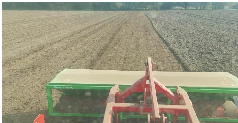
Slika 6. Valjanje tla

Budući da se kamilica rano sije, u prvoj godini proizvodnje, tlo se nakon berbe mora lagano preorati. Prije sjetve površinu ne treba obraditi dubinski više od 25 cm, ali treba zatvoriti brazde i pripremiti sjetveni sloj kako se tlo ne bi isušilo. Prije sjetve površinu treba prevaljati jakim valjkom (napunjenim vodom ili pijeskom). Ovisno o vrsti tla i strukturi tla, valjanje se izvodi u 2-3 prolaza, odnosno dok se ne dobije ravna i kompaktna površina (Slika 6.). Tlo za sadnju kamilice treba pripremiti ljeti, a najkasnije do rujna godine (Stepanović i sur., 2009.).