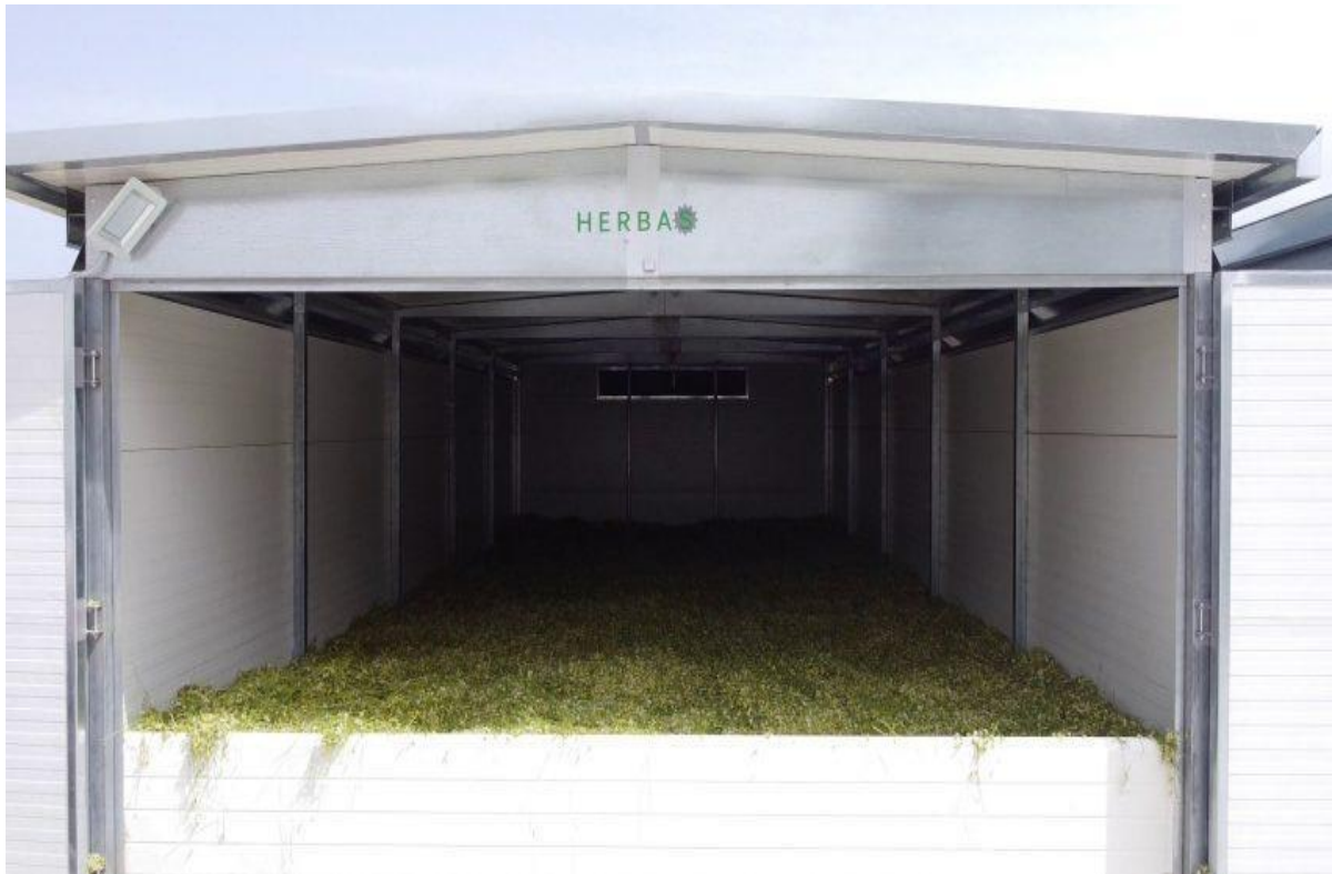
Slika 12. Podna sušara