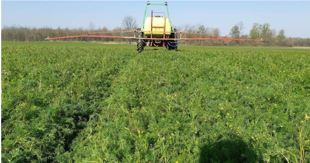
Slika 8. Prskanje kamilice