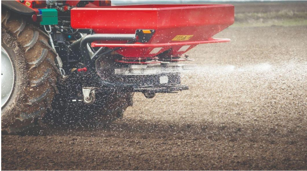
Slika 5. Gnojidba tla