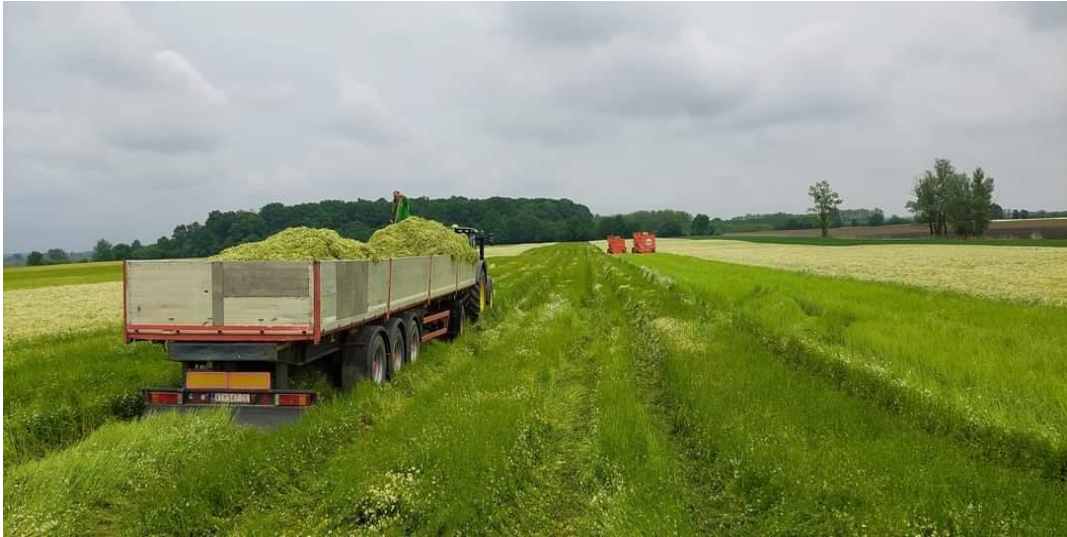
Slika 15. Transport kamilice