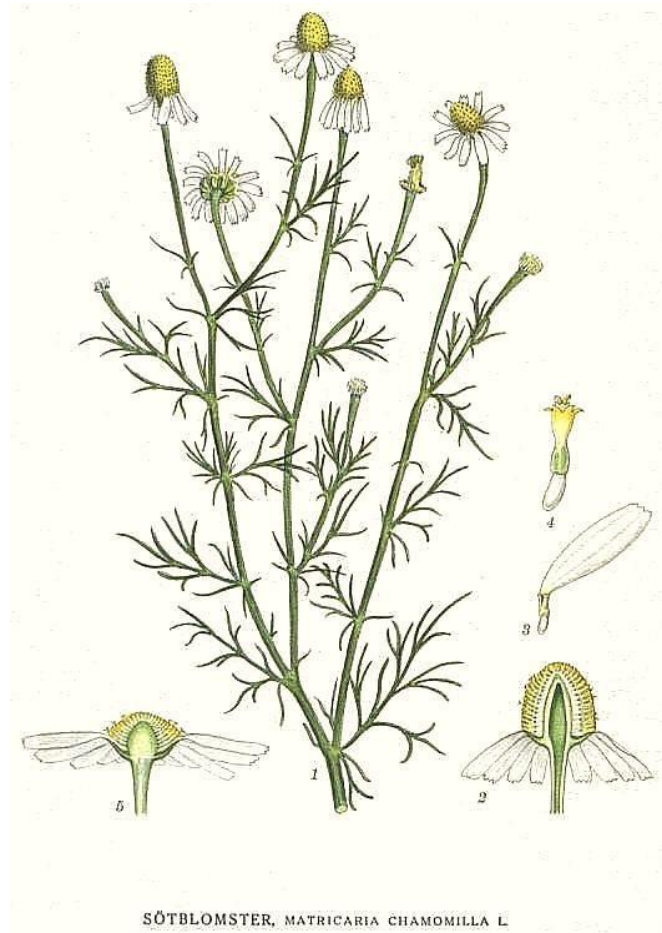
Slika 3. Stabljika kamilice

Na stabljikama se mogu naći cvjetne glavice promjera između 10 i 30 mm. Tipično su cvjetne glavice jedinstvene, sa skraćenom i zadebljanom glavnom osi na kojoj se nalaze i pojedinačni, sjedeći cvjetovi (Rogošić, 2011.).