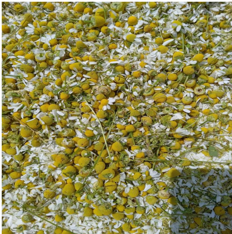
Slika 1. Kamilica

Češće kupanje može pomoći u ublažavanju znojenja nogu ili ruku, stoga je važno održavati redovita namakanja (Dohranović i sur., 2012.).