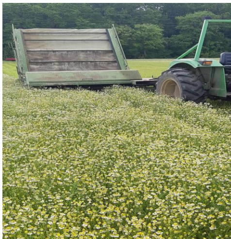
Slika 14. Berba kamilice

Berba je počela u svibnju te je trajala gotovo cijeli mjesec; berba počinje kada je 70 % cvjetnih glavica fiziološki zrelo (Slika 14.). U berbi sudjeluju strojevi, a u ostalim poslovima i skladištenju, sezonski radnici. Najveće probleme mogu uzrokovati vremenske neprilike ili nedostatak ljudske snage. Prinos je iznosio 930kg/ha.