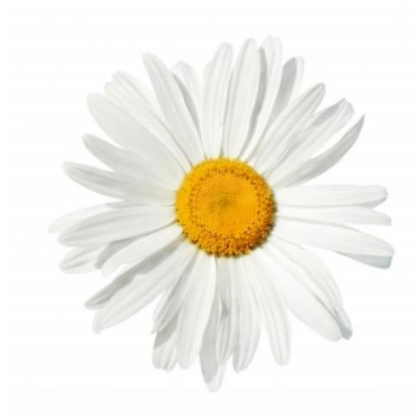
Slika 4. Cvijet kamilice

Masa 1000 sjemenki iznosi 0,07 – 0,08 g. U 1 kg ima 12 000 000 – 15 000 000 sjemenki Biljka proizvede 5 000 – 5 300 roški (Skender i sur., 2011.). Kada biljka dozrije, glavica se osipa, a sjeme raznosi vjetar.