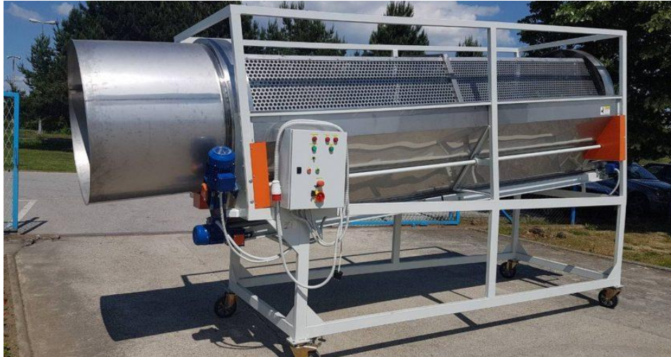
Slika 11. Cilindrični separator