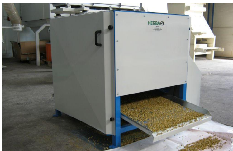
Slika 10. Odvajač glavica cvijeta kamilice

Sljedeći korak u obradi je separacija vibracijom na prikladnom situ pomoću ekscentričnih kotača za odvajanje sljedećih tvari: zelene tvari (bilje), primarne (peteljke ne veće od 1 cm), sekundarne (peteljke ne veće od 5 cm) i tercijarne (peteljke veće od 5 cm) cvjetove kamilice (Šalković, 2017.).