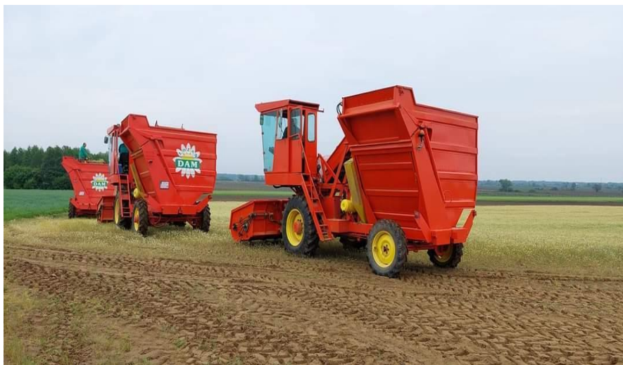
Slika 9. Strojna berba kamilice

Sjeme se bere kada na 70 % cvjetnih glavica dozre 75 % sjemena. Ukoliko berba počne prerano, dobije se nedozrelo, slabo klijavno sjeme, a ako krene prekasno puno sjemena se gubi osipanjem. Kombajnom se vrši berba kada je vlaga cvijeta optimalna te se tako smanjuje osipanje sjemena i ne utječe negativno na njegovu kakvoću. Sjeme se mora osušiti, doraditi i primjereno uskladištiti. Prilikom pripreme mješavine za sjetvu, važno je zadržati čistoću sorte. Prinos može biti 80-250 kg/ha, ovisno o uvjetima uzgoja (Poljak, 2013.).