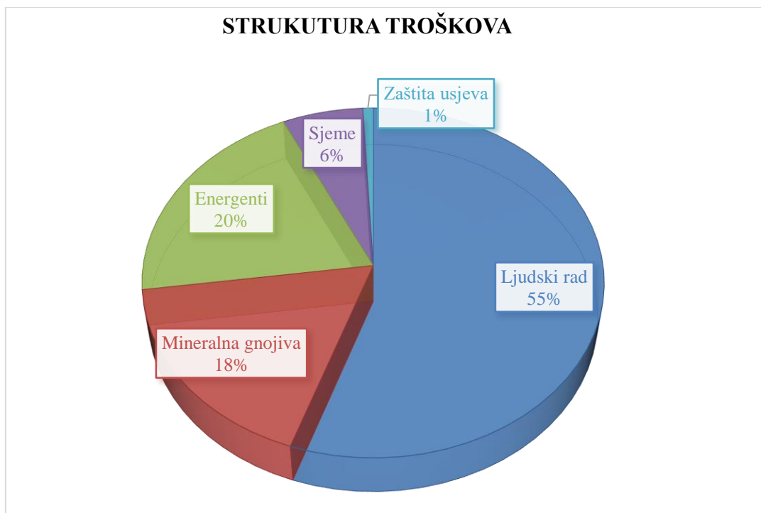
Grafikon 1. Struktura troškova u proizvodnji kamilice na OPG-u „Brezec“