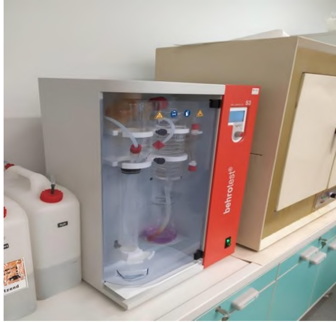
Slika 6. Destilator