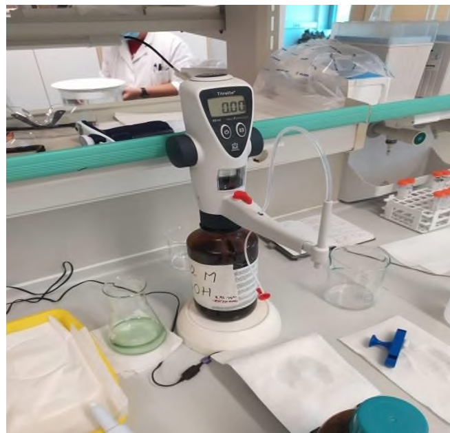
Slika 7. Titrator