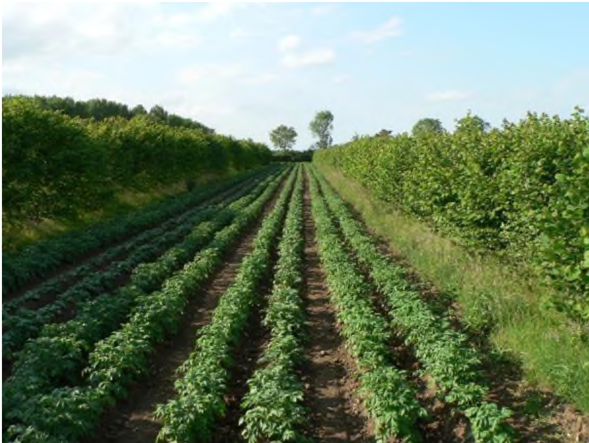
Slika 1. Drvenasti nasadi sa međusjevima

umjerene klime je nešto manja u odnosu na tropska područja. Dva najčešća sustav koja se upotrebljavaju su silvoarabilni pri oblikovanju vjetrozaštitnih pojaseva radi zaštite od erozije te silvopastoralni pri uzgoju domaćih životinja na raznim šumskim terenima i ekosustavima. Najraniji opisi upotrebe agrošumarstva u Europi i Bliskom istoku spominju se još u Bibliji gdje su opisane kombinacije nasada maslina i smokvi, zatim držanje domaćih životinja unutar nasada maslina i naranči. Renesansne slike su prikazivale uzgoj usjeva među drvećem i stoku koja se hrani žirom ili kestenjem (Nair, 1993.).