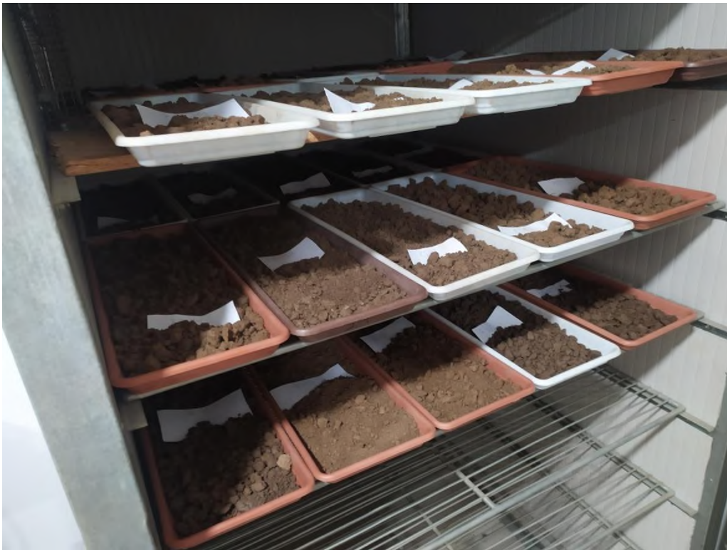
Slika 5. Sušenje uzoraka tla

Prikupljeni uzorci zapakirani su u posebno označene vrećice. Dio uzorka je spremljen u hladnjak kako bi ostao u prirodnom stanju s trenutnim sadržajem vlage za mjerenje dušika a ostatak uzorka je očišćen od primjesa drugih tvari kako bi se pripremio za sušenje i daljnju analizu ostalih osnovnih svojstava tla. Analiza mineralnog dušika u tlu provedena je iz uzoraka u nativnom tj. prirodnom stanju. Analize amonijskog i nitratnog dušika su vršene na Skalar CFA uređaju.