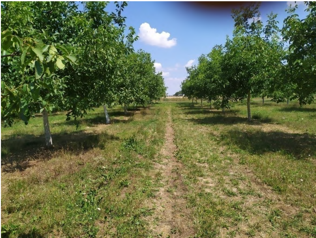
Slika 3. Nasad oraha

Orah je orašasto voće koje se uzgaja u pojasu umjerene klime. Najraniji zapisi o uzgoju oraha sežu u doba antičke Grčke i Rima gdje su postali poznati kao Jovis Glans odnosno Jupiterov žir ili orah bogova. Izraz Juglans potječe iz rimske književnosti. Orah pripada obitelji Juglandaceae (Verma, 2014.). Obični orah ( Juglans regia L ) porijeklom je s područja u Euroaziji koja se proteže od Bliskog istoka do Himalaja i zapadne Kine. Ova pojedinačna vrsta poznata je pod raznim nazivima kao što su perzijski, francuski, turski, talijanski, čerkeski i karpatski orah. Osim orašastih plodova, drvo je također izvor visokokvalitetnog drva za namještaj i kundake (Burley i sur., 2004.). Najveći proizvođači oraha su Kina, Iran, SAD, Turska, Ukrajina, Meksiko, Francusku, Indija, Rumunjska i Čile. Ovih deset zemalja doprinosi oko 90 % svjetske proizvodnje (Verma, 2014.). Prethodno smo naveli primjer konsocijacije oraha sa lucernom a Jose i Gillespie (1998.) navode primjer međusjeka kukuruza s crnim orahom ( Juglans nigra L. ) pri čemu je orah imao nepovoljan alelopatski učinak na prinos kukuruza. Odvajanjem korijenovog sustava oraha od usjeva postignuto je povećanje prinosa za 62 %.