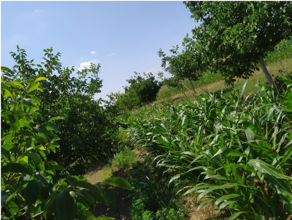
Slika 2. Konsocijacija oraha i kukuruza

Kukuruz ( Zea mays L. ) je kultura koja potječe iz Meksika odakle se proširio kao jedna od glavnih prehrambenih žitarica. Europljani otkrićem Južne i Sjeverne Amerike krajem 15. i početkom 16. stoljeća preuzimaju kukuruz te ga donose sa sobom u Europu ali ga šire i ostatkom svijeta u procesu kolonizacije (Danforth, 2009.). Kukuruz je pored pšenice i riže najzastupljenija žitarica na svjetskim oranicama koju također karakterizira i najveći potencijal rodosti od svih žitarica. Prosječan prinos zrna kukuruza u svijetu 2010. godine iznosio je 5,18 t/ha, riže 4,34 t/ha, a pšenice 3,0 t/ha. Kukuruz je sirovinaska osnova za oko tisuću različitih industrijskih proizvoda kao što su različiti prehrambeni proizvodi, škrob, alkohol, ulje, dječja hrana, farmaceutska i kozmetička sredstva i tekstilni proizvodi. Također se koristi za proizvodnju bioetanola (Kovačević i Rastija, 2014.).