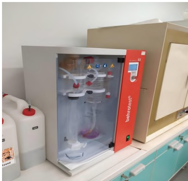
Slika 6. Destilator