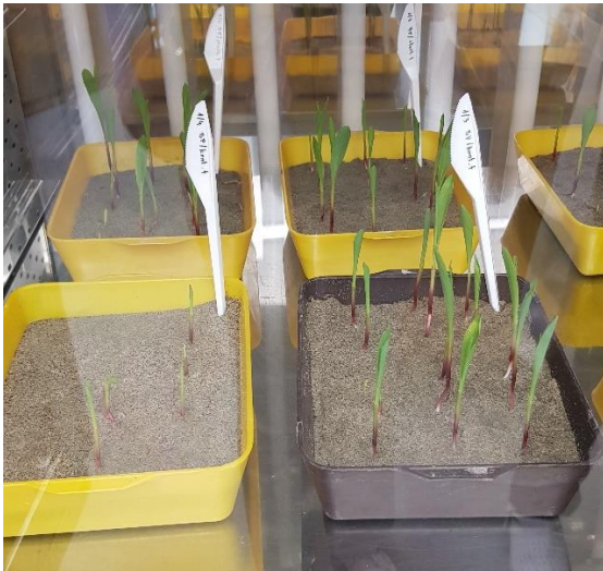
Slika 12. T4 tretman – klijanci kukuruza (Izvor: laboratorij za fitopatologiju) (Fakultet agrobiotehničkih znanosti Osijek)

Prema statistici prikazanoj u tablici 3. utvrđeno je da nema statistički značajnih razlika među tretmanima za sve elemente mjerenja osim mase korijena nakon liofilizacije. Tretman T4 se statistički razlikuje od tretmana T2 (Slika 12./13.) i kod njega je utvrđena najmanja masa korijena. Među tretmanima T1, T2 i T3 nije bilo statistički značajnih razlika.