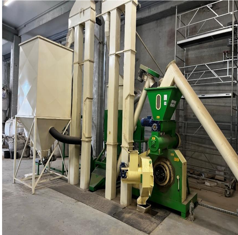
Slika 8. Preša i spremnik