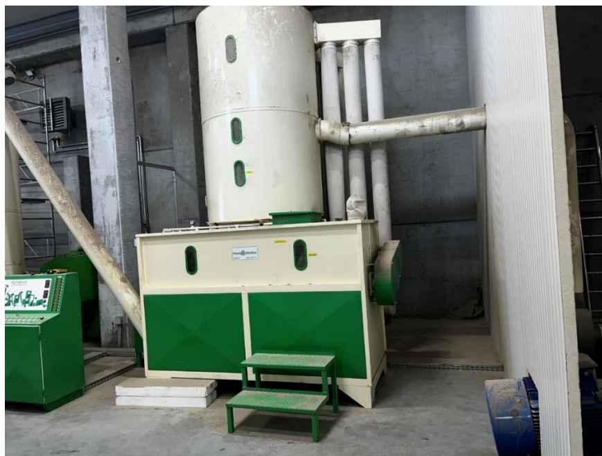
Slika 5. Mlin sa sitom