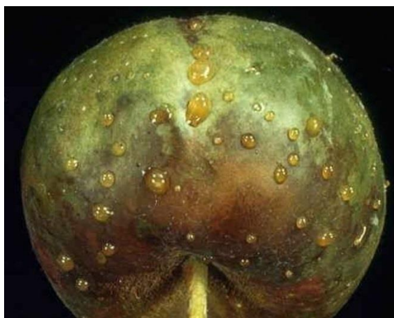
Slika 26. Bakterijska palež ploda