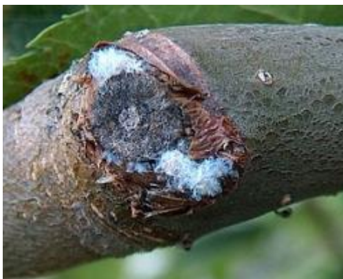
Slika 4. Jabučna krvava uš

Odrasli oblici su crvenosmeđe boje, beskrilne uši su 1,2 – 2,6 mm, a krilate 1,8 – 2,3 mm. Tijelo odraslih uši se ne vidi jer je prekriveno bijelom voštanom prevlakom (Slika 4.). Kada uklonimo bijelu voštanu prevlaku i zdrobimo uši, vidi se crvena tekućina, po kojoj su uši dobile ime. Ova uš je anholociklička i monoecijska. Ličinke prezime na vratu korijena, većem korijenju, pukotinama debla i rak ranama. Partenogenetski se razmnožava i ima 10 – 15 generacija godišnje. Prema Maceljskom i Igrc Barčić (1999.), kada je temperatura viša od 30 0 zaustavlja se razmnožavanje ove uši, a ako temperatura viša od 35 0 razmnožavanje je onemogućeno. Krilate generacije javljaju se u jesen. Jabučna krvava uš se hrani sišući biljni sok na korijenu, razvijenim granama i mladim izbojima, i uzrokuje pucanje kore, sušenje grana i stvaranje rak rana na mjestima uboda.