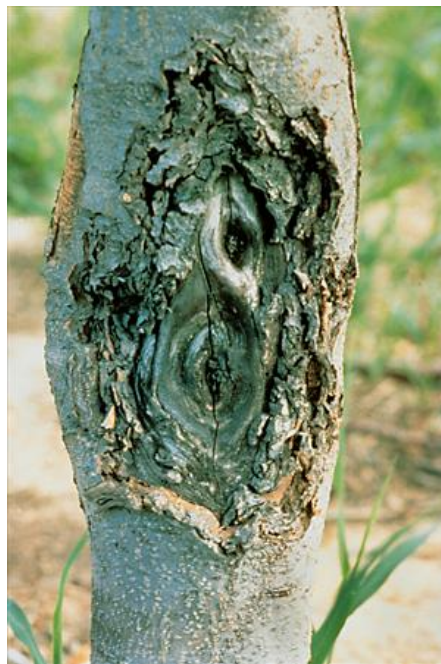
Slika 27. Rak rane na stablu jabuke

Preventivna zaštita je sadnja zdravih sadnica. Ako se bolest razvila rezidbom ukloniti sve bolesne grane koje je potrebno spaliti. Rak rane premazati. Tijekom proljeća potrebno je obaviti jedno kasno prskanje pripravcima na osnovi bakra, dok se kasnije koriste površinski fungicidi namijenjeni suzbijanju krastavosti jabuke.