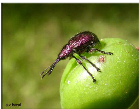
Slika 15. Jabučni svrdlaš – imago

Prezime ličinke ili imago u otpalom lišću ili kori drveta. Imago se javlja krajem ožujka ili u travnju i izgrizaju pupove i koru grančica. Jaja odlažu u plodiće, ženka izbuši komoricu u koju odloži jaje i zatvori (Slika 16.). Ličinke se razvijaju u mumificiranim plodovima u kojima buše hodnike. Ličinke koje su se razvile iz jaja koja su odložena ranije spuštaju se u tlo i zapredaju u kokon zatim se kukolje i preobraze u imago. U plodovima završe razvoj ličinke koje su se razvile iz jaja koja su kasnije odložena. Ličinke koje su se razvile iz najkasnije odloženih jaja prezime u mumificiranim plodovima i sljedećeg ljeta daju imago (Maceljski i Igrc Barčić, 1999.).