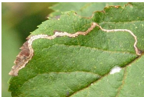
Slika 9. Vijugave mine na listu

Moljac vijugavih mina rijetko nanosi veće štete. Odrasli leptiri su sjajno bijele boje, tanka krila omeđena su dugim vlaknima. Gusjenice su duge 8 – 9 mm. Zelene su boje s dvije točke na trećem segmentu. Ima 3 – 4 generacije godišnje. Leptir prezimi u pukotinama kore ili na skrovitim mjestima. Let leptira počinje pred cvatnju jabuke. Jaja odlažu ispod epiderme na naličju lišća. Iz jaja izlaze gusjenice i ubušuju se u list praveći vijugave uske mine duge do 10 mm (Slika 9.). Prema Maceljskom i Igrc Barčić (1999.), kukolji se u bijelom kokonu čije su dvije paralelne niti razapete pričvršćenim na suprotnim rubovima lišća.