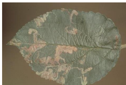
Slika 10. Vijugave mine patuljastog moljca

Krila patuljastog moljca su crne boje sa poprečnom srebrnom crtom. Prezimi kukuljica u tlu. Ima tri generacije godišnje. Let leptira je između ožujka i svibnja. Ličinke izlaze iz jaja i ubušuju se u list praveći kratku vijugavu minu koja se pri kraju proširuje (Slika 10.). Kada se gusjenice potpuno razviju, napuste list i odlaze na kukuljenje u tlu gdje i prezimljuju.