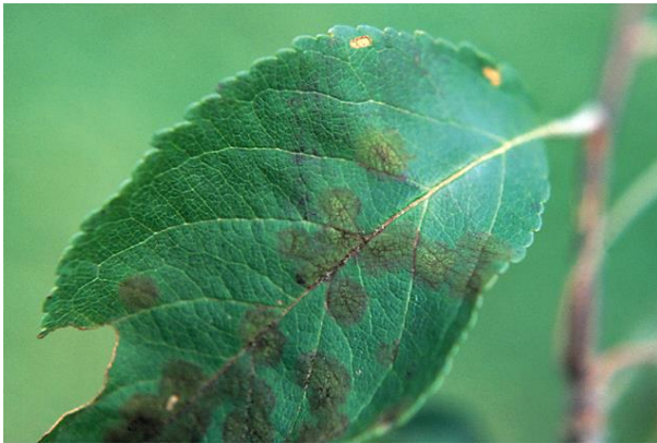
Slika 20. Mrljavost lista