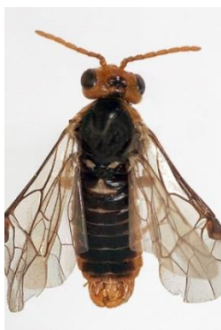
Slika 11. Jabučna osica – imago

Jabučna osica jedan je od najvažnijih štetnika jabuke. Imago je dužine 6 – 7 mm. Leđna boja je sjajno crne boje, a trbušna žućkasto-smeđa. Glava je žute boje. Na horizontalnim krilima vidljive su žilice smeđe boje (Slika 11.). Ličinke su bijele boje sa smeđom glavom, dužine 12 – 14 mm. Imaju 7 pari trbušnih nogu. Ličinke imaju karakterističan miris. Jaja su prozirna, veličine 1 mm. Ličinka prezimi u tlu, gdje se i kukolji. Imaju jednu generaciju godišnje. Odrasli oblici se javljaju u proljeće u vrijeme cvatnje. Ženke odlaze u plodnicu poluotvorenih ili otvorenih cvjetova. Nakon inkubacije izlaze pagusjenice koje se ubušuju u plodiće pa se na površini ploda vidi krivudavi hodnik oplutavjelog tkiva. Jedna ličinka uništi 4 – 5 plodova. Plodovi otpadaju i deformirani su, a u njima se nalaze ličinke koje je ukopaju pod zemlju i začahure (Slika 12.).