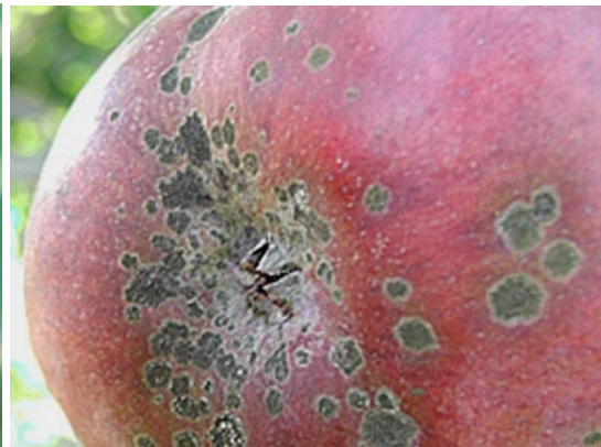
Slika 21. Krastavost ploda