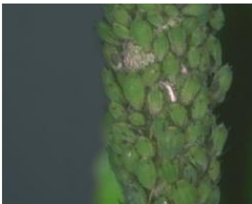
Slika 3. Jabučne zelene uši

Zimska jaja odlaze na jednogodišnjim izbojima. Za vrijeme bubrenja pupova, javlja se osnivačica koja siše pupove. Izboji su zbog toga iskrivljeni i zaostaju u razvoju. Vrhovi lišća su također deformirani i zaostaju u rastu. Jabučna zelena uš u ljetnim mjesecima izlučuje mnogo medne rose koju intenzivno naseljava čađavica.