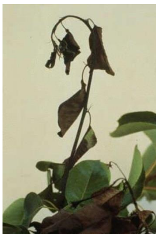
Slika 25. Bakterijska palež izboja