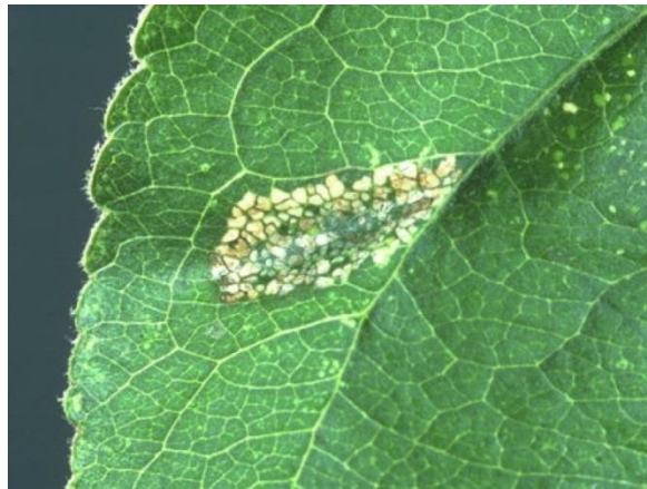
Slika 8. Točkaste mine na listu

Moljac točkastih mina ima 3 – 5 generacija godišnje (Ivezić, 2003.). Prezimi kao kukuljica na otpalom lišću. Leptiri su zlatno smeđe boje te resastih krila. Gusjenice su duge 7 – 8 mm, žute do smečkaste boje sa svijetlim točkama na sedmom i osmom segmentu. Pred cvatnju jabuke javljaju se leptiri i odlažu jaja na naličje lista. Gusjenice izlaze iz jaja i ubušuju se u lišće i prave mine nepravilnog oblika. Gusjenica unutar mine izjeda lisno tkivo i zbog toga mina postaje točkasta, skupi se u unutrašnjosti, a na naličju nastane uzdužni nabor (Slika 8.). Gusjenice su aktivne od svibnja do studenog. Kukulji se u mini.