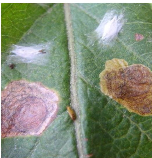
Slika 7. Mine i kukuljice na listu

Prezimi kao kukuljica u krošnji ili na lišću. Formira kokone na plodovima iz kojih se širi. Prije početka cvatnje počinje let leptira. Leptiri odlažu jaja na donje strane lista. Razvoj jaja traje od 8 – 12 dana. Nakon toga izlaze gusjenice koje se ubušuju u listove i stvaraju okruglaste mine promjera 5 – 6 mm i mogu se uočiti na licu lišća. Površina lišća je oštećena, u minama se vide koncentrirani krugovi izmeta, koji reduciraju fotosintezu (Slika 7.). Ovaj moljac se kukolji na naličju lišća u bijelom kokonu (Ivezić, 2003.).