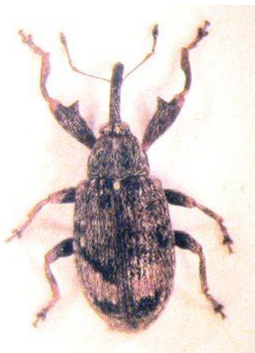
Slika 5. Jabučni cvjetar - imago

Imago je dugačak oko 5 mm. Smeđe je boje, na pokrildju ima po jednu kosu svijetlu prugu koja ima tamni rub (Slika 5.). Pruge na pokrildju čine veliko slovo V. Ima izrazito veliko rilo koje čini 1/3 dužine tijela kukca. Ličinke su apodne, bijele boje imaju crnu glavu i veličine su 6 – 8 mm. Jaja koja su bijele boje odlažu u pupove. Iz jaja izlaze ličinke koje se hrane izgrizajući tučak i prašnike. U napadnutom pupu se razvija ličinka i preobrazba iz ličinke u kukuljicu i imago. Napadnuti pup prestaje s razvojem, latice postaju smeđe i ostaju zatvorene. Zbog toga cvijet izgleda kao ofuren mrazom, osuši se i otpadne (Slika 6.).