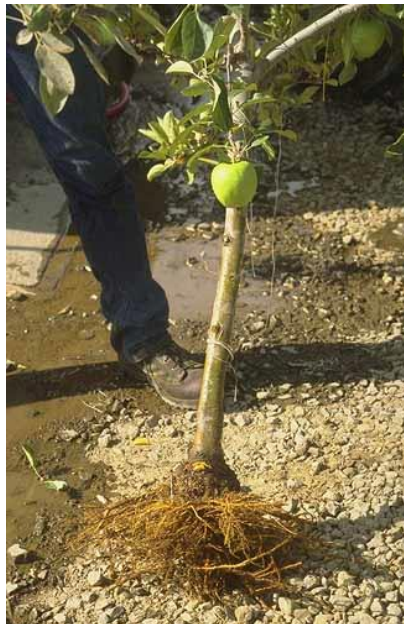
Slika 28. Rak korijena

Tumori se javljaju u toku vegetacije. Bakterija se prenosi sadnim materijalom, priborom za orezivanje i štetnicima.