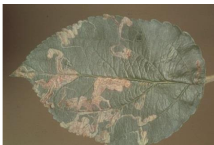
Slika 10. Vijugave mine patuljastog moljca

Krila patuljastog moljca su crne boje sa poprečnom srebrnom crtom. Prezimi kukuljica u tlu. Ima tri generacije godišnje. Let leptira je između ožujka i svibnja. Ličinke izlaze iz jaja i ubušuju se u list praveći kratku vijugavu minu koja se pri kraju proširuje (Slika 10.). Kada se gusjenice potpuno razviju, napuste list i odlaze na kukuljenje u tlu gdje i prezimljuju.