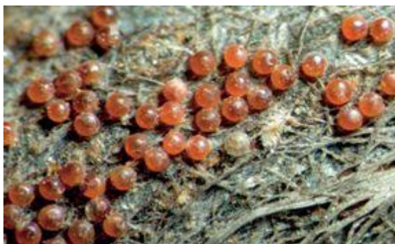
Slika 1. Ljetna jaja crvenog pauka

Zimsko se prskanje drži potrebnim kada se na dužnom metru nađe više od 500-1000 jaja (Ivezić, 2003.). Nakon zimskog pregleda nasada, te ukoliko se primijeti prisutnost crvenog pauka, koriste se uljano organofosforni insekticidi i mineralna ulja. U tijeku vegetacije, potrebno je tretirati akaricidima.