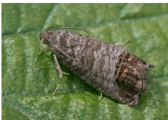
Slika 18. Jabučni savijač – imago

U kokonu ispod kore te u pukotinama na deblu prezimi odrasla gusjenica. Kukulji se u travnju na mjestima prezimljenja. Let leptira počinje krajem travnja i traje do kraja lipnja. Mužjaci se javljaju prije ženki. Nakon kopulacije ženka odlaže jaja na lišće, grančice i plodove. Gusjenice se ubušuju u plodove na mjestu kod čaške i gdje se dodiruju dva ploda ili plod i list. Buši hodnike, koji su puni izmeta. Plodovi koji su napadnuti otpadaju. Početkom srpnja se gusjenice kukolje. Leptiri sljedeće generacije lete od polovice srpnja do polovice kolovoza. Odloži jaja i kada izađu gusjenice ubušuju se u zrele plodove koje površinski oštećuju a zatim se ubuše do jezgre. Izbacuju izmet kroz otvor. Gusjenice u vrijeme zriobe izlaze iz plodova i odlaze na prezimljenje, a dio ostaje u plodu. Jabučni savijač u Hrvatskoj ima 2 generacije godišnje.