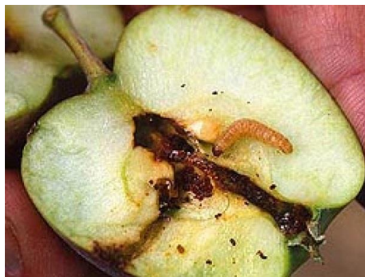
Slika 19. Gusjenica jabučnog savijača