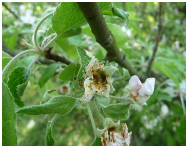
Slika 6. Štete jabučnog cvjetara na cvijetu