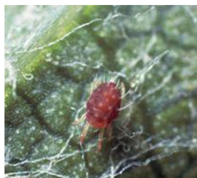
Slika 2. Crveni voćni pauk