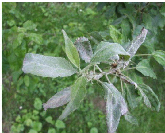
Slika 22. Pepelnica na lišću

Prezimi micelij u zaraženim pupovima i u vidu kleistotecija na kori izboja, pazušcima pupova i na zaraženim listovima. Izboje možemo prepoznati po pepeljastoj prevlaci i pojačanoj dlakavosti. Početkom razvoja pupova u proljeće počinje i razvoj gljivice. Iz unutrašnjosti pupa zajedno s listovima i cvjetovima rastu hife i na površini stvaraju pepeljasto bijelu prevlaku. Prevlaku čini micelij gljivice koja je ektoparazit pa haustorijama ulazi u stanice epiderme i crpi hranu. Kada gljivica fruktificira na prevlaci se stvaraju konidiofori s konidijama. Sekundarne zaraze pupova mladih listova i kasnije plodova uzrokuju konidije.