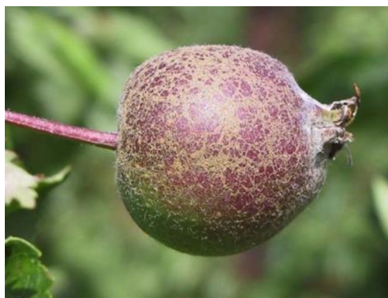
Slika 23. Pepelnica na plodu