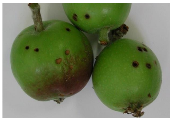
Slika 16. Štete jabučnog svrdlaša na plodu