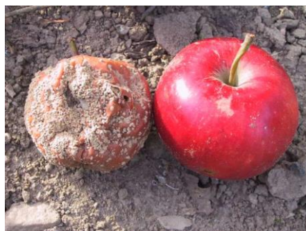
Slika 24. Trulež ploda

Na plodovima se javlja smeđa pjega ispod koje je meso smeđe boje. Pjega se širi i postepeno zahvaća sve veći dio ploda. Na pjegama se javljaju žuto smeđi jastučići koji su poredani u koncentrične krugove, a mogu biti i nepravilno raspoređeni. Plodovi koji su oboljeli postepeno trunu i mumificiraju, pa ostaju visjeti na stablu ili padaju na tlo (Slika 24.). Plodovi su izvori zaraze za sljedeću godinu. U zaraženim i trulim plodovima prezimi gljivica. Na mumijama se sljedeće godine razvijaju jastučići s velikim brojem konidija. Konidije nošene vjetrom i kišom dospijevaju na plod gdje kliju u micelij koji preko rana prodire u plod. Plodovi koji su zreliji podložniji su moniliji.