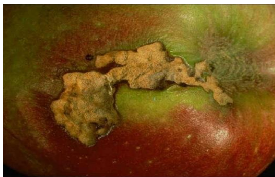
Slika 17. Štete savijača kože na plodu

Gusjenica pravi štete na mjestima gdje se plodovi dodiruju ili oko peteljke i zapreda lišće uz plod. Površina ploda koju izgrizaju je razgranata i nepravilna oblika i to tkivo oplutavi (Slika 17.). Ljetna generacija leptira leti u srpnju i kolovožu i odlažu jaja na plodove, na kojima kasnije gusjenice čine štete. Štete su u obliku sitnih grizotina koje se međusobno ne spajaju na plodu. Gusjenice ove generacije mogu nastaviti praviti štete i u skladištima ako su ubrane s plodovima.