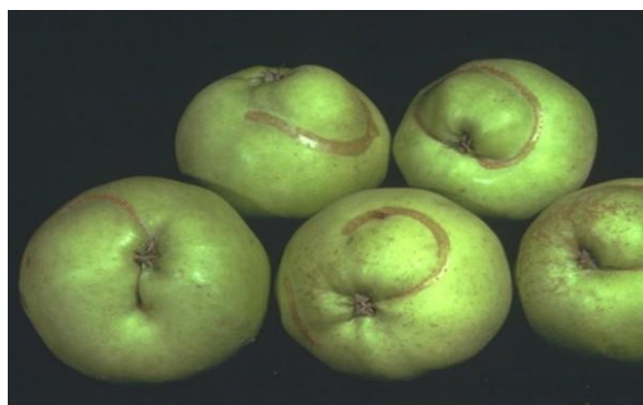
Slika 12. Štete jabučne osice na plodovima