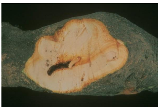
Slika 13. Gusjenica jabučnog staklokrilca

Imago jabučnog staklokrilca je taman, vitkog tijela s crvenim prstenom na zatku. Krila su veličine 15 – 20 mm, i prozirna (Slika 14.). Gusjenice su bez dlačica, smeđe glave a tijelo joj je blijedožute do sivo žute boje i narastu do 22 mm (Slika 13.). Leptiri lete od kraja svibnja do kraja kolovoza. Jaja odlažu pod ozlijeđenu koru stabla u skupinama od 5 jaja (Maceljski i Igrc Barčić,1999.). Iz jaja izlazi gusjenica koja se ubušuje pod koru praveći plitke bušotine i tako se hrani biljnim sokom. Pravi štete i tijekom zime.