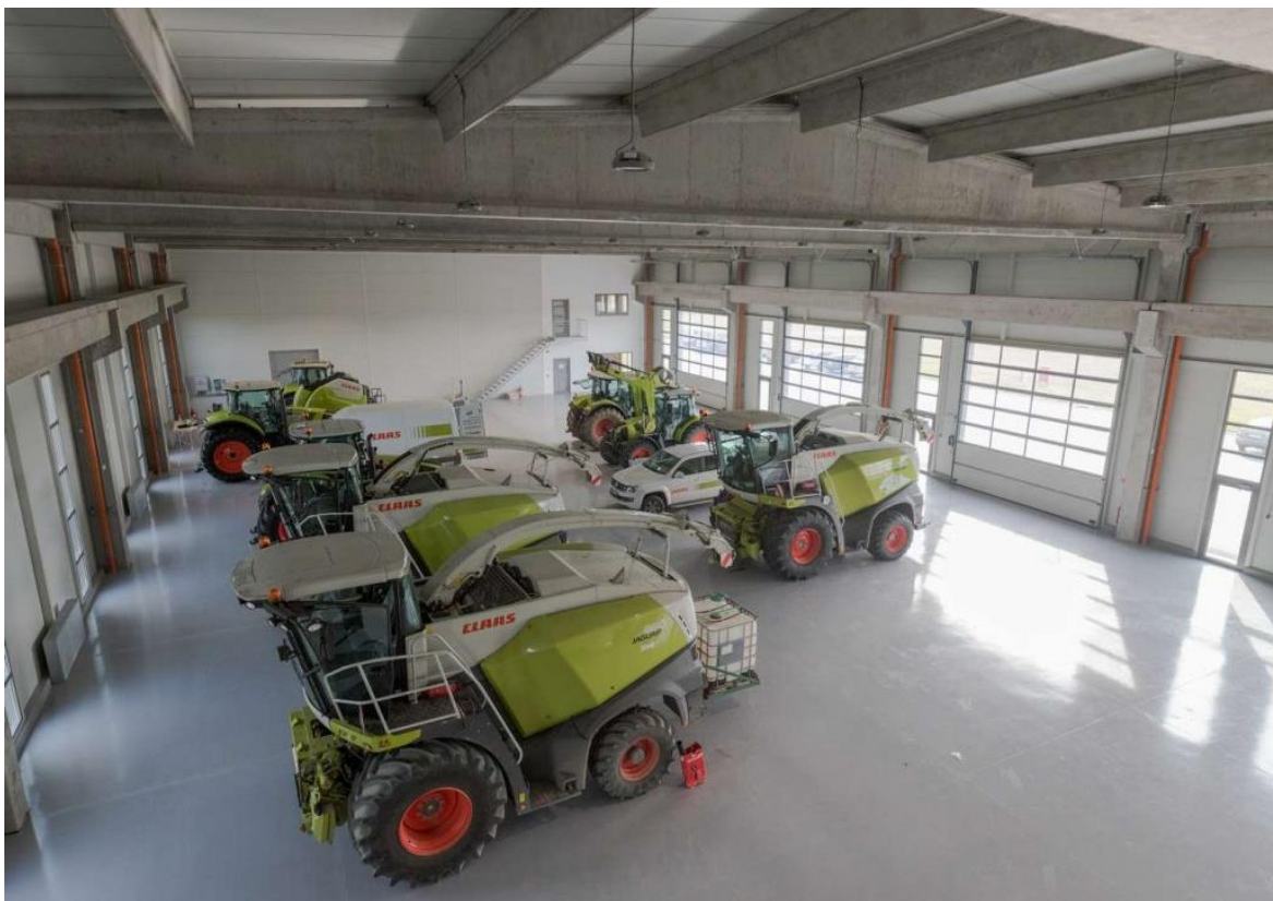
Slika 2. Radionica poljoprivredne mehanizacije.