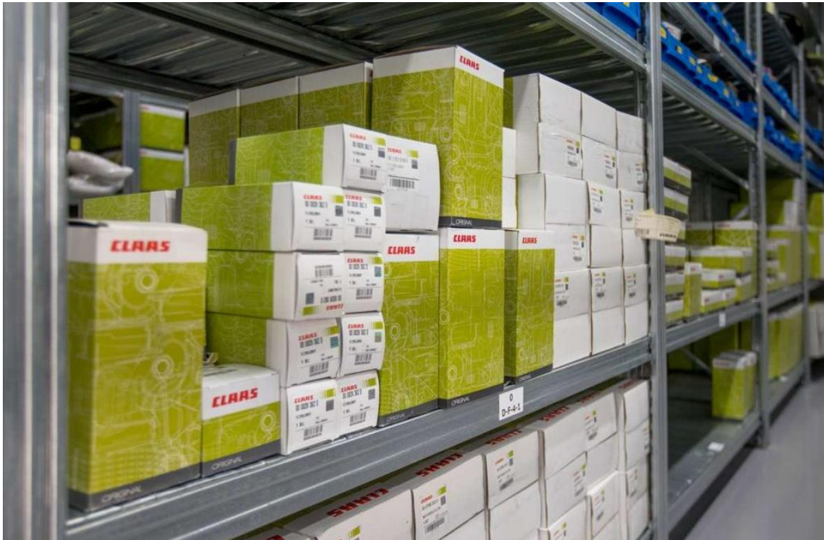
Slika 3. Skladište rezervnih dijelova.