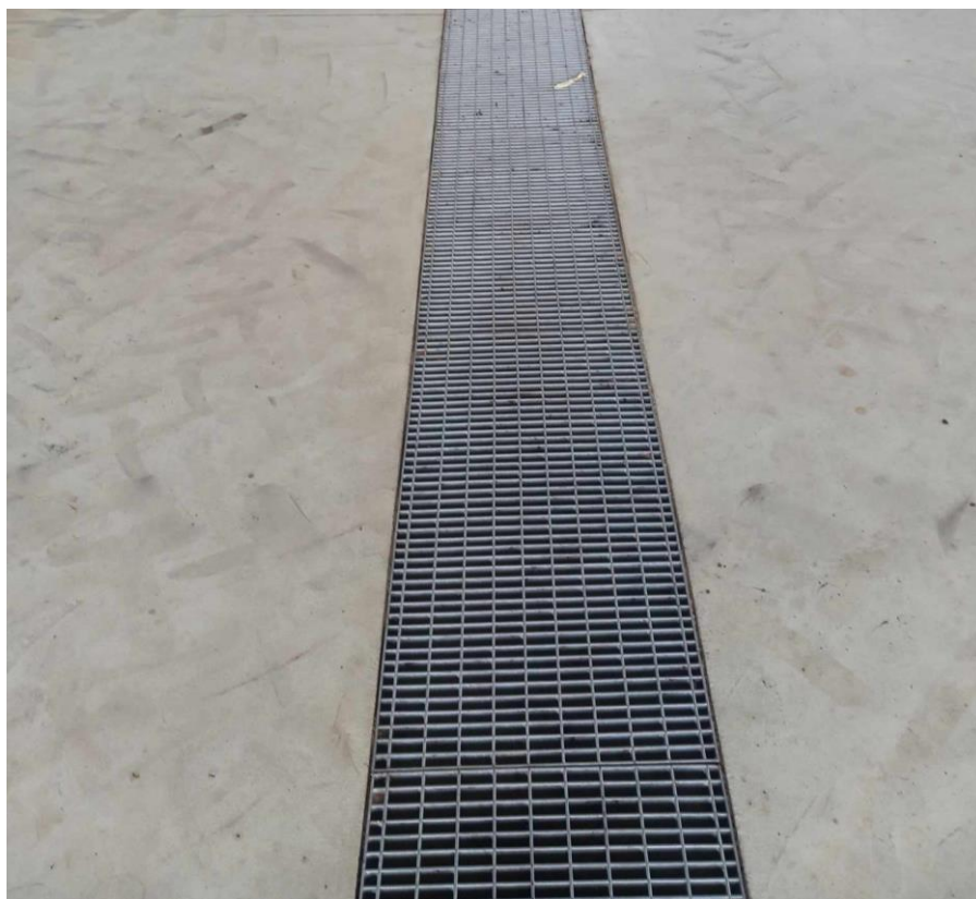
Slika 8. Odvodni kanal sa rešetkom u podu praonice.

Odvodnja sanitarnih otpadnih voda predviđena je odvodnim kanalom (slika 8) koji se nalazi u podu praonice koji vodi u vodonepropusnu sabirnu jamu. Vodonepropusna, sabirna jama locirana je u zelenoj površini na sjeveroistočnom rubu parcele. Otpadne vode od pranja poljoprivrednih strojeva sakupljaju se internim sustavom odvodnje uz prethodno pročišćavanje u odgovarajućem uređaju za prethodno pročišćavanje (taložnica mulja, separator lakih tekućina). Uređaj za prethodno pročišćavanje je odgovarajućeg kapaciteta i učinkovitosti, redovito se čisti od nakupljenog mulja, a mulj se zbrinjava putem ovlaštenog sakupljača otpada. Ispred separatora nalazi se taložnica kapaciteta cca 5,0 m 3 korisne zapremnine radi boljeg pročišćavanja kako se separator ne bi punio muljem.