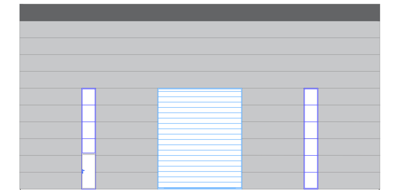
Slika 5. Grafički prikaz jugozapadnog pročelja praonice (Izvor: Arhitektonski projekt).