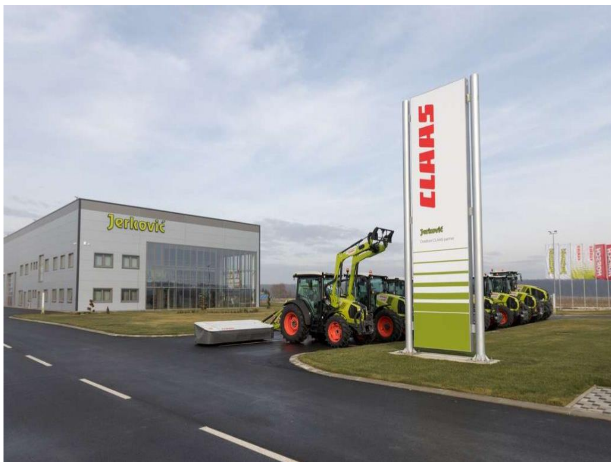
Slika 1. Tvrtka Jerković d.o.o. (Izvor: https://www.jerkovic.hr/ ).

partnera za istočnu Hrvatsku. Jerković d.o.o. također zastupa tvrtke Horsch, Strautmman, Umega Agro te su ekskluzivni zastupnik poljoprivrednih navigacija Trimble za cijelu Republiku Hrvatsku. Danas tvrtka zapošljava 20 djelatnika od kojih je 10 licenciranih i educiranih servisera, te raspolaže sa vlastitim prodajno - edukacijskim i servisnim prostorom (slika 1), te skladištem rezervnih dijelova. Cilj tvrtke je prvenstveno zadovoljavanje kupaca te omogućavanje svim kupcima kupovanje zastupanih strojeva po povoljnim uvjetima, ostvarivanje dugih poslovnih suradnji sa sadašnjim i novim partnerima, te postati prvi izbor kupaca ( https://www.jerkovic.hr/ ).