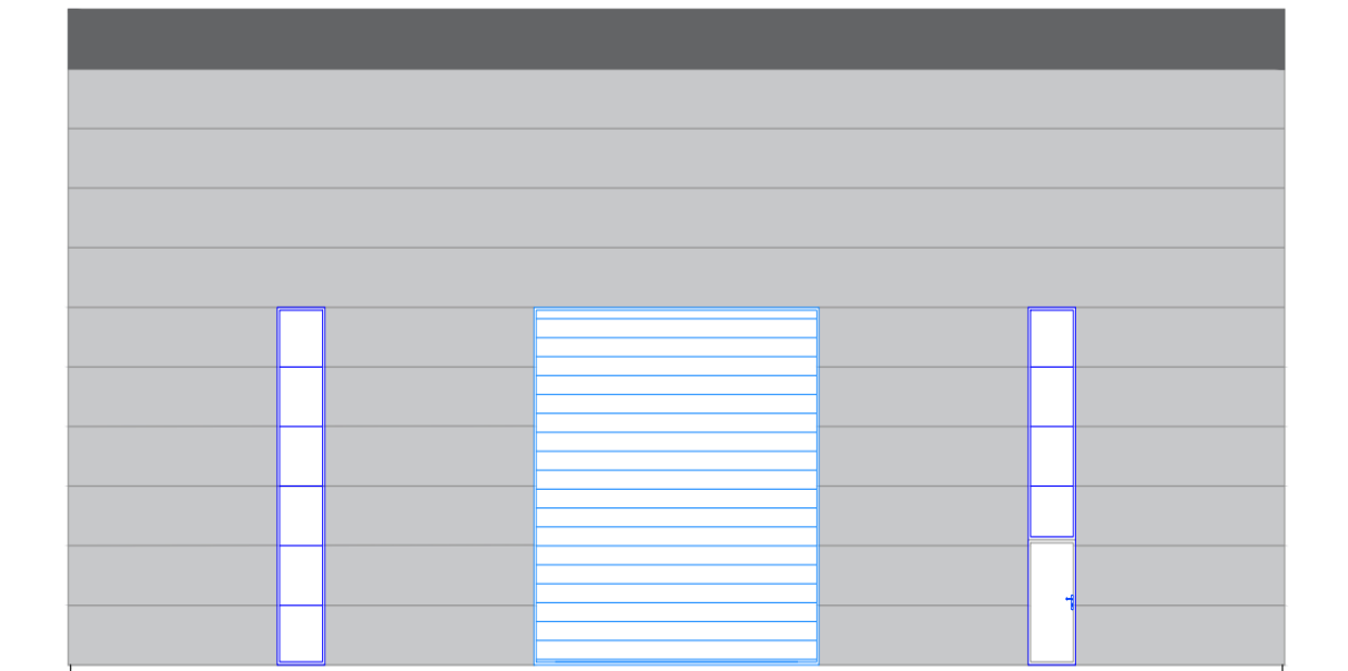
Slika 7. Grafički prikaz sjeveroistočnog pročelja praonice.