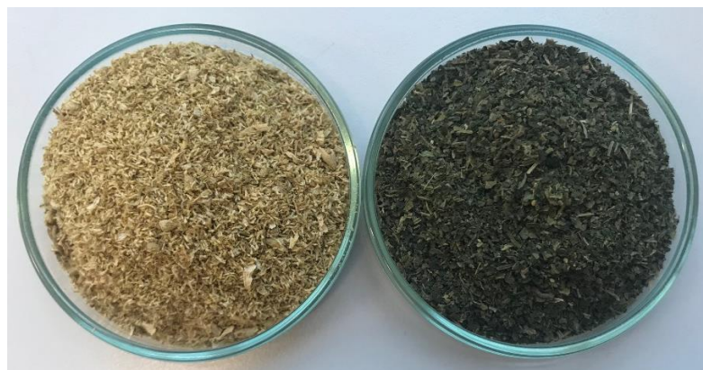
Slika 2. Kamilica i kopriva

praktikumu Fakulteta agrobiotehničkih znanosti Osijek, na Zavodu za animalnu proizvodnju i biotehnologiju.