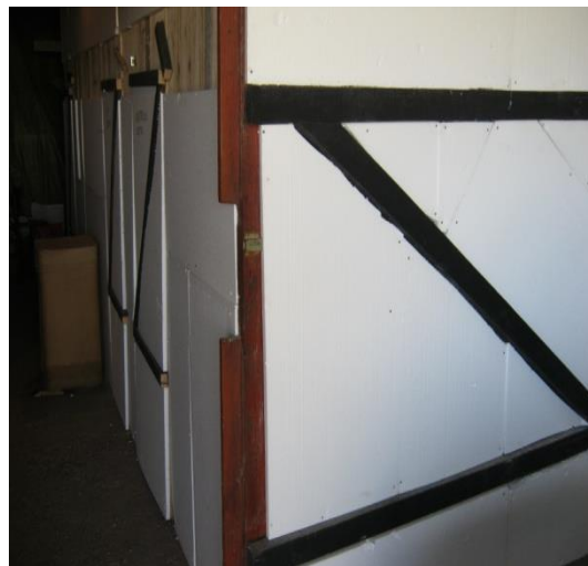
Slika 4. Vanjski dio objekta