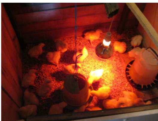
Slika 1. Pokusni pilići u odjeljku

Početak pokusa pilići su hranu i vodu dobivali po volji ( ad libitum ) iz malih zvonastih plastičnih hranilica i pojilica. U objektu temperatura je održavana UV- žaruljama (150 W) (Slika 1.). Pilići su držani podnim načinom uzgoja na stelji od drvenih strugotina.