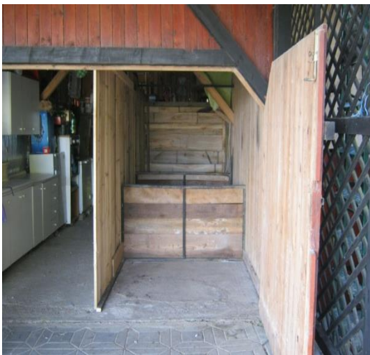
Slika 3. Unutarnji dio objekta

Odjeljci su međusobno bili odijeljeni drvenim pregradama. Svaki odjeljak je imao svoja zasebna vrata kroz koja je bilo omogućeno pristupanje svakoj skupini pilića zasebno (Slika 3 i 4.).