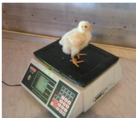
Slika 5. Vaganje pilića

Dnevni prirast je izračunat na temelju dobivene tjelesne mase pilića. Hrana za tov je bila smještena u tri jednake bačve u kojima je bila točno izvagana količina smjese, pa je njena potrošnja po skupinama također mjerena na tjednoj bazi u isto vrijeme kada su vagani i pilići. Svakog tjedna izračunati su tovnj pokazatelj i prosječna konverzija hrane za svaku skupinu na temelju omjera ukupne potrošnje i ukupnog tjednog prirasta tovnih pilića.