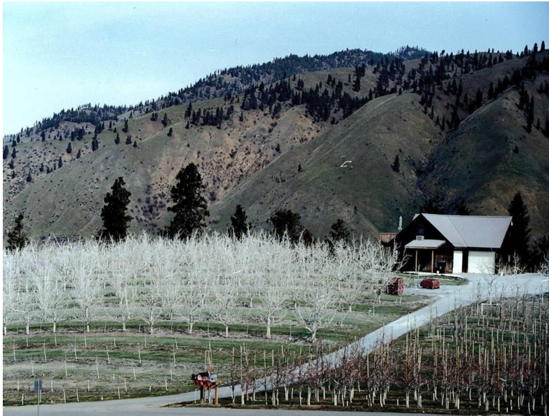
Slika 1. Komercijalne aplikacije voćnjaka s kaolinom

Danas tvrtka „Engelhard Iselin“ proizvodi hidrofobni kaolin “M96-018” premazivanjem čestica kaolina sa zaštićenim hidrofobnim sintetičkim ugljikovodikom. Ovaj proizvod se prije primjene tretira sa 98 %-tnim metanolom, kako bi se mogao mješati sa vodom i lakše primijeniti na biljku (Glen i Puterka, 2005).