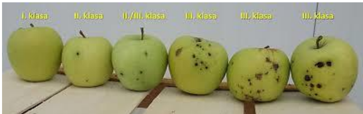
.Slika 3. Klase jabuke sorte 'Golden Delicious'

Obično se svježe voće označava sa tri oznake kvalitete: kao ekstra klasa, prva klasa, i druga klasa. (Slika 3.) „Ekstra klasa“ označava svježe voće najviše kvalitete.