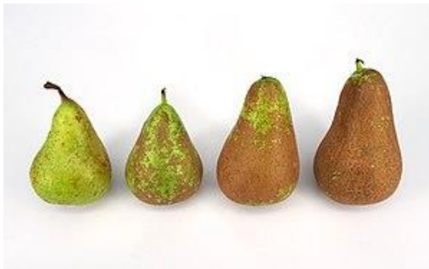
Slika 8. Mrežavost na kruškama

Sugar i sur. (2005) istraživali su učinke aplikacije kaolinske gline i mankozeba na nasadu krušaka source “Comice” tijekom dvije vegetacijske godine. Kaolin je primjenjen pojedinačno i u kombinaciji s mankozebom. Obadva materijala smanjila su mrežavost u obje godine istraživanja. Bolji učinak na smanjenje mrežavosti pokazala je zasebna primjene gline u odnosu na primjenu mankozeba dok je zajednička primjene oba preparata pokazala je najbolji učinak.