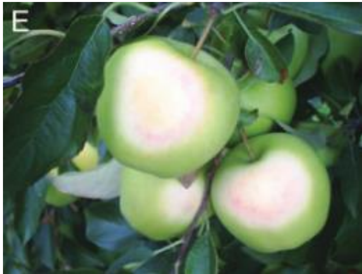
Slika 6. Treći tip sunčevih ožegotina na sorti 'Granny Smith' - fotooksidacije