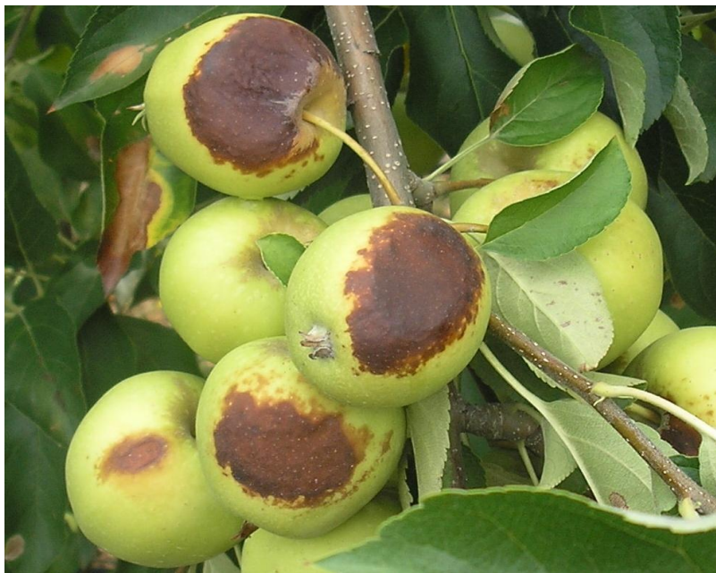
Slika 4. Prvi tip sunčevih ožegotina na sorti 'Golden Delicious' - nekroze

Nekroze su najlakše vidljive vrste opeklina od sunca, s tamnosmeđom ili crnom nekrotičnom mrljom na izloženoj površini ploda. (Slika. 4.), a javljaju kada površinska temperatura ploda jabuke dosegne 52 \pm 1 °C u trajanju od samo 10 minuta (Schrader i sur., 2001.).