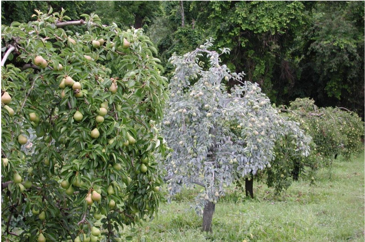
Slika 9. Stablo kruške tretirano kaolinskom glinom

Sugar i sur. (2005.) navode da na rast stabala i produktivnost kruške 'Doyenne du Comice' ('Comice') nisu utjecali programi tretiranja kaolinom (Slika 9.), a u 2 od 3 godine, programi tretiranja kaolinom smanjili su opseg mrežavosti na površini plodova.