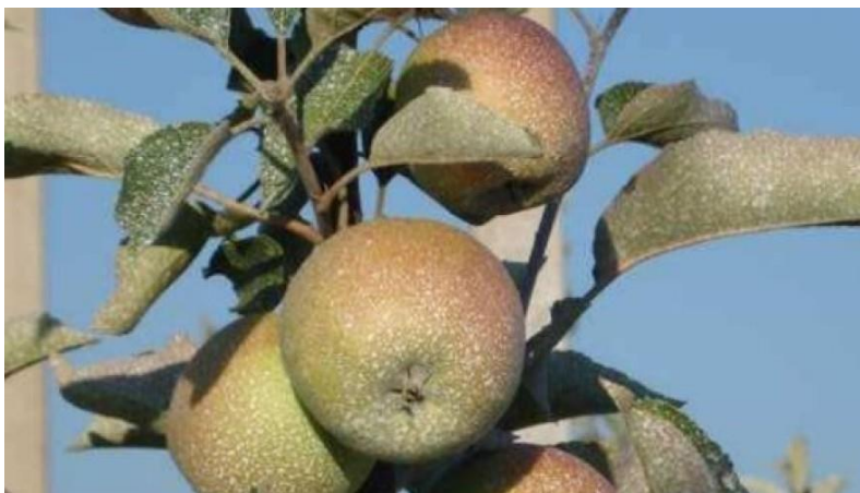
Slika 2. Kaolin kao fizička barijera na plodovima jabuka