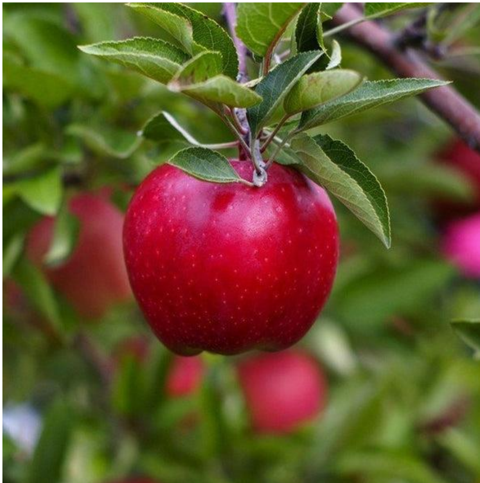
Slika 7. Dobro obojeni Red Delicious

Na količinu antocijana u plodu najveći utjecaj ima svjetlost. Količina svjetlosti potrebna za produkciju antocijana, ovisi pojedinoj sorti a čak ima razlika i između više klonova pojedine sorte. Kod kasnijih sorti potrebno je duže izlaganje ploda utjecaju svjetlosti da bi se sintetizirali antocijani, dok je taj period kod ranih sorti znatno kraći. Budući da svjetlost pozitivno djeluje na nakupljanje PAL enzima i njegovu aktivnost u jabuci, količina svjetla koja dođe na površinu jabuka ključna je u sintezi antocijana.