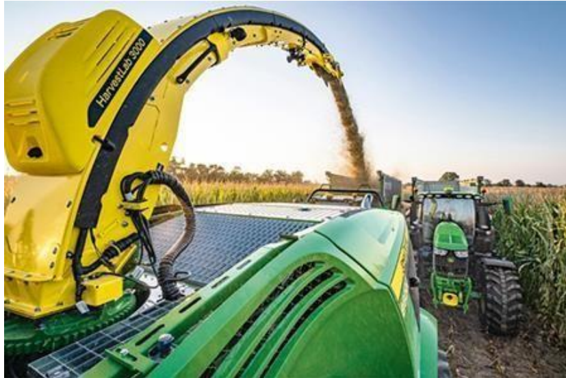
Slika 21. HarvestLab 3000