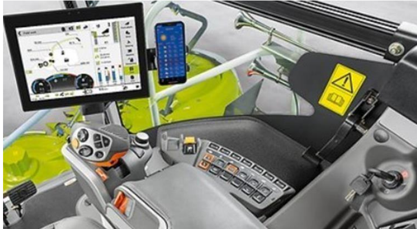
Slika 30. Kabina silažnog kombajna Claas Jaguar 970