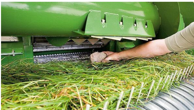
Slika 36. RockProtect sustav