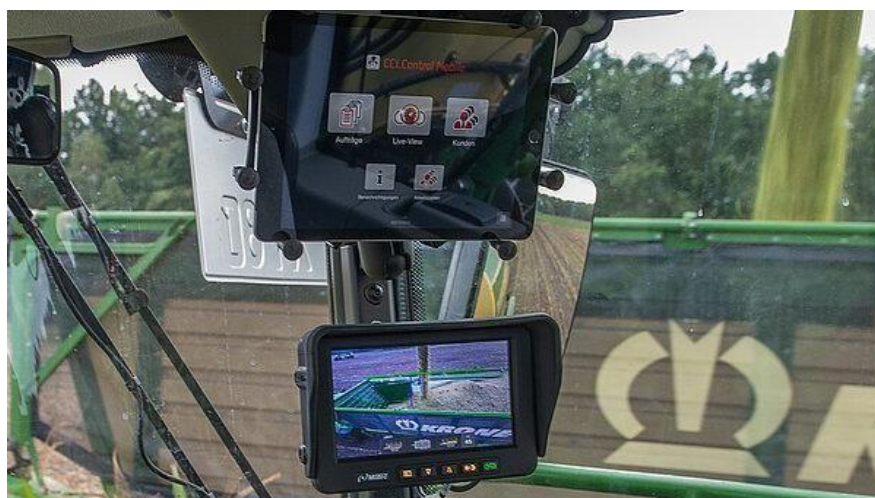
Slika 35. EasyLoad

EasyLoad sustav (Slika 35.) automatskog utovara u tandemu s 3D analizom slike temeljenom na kameri uvelike olakšava punjenje prikolica s niskim ili visokim stranicama koje se kreću uz ili iza žetelice. Sustav kontrolira funkcije otvaranja/zatvaranja izljeva i rotacije lijevo/desno i omogućuje rukovateljima odabir jedne od nekoliko strategija punjenja. Prateći sve funkcije sa zaslona u kabini, operateri su opušteniji. (Winterling i sur., 2020.)