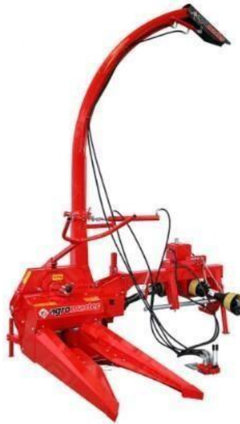
Slika 10. Traktorski nošeni silažni kombajn

Primjeri nošenih i vučenih silažnih kombajna.