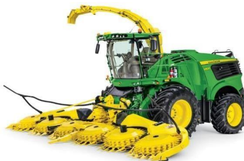
Slika 13. Silažni kombajn John Deere 8300

John Deere je proizvođač poljoprivredne opreme koji je dizajnirao i izrađuje vlastite motore, pogonske sklopove, hidrauliku, rashladne sustave, elektronike i telematike. Potpuno integriran stroj sa svakom dizajniranom komponentom. Poljoprivredni proizvođač John Deere ima dobro razvijenu servisnu mrežu pomoću koje poljoprivrednici mogu biti opskrbljeni na tjednoj, a nekada i dnevnoj razini ukoliko se ukaže potreba. Stručno osposobljena prodajna mreža podrške upoznata sa svakim detaljem. Motor u silokombajnu John Deere 8300 ključni je dio stroja koji mu omogućuje da obavlja svoje zadatke učinkovito i brzo. Ovaj poljoprivredni stroj opremljen je snažnim motorom koji osigurava visoku snagu i brzinu. (Groher i sur., 2020).