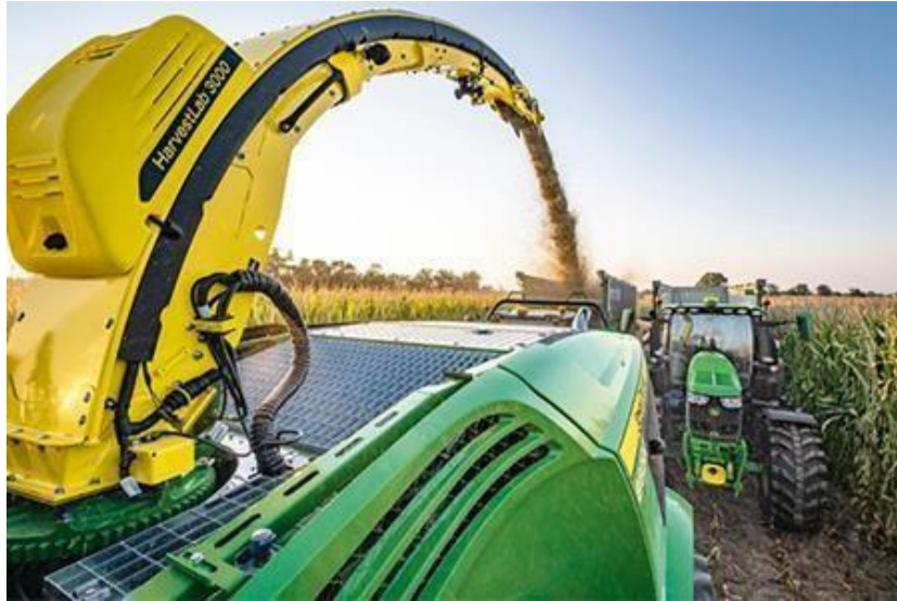
Slika 21. HarvestLab 3000