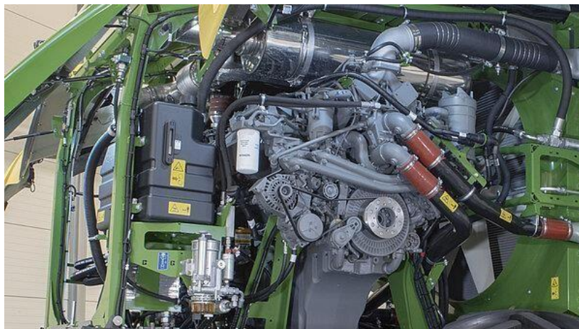
Slika 31. Motor silažnog kombajna

radu, izvanrednoj potrošnji goriva i visokoj učinkovitosti. ( https://www.krone-agriculture.com/en/products/forage-harvesters/big-x-680-780-880-1180 )