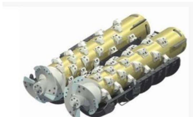
Slika 9. Sječakara sa rotoudaračima (Izvor: https://www.mdpi.com/2077-0472/13/5/1006 )

(Izvor: https://sar.rostselmash.com/products/forage_harvesters/RSM_1401 )