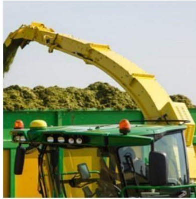
Slika 19. Cijev za izbacivanje stočne krme