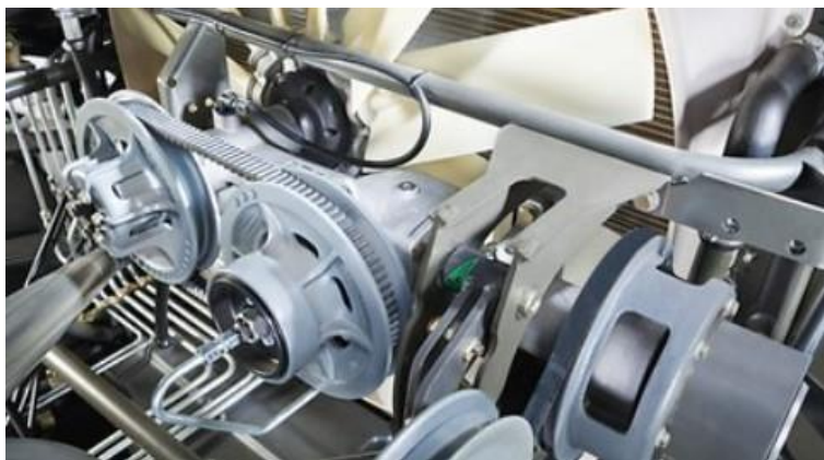
Slika 24. Varijatorski pogon hlađenja