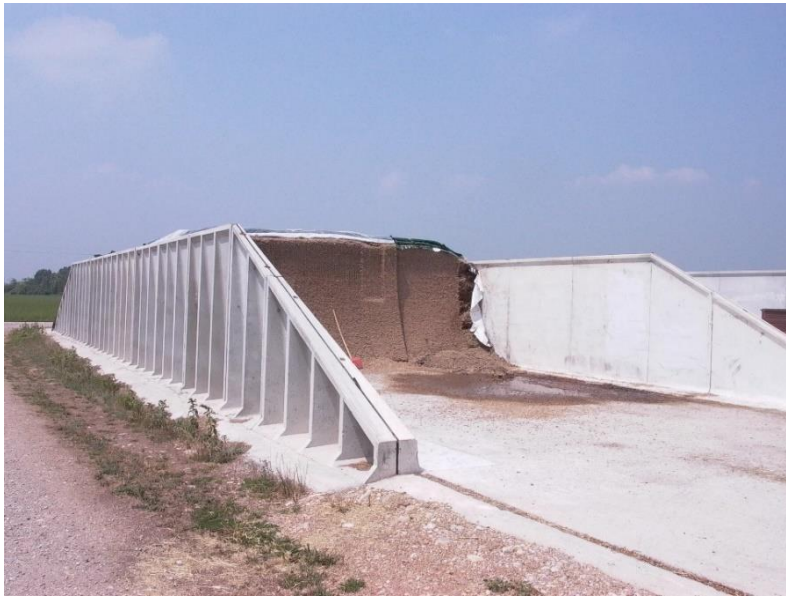
Slika 6. Silaža u betonskom montažnom silosu

Primjer silaže spremljene u betonskom montažnom silosu.