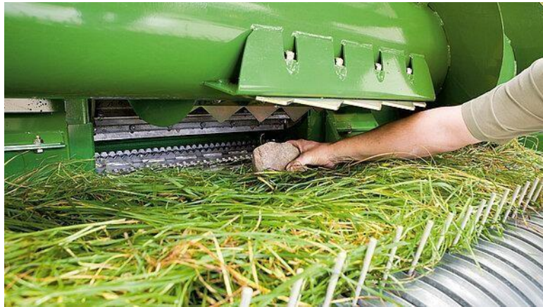
Slika 36. RockProtect sustav