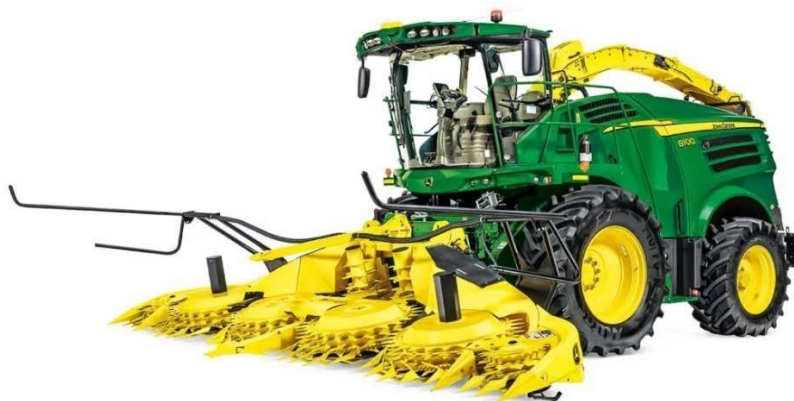
Slika 12. Samohodni silažni kombajn