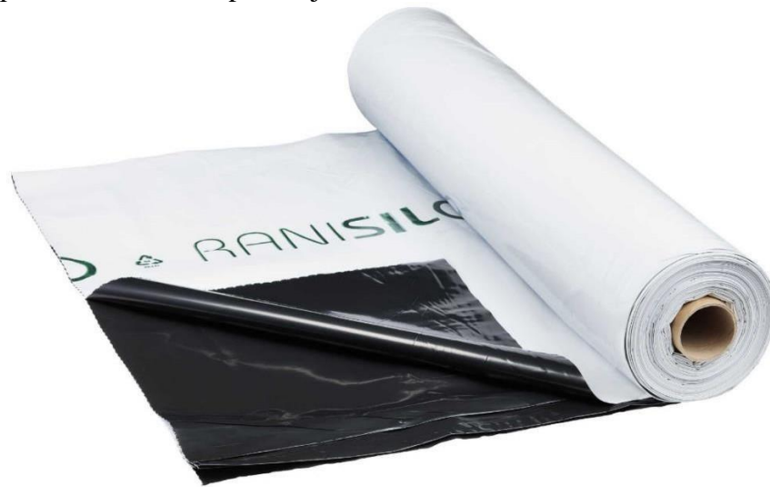
Slika 4. Folija za silažu

Podfolija je prozirna folija koja je tanja od folije i ona ide na silažu, a folija je deblja i njezina bijela strana ide na površinu, a crna na podfoliju.