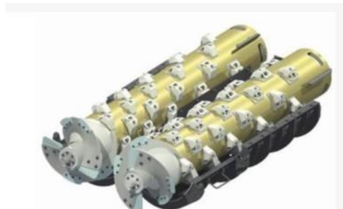
Slika 9. Sječakara sa rotoudaračima

(Izvor: https://sar.rostselmash.com/products/forage_harvesters/RSM_1401 )