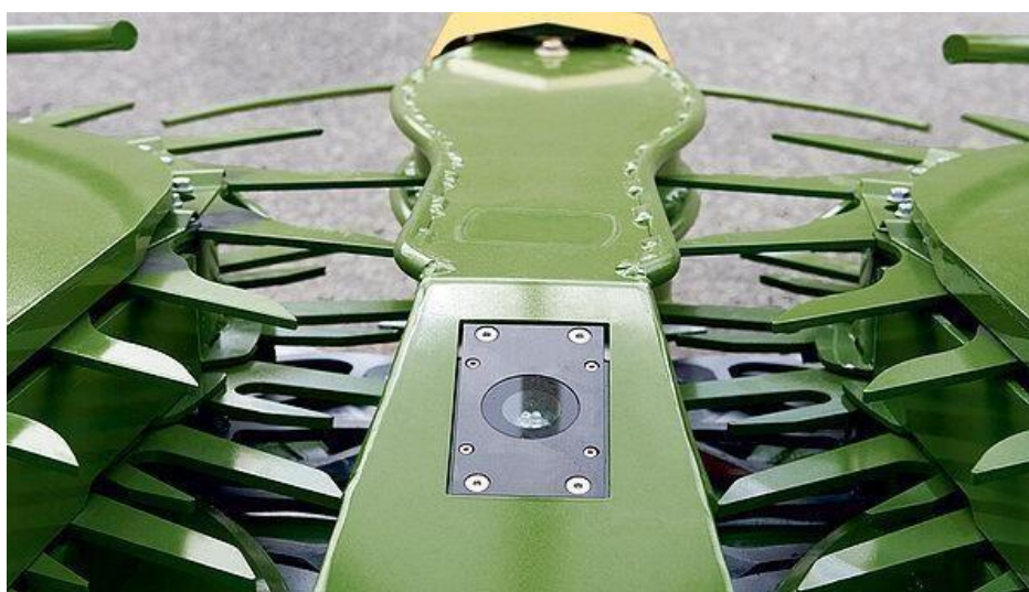
Slika 34. AutoScan

Foto-optički senzor u sredini hedera (Slika 34. ) kukuruza mjeri zrelost biljke i automatski prilagođava duljinu rezanja. Zeleni kukuruz reže se na duže komade kako bi se dobila veća struktura i smanjilo istjecanje u stezaljci. Usporedbe radi, suhi i lomljivi kukuruz reže se na kratke komade kako bi se povećala zbijenost. Na taj način AutoScan smanjuje opterećenje operatera i smanjuje potrošnju goriva optimizacijom duljine reza. (Winterling i sur., 2020.)