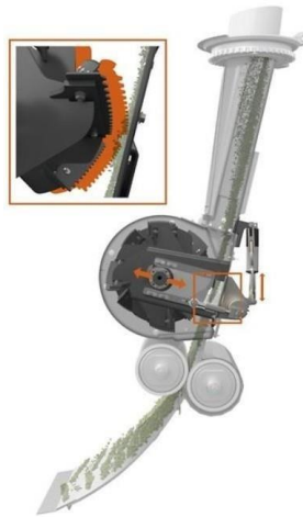
Slika 28. Protok usjeva