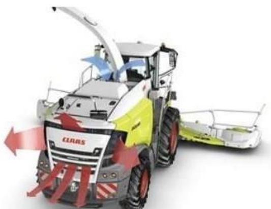
Slika 25. Prikaz protoka zraka