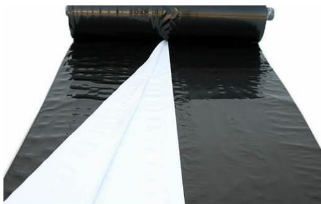
Slika 3. Podfolija za silažu

Za silažu je važno da se ona dobro ugazi jer se pri tome izbija zrak iz mase. Zrak ne smije biti prisutan jer se fermentacija silaže odvija u anaerobnim uvjetima (uvjeti bez prisustva kisika) gdje počinje mliječno-kiselo vrenje koje stvara idealnu pH vrijednost (4,4 – 4,6). Za kvalitetniju fermentaciju pri samom sjeckanju stabljike dodaje se otopina vode s inokulantima. Inokulanti su sredstva koja pospješuju fermentaciju silaže. Nakon što se silaža dobro ugazi, potrebno ju je prekriti podfolijom (Slika 3.) i folijom (Slika 4.). Na Slici 5. prikazano je gaženje silaže.. Primjer silaže spremljene u betonskom montažnom silosu (Slika 6.).