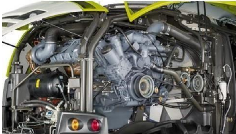
Slika 23. Motor silažnog kombajna Claas Jaguar 970