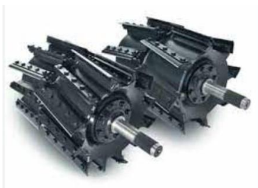
Slika 7. Noževi na bubnju