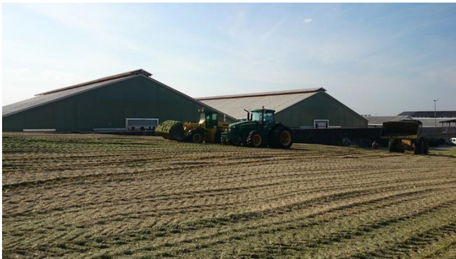
Slika 5. Gaženje silaže