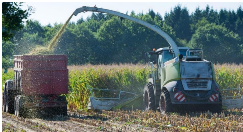
Slika 2. Siliranje