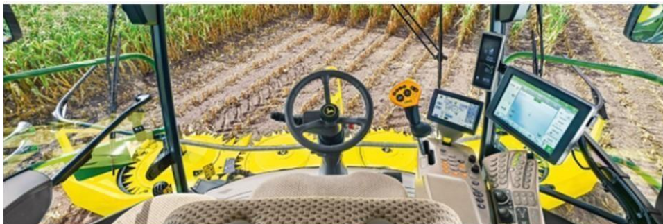
Slika 22. Kabina John Deere 8300

Kabina u silažnom kombajnu John Deere 8300 napravljena je za osobu koja upravlja poljoprivrednim strojem (Slika 22.). Kabina je dovoljno prostrana i opremljena najnovijom tehnologijom, monitorima za praćenje rada stroja, ergonomskim sjedalom sa zračnim podešavanjem položaja sjedenja. Također je povećana vidljivost zbog većeg stakla na kabini i višeg položaja sjedenja. To dodatno olakšava upravljanje strojem te je lakše izdržati višesatne smjene u stroju. ( https://www.deere.com/en/hay-forage/harvesting/self-propelled-forage-harvesters/8300-forage-harvester/ )