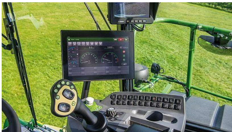
Slika 37. Kabina silažnog kombajna

Prostrana Silent Space kabina nudi idealno okruženje (Slika 37.). Pružajući izdašan prostor operateru i putniku, pruža potpuno klimatizaciju i apsolutno funkcionalno radno mjesto. Ekskluzivna LiftCab nudi panoramski pogled s visine do 70 cm. (Winterling i sur., 2020.)