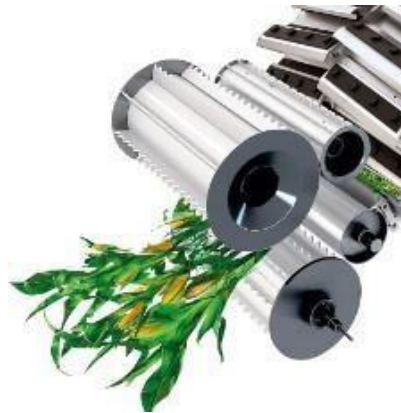
Slika 8. Sječakara s noževima na disku

Sve više uvode se telematski sustavi za automatsko upravljanje narudžbama i kontrolu lanca sjeckanja (siliranja), što doprinosi uštedi rada i povećanju učinkovitosti rada. (Schramm i Sümening, 2017.)