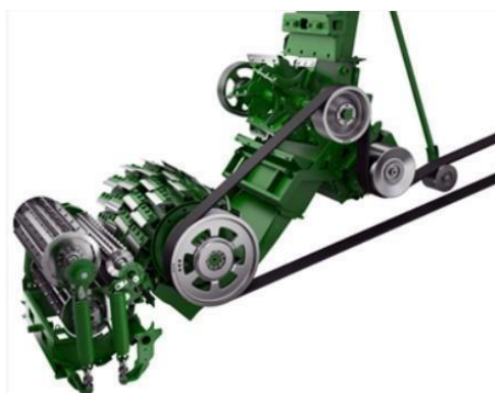
Slika 17. Sječakara i uređaj za gnječenje zrna

Prilikom odabira novog silažnog kombajna John Deere može se odabrati bubanj s 40, 48, 56 ili 64 noževa za sjeckanje (rezanje), ovisno o potrebama rukovatelja. Promjer bubnja je 680 mm. Frekvencija vrtnje bubnja je 1.100 ili 1.200 min -1 . Konstrukcija bubnja s noževima DuraDrum nudi širok raspon duljina sječke, koje ovise o broju noževa i brzini vrtnje bubnja. Za bubanj s 40 noževa raspon rezanja je između 7 i 26 mm. S povećanjem broja noževa na bubnju, smanjuje se područje rezanja krme. Oštrica noževa omogućava automatsko brušenje pri zakretanju vrtnje bubnja unatrag. (Slika 17.). Drobilica zrna Premium KP ima valjke promjera 240 mm i 32 % razlike u brzini vrtnje. Drobilicu zrna XStream KP razvijena je od stručnjaka iz Scherera , vodećeg proizvođača valjaka za obradu zrna. Valjci za gnječenje imaju promjer 250 mm i moraju se okretati različitim brzinama. Ova razlika u brzini vrtnje iznosi 50 %, što omogućuje ravnomjerno usitnjena zrna bez obzira na duljinu reza.