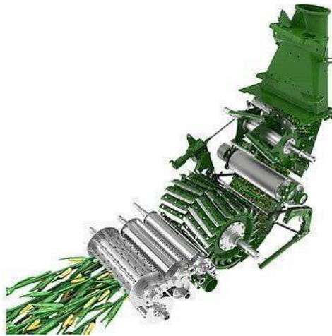
Slika 32. Protok usjeva

Prikaz protoka usjeva kod silažnog kombajna Krone Big x 880.