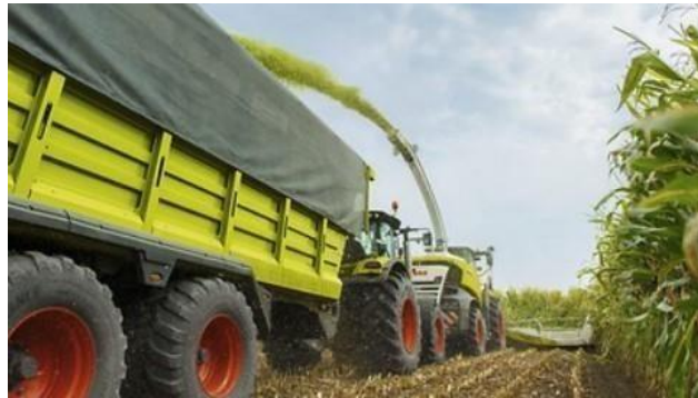
Slika 29. Pražnjenje u prikolicu