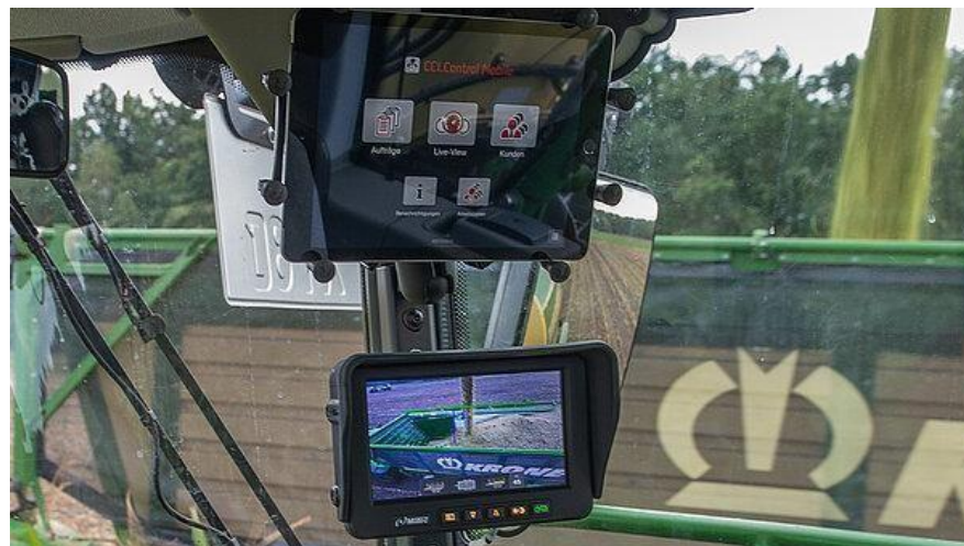
Slika 35. EasyLoad

EasyLoad sustav (Slika 35.) automatskog utovara u tandemu s 3D analizom slike temeljenom na kameri uvelike olakšava punjenje prikolica s niskim ili visokim stranicama koje se kreću uz ili iza žetelice. Sustav kontrolira funkcije otvaranja/zatvaranja izljeva i rotacije lijevo/desno i omogućuje rukovateljima odabir jedne od nekoliko strategija punjenja. Prateći sve funkcije sa zaslona u kabini, operateri su opušteniji. (Winterling i sur., 2020.)