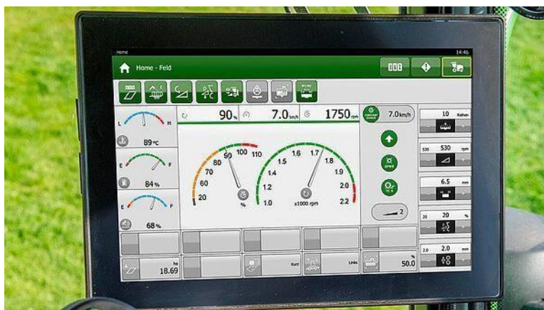
Slika 33. ConstantPower

( https://www.krone-agriculture.com/en/products/forage-harvesters/big-x-680-780-880-1180 )