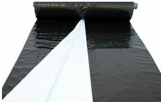
Slika 3. Podfolija za silažu

Za silažu je važno da se ona dobro ugazi jer se pri tome izbija zrak iz mase. Zrak ne smije biti prisutan jer se fermentacija silaže odvija u anaerobnim uvjetima (uvjeti bez prisustva kisika) gdje počinje mliječno-kiselo vrenje koje stvara idealnu pH vrijednost (4,4 – 4,6). Za kvalitetniju fermentaciju pri samom sjeckanju stabljike dodaje se otopina vode s inokulantima. Inokulanti su sredstva koja pospješuju fermentaciju silaže. Nakon što se silaža dobro ugazi, potrebno ju je prekriti podfolijom (Slika 3.) i folijom (Slika 4.). Na Slici 5. prikazano je gaženje silaže.. Primjer silaže spremljene u betonskom montažnom silosu (Slika 6.).