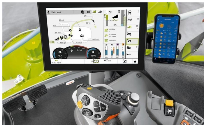
Slika 26. Računalo Cebis

od 12 %. Radi povećanja učinkovitosti i smanjenja potrošnje, kombajn Jaguar održava postavljenu brzinu konstantnom i regulira snagu motora i brzinu vožnje u skladu sa žetvenom masom. S povećanjem protoka mase smanjuje se brzina vožnje. Pri nižem protoku mase snaga motora automatski se smanjuje. Računalo Cebis sa zaslonom osjetljivim na dodir omogućuje brz i jednostavan pristup svim funkcijama stroja (Slika 26.). Najvažnije su čak izravno podesive putem prekidača u naslonu za ruke. Bez obzira je li riječ o neravnoj vožnji po terenu ili neiskusnom vozaču, osigurano je precizno rukovanje. Po potrebi Jaguar ima mogućnost prilagodbe vožnje na četiri načina kojima upravlja rukovatelj iz kabine. ( https://www.claasofamerica.com/product/forageharvesters/jaguar900-series/engine-running-gear ).