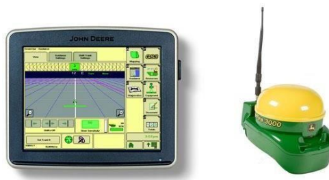
Slika 18. Satelitska antena John Deere Starfire 3000

Sustavi za navođenje silažnog kombajna Autotrac i RowSense pomažu u iskorištavanju pune širine žetvenih uređaja (hedera). Preklapanje prolaza je manje, a radna brzina siliranja je veća. Autotrac je satelitski navigacijski sustav John Deere, koji također omogućuje pozicioniranje silažnog kombajna na polju (Slika 18.). RowSense predstavlja elektromehanički sistem koji primjenjuje digitalne detektore na hederu za kukuruz koji prate položaj biljaka. Signal iz detektora se prenosi u senzor ugla kotača i kotači se automatski prilagođavaju redovima kukuruza. Ovaj sustav prikladan je za među redne razmake kukuruza od 50 do 85 cm ( https://www.deere.com/en/hay-forage/harvesting/self-propelled-forage-harvesters/8300-forage-harvester/ ).