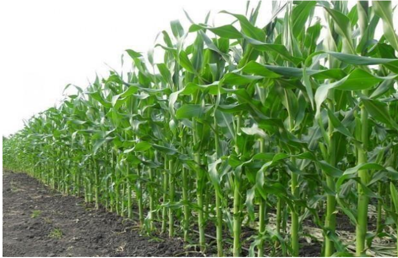
Slika 1. Stabljike kukuruza za silažu