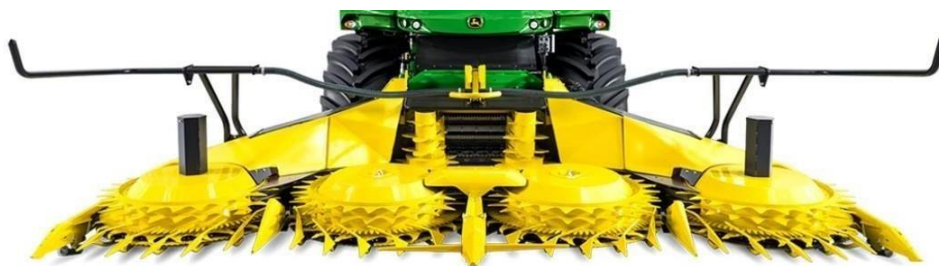
Slika 16. Kukuruzni heder.

300plus ima četiri modela, radne širine od 4,5 do 9 m. U seriji 400plus također postoje 4 modela, ali radna širina je od 4,5 do 7,5 m. Ova serija namijenjena je berbi vrlo visokog kukuruza, s velikim hektarskim prinosom. (Poppa i sur., 2021.)