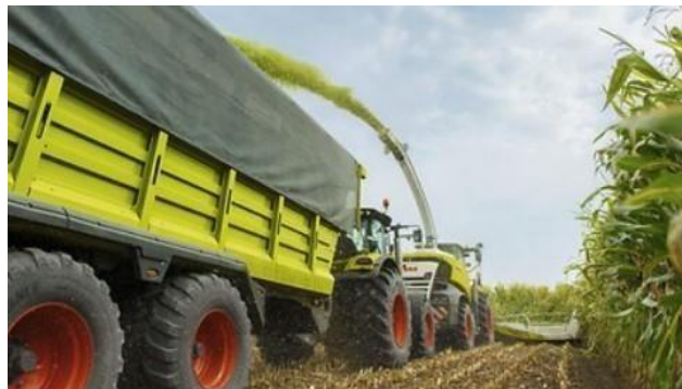
Slika 29. Pražnjenje u prikolicu