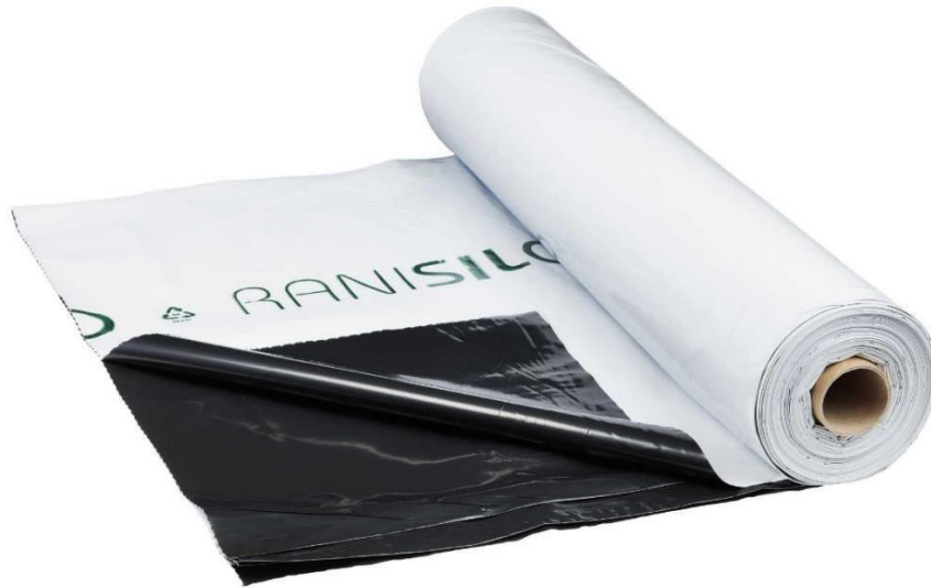
Slika 4. Folija za silažu

Podfolija je prozirna folija koja je tanja od folije i ona ide na silažu, a folija je deblja i njezina bijela strana ide na površinu, a crna na podfoliju.