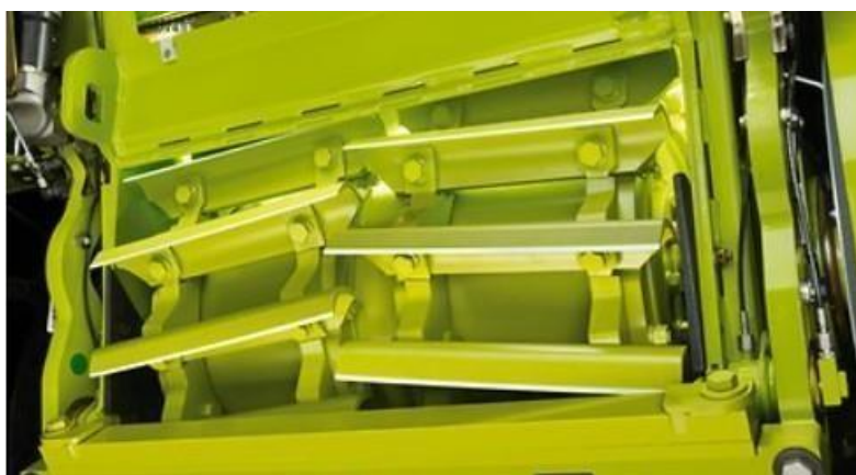
Slika 27. V-MAX noževi