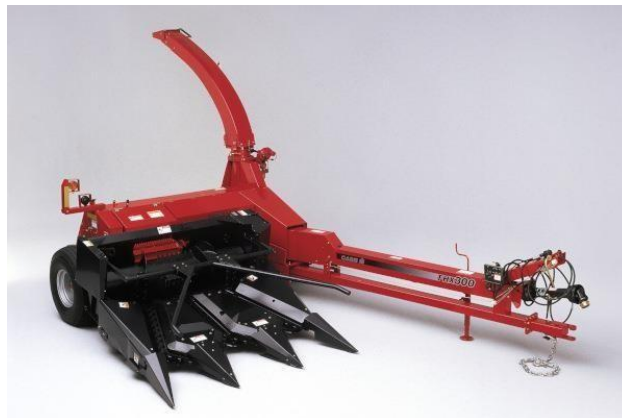
Slika 11. Traktorski vučeni silažni kombajn