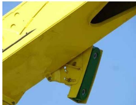
Slika 20. Kamera na utovarnoj cijevi