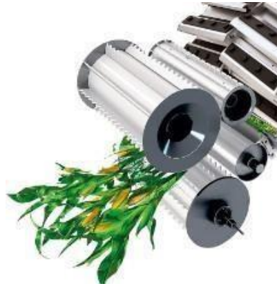
Slika 8. Sječakara s noževima na disku

Sve više uvode se telematski sustavi za automatsko upravljanje narudžbama i kontrolu lanca sjeckanja (siliranja), što doprinosi uštedi rada i povećanju učinkovitosti rada. (Schramm i Sümening, 2017.)