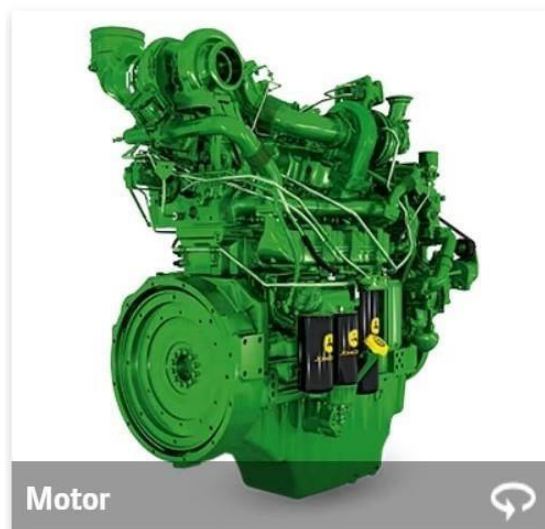
Slika 14. Motor silažnog kombajna

(Poppa i sur., 2021.). U Tablici 1. su Brkić i sur. (2000). prikazali snagu motora (kW) za pogon silažnih kombajna, mase kombajna (kg) i deklariranog protoka mase (t/ha), te broj redova za berbu kukuruza.