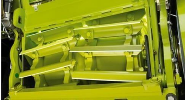
Slika 27. V-MAX noževi