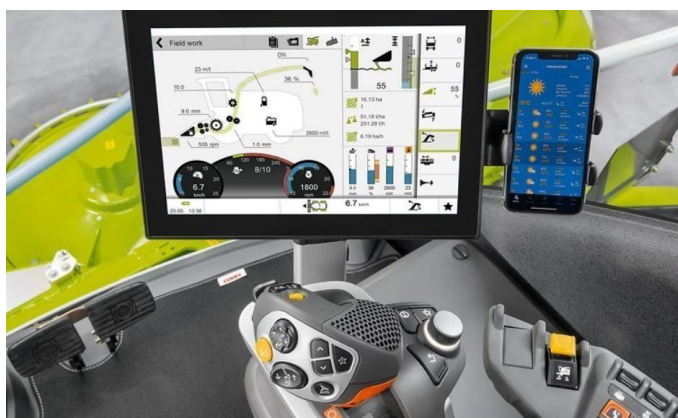
Slika 26. Računalo Cebis

od 12 %. Radi povećanja učinkovitosti i smanjenja potrošnje, kombajn Jaguar održava postavljenu brzinu konstantnom i regulira snagu motora i brzinu vožnje u skladu sa žetvenom masom. S povećanjem protoka mase smanjuje se brzina vožnje. Pri nižem protoku mase snaga motora automatski se smanjuje. Računalo Cebis sa zaslonom osjetljivim na dodir omogućuje brz i jednostavan pristup svim funkcijama stroja (Slika 26.). Najvažnije su čak izravno podesive putem prekidača u naslonu za ruke. Bez obzira je li riječ o neravnoj vožnji po terenu ili neiskusnom vozaču, osigurano je precizno rukovanje. Po potrebi Jaguar ima mogućnost prilagodbe vožnje na četiri načina kojima upravlja rukovatelj iz kabine. ( https://www.claasofamerica.com/product/forageharvesters/jaguar900-series/engine-running-gear ).