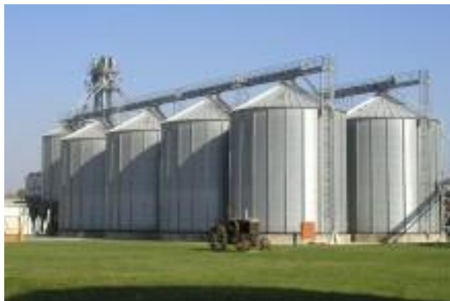
Slika 2. Silosi

Silos, koji se smatraju najmodernijim tipom skladišta za zrnate proizvode. Većina današnjih silosa ima kompletnu mehanizaciju za transport proizvoda, automatsko upravljanje i gotovo stalnu kontrolu proizvoda. Moderni silosi grade se u kompleksima, a često imaju i sušare.