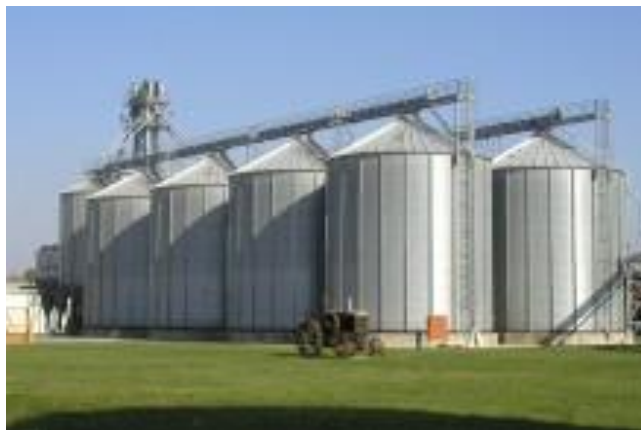
Slika 2. Silosi

Silos, koji se smatraju najmodernijim tipom skladišta za zrnate proizvode. Većina današnjih silosa ima kompletnu mehanizaciju za transport proizvoda, automatsko upravljanje i gotovo stalnu kontrolu proizvoda. Moderni silosi grade se u kompleksima, a često imaju i sušare.