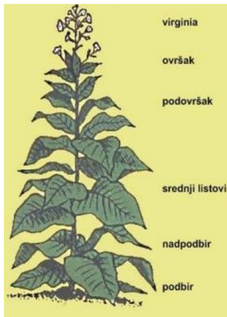
Slika 2. Insercije listova duhana

Cvijet biljke stoji pojedinačno ili zbirno tvoreći grozdove, a boja varira od ružičaste, žute ili bijele (www.agroklub.hr, lipanj 2022.). Plod duhana je tobolac koji može sadržavati manju ili veću količinu sjemenki, a može biti i sterilan. Sjeme je sitno, okruglo te smeđe boje, a masa tisuću zrna iznosi 0,07 grama- 0,1 gram. Zrelo sjeme ne sadrži nikotin. Duhan je samooplodna biljka, a najbolje uspijeva na rastresitim i lakšim tlima, neutralne do blago kisele pH reakcije. Najveće potrebe za vodom su u proizvodnji presadnica te nakon rasađivanja kada je biljke potrebno zalijevati. Za kvalitetan urod potrebno je provoditi plodored, a listovi koji postepeno zriju beru se u vrijeme tehničke zriobe.