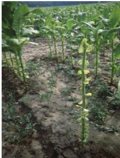
Slika 1. Stabljika duhana

Listovi duhana rastu iz nodija stabljike, a broj listova varira od 20 komada do 100 komada listova po biljci. listovi duhana su značajni za proizvodnju jer se u njima nalaze eterična ulja i smole koji imaju važnu ulogu u aromi duhana. listovi duhana su podijeljeni u insercije te mogu biti podbir, nadpodbir, srednji listovi, podvršak i ovršak.