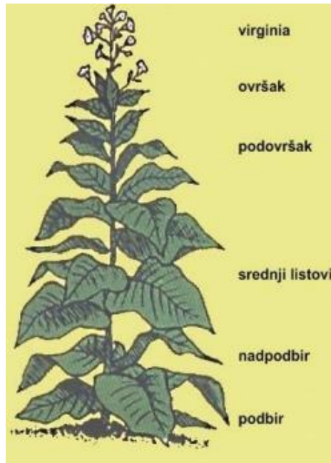
Slika 2. Insercije listova duhana

Cvijet biljke stoji pojedinačno ili zbirno tvoreći grozdove, a boja varira od ružičaste, žute ili bijele (www.agroklub.hr, lipanj 2022.). Plod duhana je tobolac koji može sadržavati manju ili veću količinu sjemenki, a može biti i sterilan. Sjeme je sitno, okruglo te smeđe boje, a masa tisuću zrna iznosi 0,07 grama- 0,1 gram. Zrelo sjeme ne sadrži nikotin. Duhan je samooplodna biljka, a najbolje uspijeva na rastresitim i lakšim tlima, neutralne do blago kisele pH reakcije. Najveće potrebe za vodom su u proizvodnji presadnica te nakon rasađivanja kada je biljke potrebno zalijevati. Za kvalitetan urod potrebno je provoditi plodored, a listovi koji postepeno zriju beru se u vrijeme tehničke zriobe.