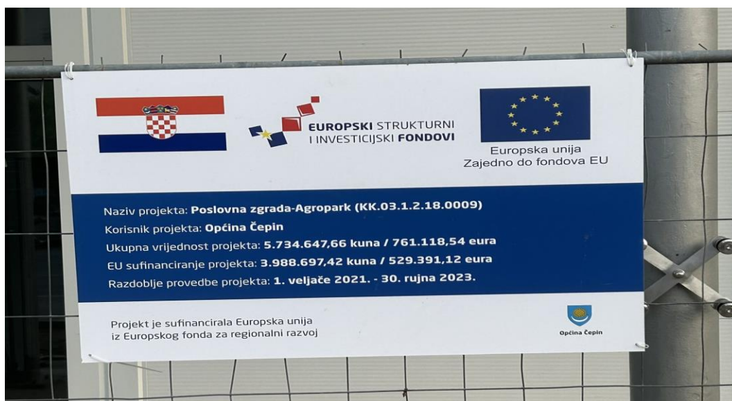
Slika 5. Plakat za poslovnu zgradu-Agropark

Projekt je sufinanciran iz Europskog fonda za regionalni razvoj i to na način da Europska unija sudjeluje u iznosu od 70%, dok je ostatak od 30% sufinanciran sredstvima Općine Čepin. Uz radove izgradnje, projektom Poslovna zgrada-Agropark obuhvaćeno je i opremanje Agroparka te ostali popratni troškovi. Poslovna zgrada Agroparka će sadržavati izložbeno-prodajni prostor gdje će se nalaziti štandovi, a sastoji se od 1 natkrivenog prostora od 211,32 m 2 , te dva zatvorena prostora – 15,89 m 2 i 16,36 m 2 , sanitarnog čvora i skladišta. Ukupna površina iznosi 350 m 2 (cepin.hr).