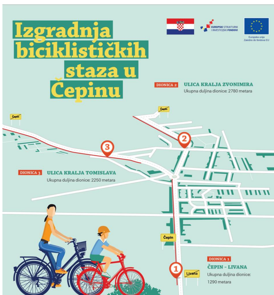
Slika 3. Plakat za izgradnju biciklističkih staza u Čepinu