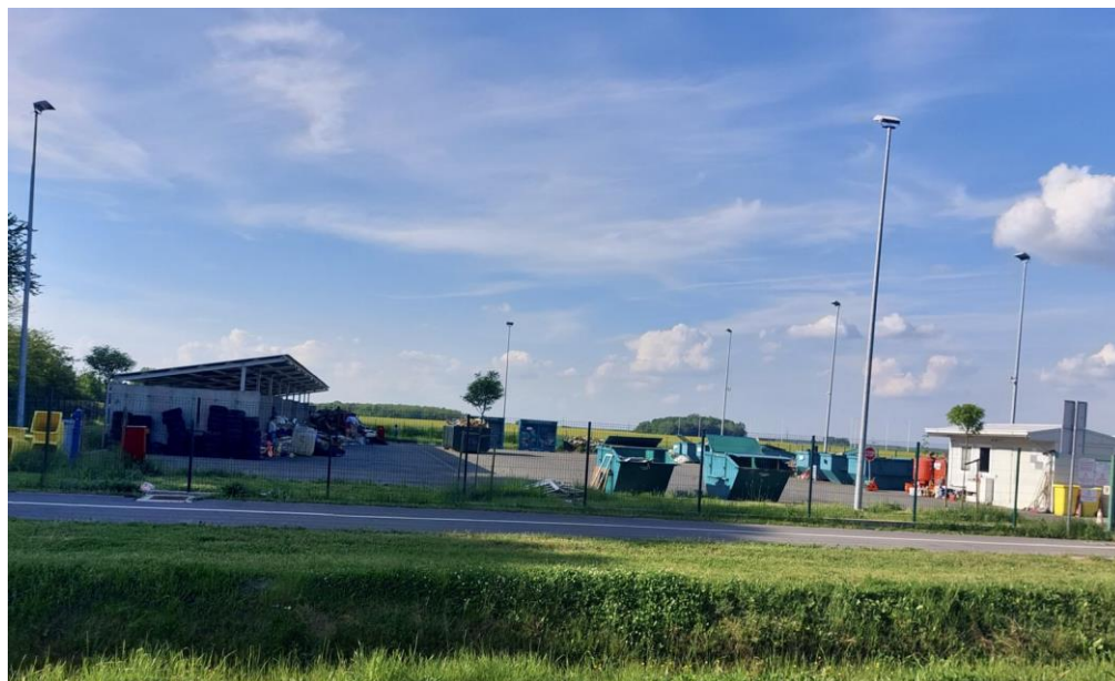
Slika 2. Prikaz reciklažnog dvorišta u Općini Čepin

Cilj projekta je stvoriti uvjete za recikliranje razvrstanog otpada iz mješovitog otpada kako bi osigurali održivo gospodarenje otpadom. Specifični cilj projekta je smanjiti mješoviti otpad koji se odlaže na različitim mjestima u Općini Čepin te podići svijest o štetnosti stakleničkih plinova i utjecaju divljih deponija na podzemne pitke vode.