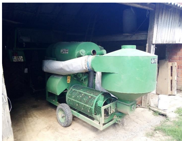
Slika 2. Kombajn za lješnjak