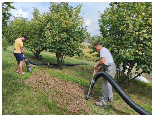
Slika 1. Sakupljanje plodova

Berba lješnjaka počinje od sredine 7. mjeseca do početka listopada, što je ovisno o tome koja sorta je zasađena i području u kojem se uzgaja. Plodove treba brati kada su potpuno sazreli što se može prepoznati po promjeni boje iz zelene do tamno smeđe i kada lako ispadaju iz omotača. Berba može biti otežana kod nekih sorti jer plodovi ne sazrijevaju u istom vremenskom periodu. Kod nekih sorata je omotač duži od samog ploda, pa se teško oslobađaju iz njega. U početnim fazama pri starosti lijeske od 4. godine kada lijeska počinje rađati, ali u sasvim malom postotku, tada se berba može obavljati ručno (Šoškić, 2006.). U sedmoj godini kada lijeska ulazi u puni rod i gdje se uzgajaju nasadi na većim površinama, berba se odvija mehanizirano pomoću kombajna različitih izvedbi. Potrebno je prvo otresti sve plodove sa stabla koji još nisu otpali pomoću strojeva ili ručno. Lješnjak koji je na tlu može se, ali ne mora sakupljati grabljama ili sa pihalnicima formirati u hrpe ili redove za lakše sakupljanje kombajnom (Šoškić, 2006.). Kombajni za prikupljanje lješnjaka mogu biti usisavači sa cijevima kao na (Slika 1. i 2.) sa kojima radnici usisavaju lješnjak ili samohodni kombajn sa rotirajućim grabljicama.