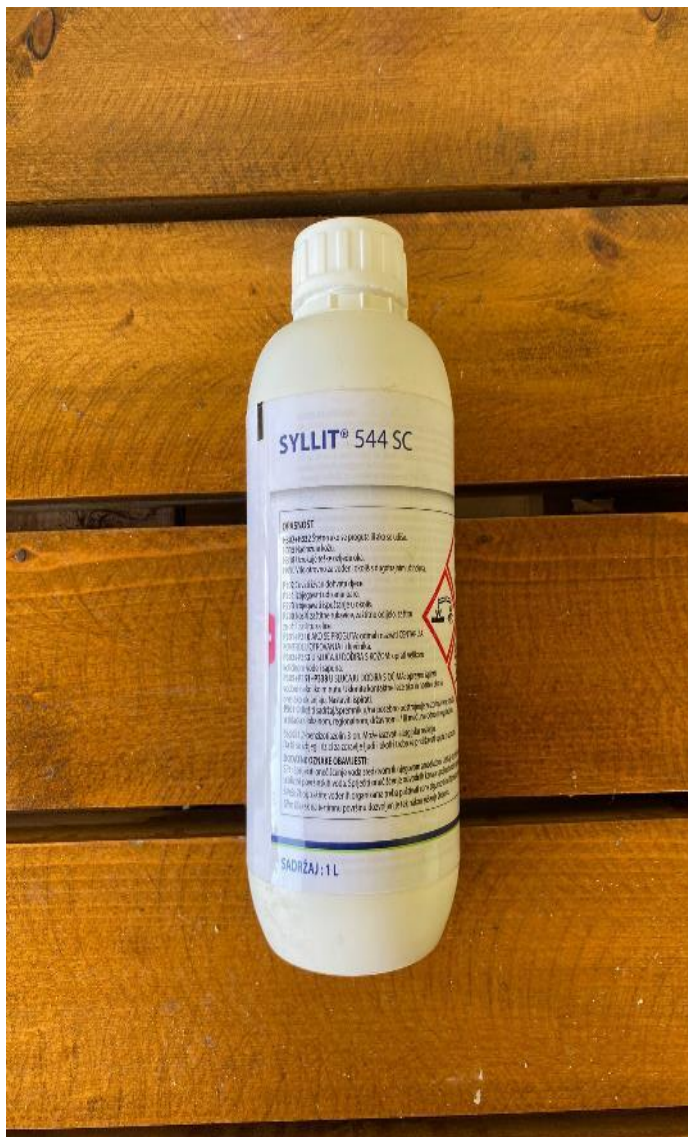
Slika 7. Syllit 544 SC sredstvo protiv biljnih bolesti

Sredstvo koje učinkovito suzbija biljne bolesti u voćarstvu je “Syllit 544 SC” (Slika 13.). Na OPG-u Ciboci je 4. svibnja nasad tertian upravo tim sredstvom. Sredstvo se primjenjuje u razdoblju kada su povoljni uvjeti za razvoj bolesti. Syllit sprječava ili značajno umanjuje mogućnost pojave kozičavosti te uvijanja i sušenja lista. Način pripreme je 1 l sredstva na 300 l vode. Također, potrebno je bilo ponoviti postupak 19. svibnja kako bi sredstvo imalo značajniji učinak.