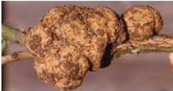
Slika 19. Agrobacterium tumefaciens (E. F. Smith & Towns) Conn

postaju tamniji i odrvenjavaju. Zaraza se prenosi putem ozljeda na biljci, a A. tumefaciens najaktivnije djeluje tijekom ljeta. Suzbijanje ove bolesti provodi se kroz dezinfekciju tla, orezivanje zaraženih dijelova biljke te uporabu čistog alata i opreme. Također, preporučuje se sadnja deklarirano zdravih sadnica kako bi se smanjio rizik infekcije (Jurković i sur., 2010.).