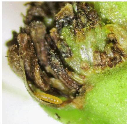
Slika 12. Mušice kalemarice ( Resseliella / Clinodiplosis / oculiperda Rgbs.)

sušenje. Početne faze ličinki su bijele, ali kasnije dobivaju narančasto-crvenu boju. Razvojni ciklus traje između 4 i 6 tjedana. Ponekad se ličinke mogu dublje zakopati u drvo, što rezultira sušenjem grana. Tijekom zime, prezimljavaju u obliku kukuljica u tlu. Mjere zaštite od mušice kalemarice uključuju sprječavanje pojave oštećenja na kori biljaka. Nakon okuliranja ili obrezivanja, preporučuje se omatanje i premazivanje voćarskim voskom. Dodatno, nakon okulacije, moguće je primijeniti kontaktni insekticid na okuliranim područjima kako bi se suzbio štetnik (Maceljski, 2002.).