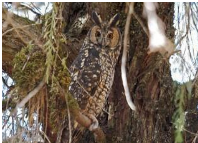
Slika 2. Abesinska dugouha sova ( Asio abyssinicus ).

indijske sove, afričke pjegave sove ili magellanove sove. Pasmine srednje veličine su dobre za početnike jer nisu ni premale a nisu ni prevelike te ih je jednostavnije kontrolirati i manje je mogućnost od nenamjernog ozlijeđivanja ptice. (Parry-Jones, 2012.) Ako vas pak htjeli lovit sa sovama trebati imati na umu prostor na kojem planirate loviti, na kakvom terenu i kakav plijen. Preporuča se jedna od većih pasmina sova poput Iranske ušare ili Velike ušare. Pošto sove gutaju cijeli plijen ne preporuča se lov na sitan plijen sa malim pasminama sova jer nakon jednog ulova će biti site i neće htjeti ponovo loviti. (Parry-Jones, 2012.)