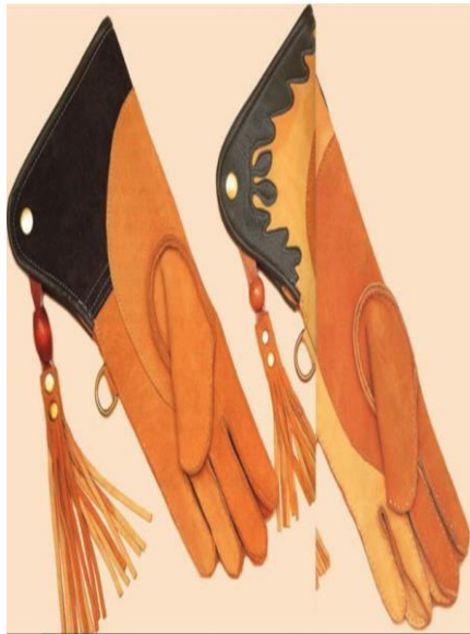
Slika 8. Dvoslojne rukavice.

Veoma je važno imati i odgovarajuću rukavicu za odgovarajuću vrstu ptice. Jednoslojne rukavice su dobre za male pasmine sokola, dvoslojne rukavice se koriste za mišare, i velike pasmine sokola. Rukavice za orlove se moraju posebno izrađivati. Kvalitetne rukavice znaju biti skupe, ali uz dobru brigu o njima mogu izdržati godinama. (Parry-Jones, 2002.)