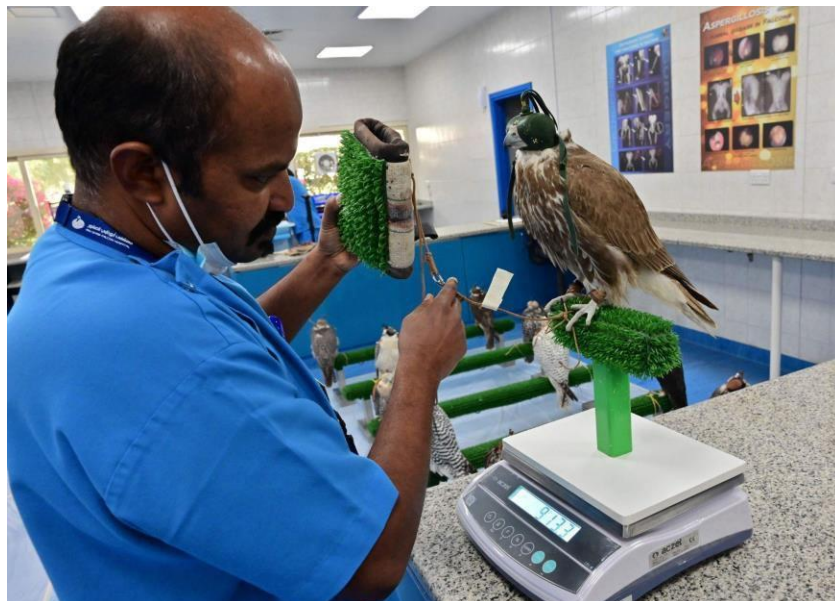
Slika 6. Vaganje sokola u sokolskoj bolnici u emiratima.

Važno je uspostaviti rutinu vaganja svaki dan tijekom obuke. Kod novih ptica koje su ne obučene, malo divlje i nisu naviknute na prisutnost ljudi potrebno je imati strpljenja pri vaganju. Ako se mučite s pticom prilikom vaganja potrebno je zamračiti prostoriju što će je smiriti, a vrijednosti pogledate malom lampicom. Tokom faze obuke ptica se važe svaki dan i njezini obroci također. U tablicu je potrebno svakodnevno upisati masu ptice te masu i tip obroka. Kroz takav postupak vaganja i evidencije može se naučiti puno o pojedinoj ptici, a također treba provjeravati i kondiciju ptice pri vaganju što će pomoći o spoznaji ptice. (Parry-Jones, 2002.)