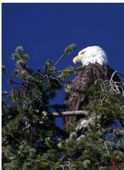
Slika 4. Bjeloglavi orao ( Haliaeetus leucocephalus ).

Orlovi nisu pasmina ptica grabljivica za početnike, nisu ni dobri kućni ljubimci. Orlovi su samo prikladni za lov i to samo na određenim mjestima, po određenim uvjetima. Orlovi su velike ptice ali to ne znači da mogu kupiti veliku lovinu. Važno je imati na umu da lovinu koju lovite mora biti veličine koju ptica može podići i usmrtniti na brzinu. Ako neiskusni orao uhvati lisicu i ne usmrti je brzo, lisica će ga ozlijediti, recimo europski zec može biti pretežak za mužjaka surog orla pa čak i za ženke koje su znatno veće i snažnije od mužjaka. (Parry-Jones, 2012.)