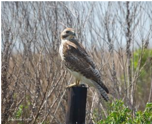
Slika 5. Crvenorepi jastreb ( Acipiter gentilis ).

upotpunjuje koštani štit iznad očiju, sokolovi imaju najoštiji vid od svih životinja. Mužjaci i ženke sokolova imaju tendenciju izgledati isto, iznimke su Harisovi jastrebi. (Venable,1996.) Jastreb lovi iz zasjede, sjedi nepomično na grani čekajući, brzo se provlači kroz krošnje i hvata plijen na prepad.