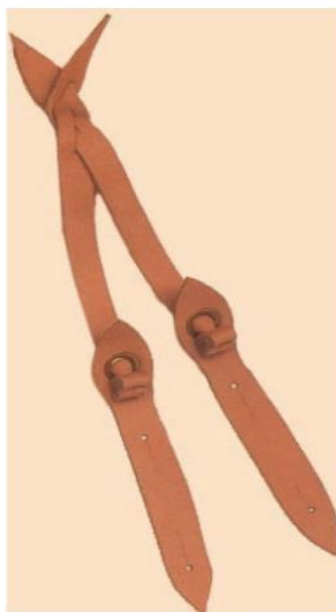
Slika 9. Almary jesse.