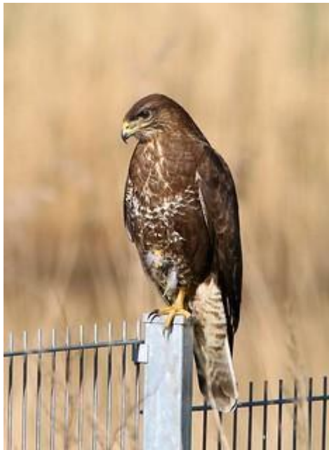
Slika 1. Obični škanjac ( Buteo buteo ).