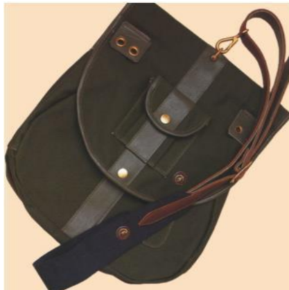
Slika 13. Torbica za sokolarenje.

Torbica mora imati barem dva džepa, jedan za mamce i jedan za meso kojim pozivate pticu sebi na šaku. Torbica bi trebala biti načinjena od materijala koji se lagano može dezinficirati. Umjesto torbice mogu se koristiti jakne ukoliko imaju barem dva džepa i lagano se dezinficiraju, iako su jakne manje praktične nego torbice. (Parry-Jones, 2002.)