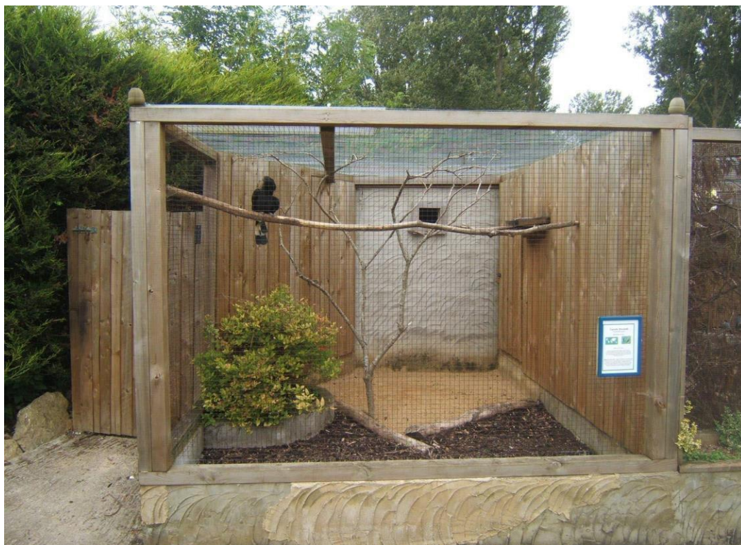
Slika 7. Volijer.

Kao nastambu za obučene ptice grabljivice najbolje je koristiti volarije u kojima ptica ima mjesta za kretanje. Neke vrste ptica zahtijevaju specijalizirane volarije poput sova ili običnog kobca. Ptica u volijerima može bit odvezana većinu vremena, nije dobro držati ih svezane dugo vremena. Nezavezane ptica neće se upetljati bez nadzora na duže vrijeme, održavaju bolju formu stalnim kretanjem, u slučaju predatora poput lisica pasa i mačaka imaju veće izgleda za preživljavanje i obranu. Hladna razdoblje čine manje problema kod nevezanih ptica, a ptice su tako i sretnije. U ranijim fazama obuke ptica trebati biti zavezana dok god nije dovoljno pripitomljena da dođe na ruku kada se pojavite u volijeru. (Parry-Jones, 2002.)