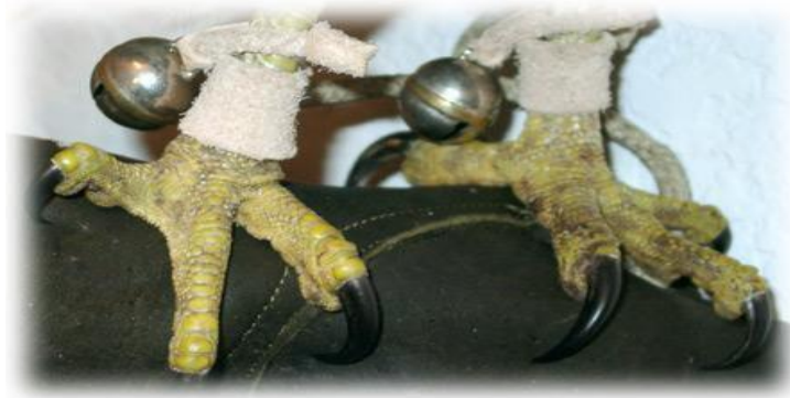
Slika 10. Zvonca zavezana za noge.