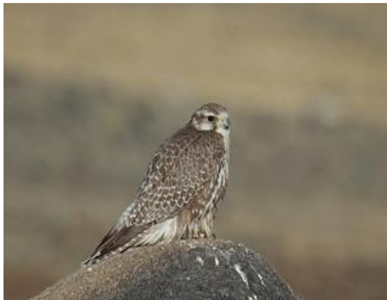
Slika 3. Stepski sokol ( Falco cherrug ).

Krški sokoli su velika pasmina sokola s najboljim temperamentom što ih čini dobrima za početnike. Lovit će ako ustrajete u obuci te su odlične ptice za mamac. Kod ove pasmine u mužjaka se mora dosta paziti na težinu, pa se preporučuje uzeti ženku ako ste trener bez dovoljno iskustva. (Parry-Jones, 2012.)