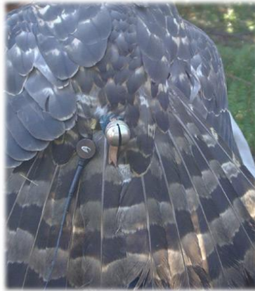
Slika 11. Zvonca vezana za rep.