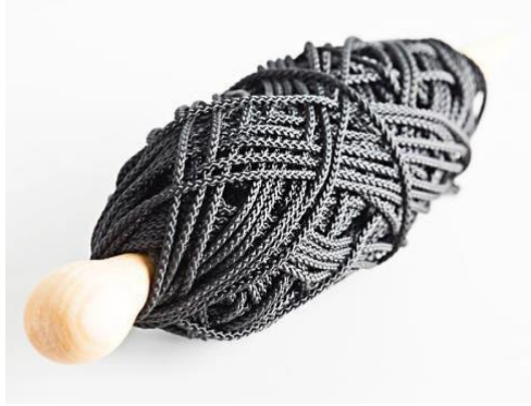
Slika 12. Kreans.