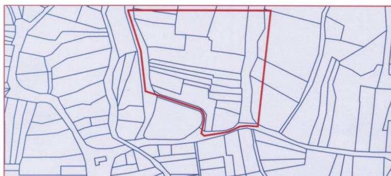
Slika 2 Primjer izgleda poljoprivrednog zemljišta nakon komasacije