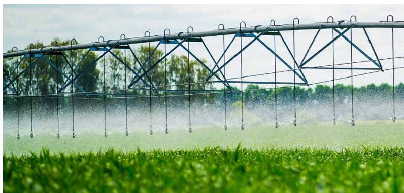
Slika 1. Sustav za navodnjavanje s gornjom granom

Sustav navodnjavanja mora osigurati ravnomjernu raspodjelu vode – što je ključno za ravnomjeren rast presadnica. Mali proizvođači mogu razmotriti navodnjavanje presadnica ručnim navodnjavanjem crijevom. Međutim, veliki proizvođači moraju instalirati nadzemne vodove za prskanje (Slika 1.). Najučinkovitiji sustavi za navodnjavanje koriste pokretne nadzemne portale, pri čemu se poluga za prskanje mehanički povlači preko kreveta ili stolova sa uzgojnim posudama. S bilo kojim sustavom navodnjavanja, rubna sjetvena mjesta rubnih uzgojnih posudama bloka će se sušiti brže od onih koje se nalaze u sredini. Iz tog razloga može biti potrebno i ručno zalijevanje.