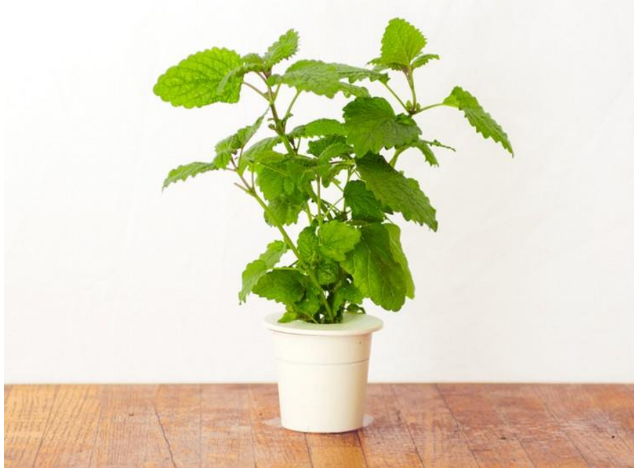
Slika 22. Presadnica matičnjaka

do 90 dana. U tom periodu, biljka bi trebala imati razvijena 2 do 4 sekundarna izdanka i 4 do 6 pari listova (Slika 22.). Za površinu od 1 m 2 moguće se proizvesti 200 do 300 presadnica ( https://www.agroportal.hr/ljekovite-biljke/14908 ).