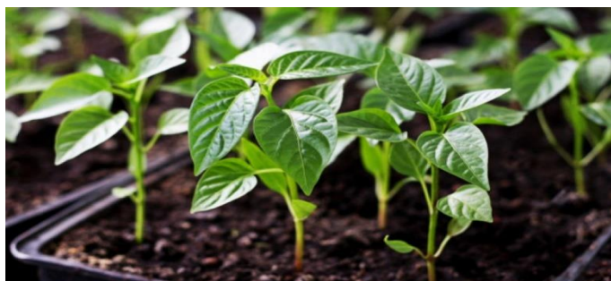
Slika 2. Presadnice u uzgojnoj posudi od plastike

Uzgojne posude se razlikuju po broju, veličini i obliku sjetvenih mjesta. Kriteriji za odabir uzgojne posude uključuju: biljne vrste, uvjete uzgoja, lokalnu dostupnost i vrstu korištenih mehaničkih sijačica.