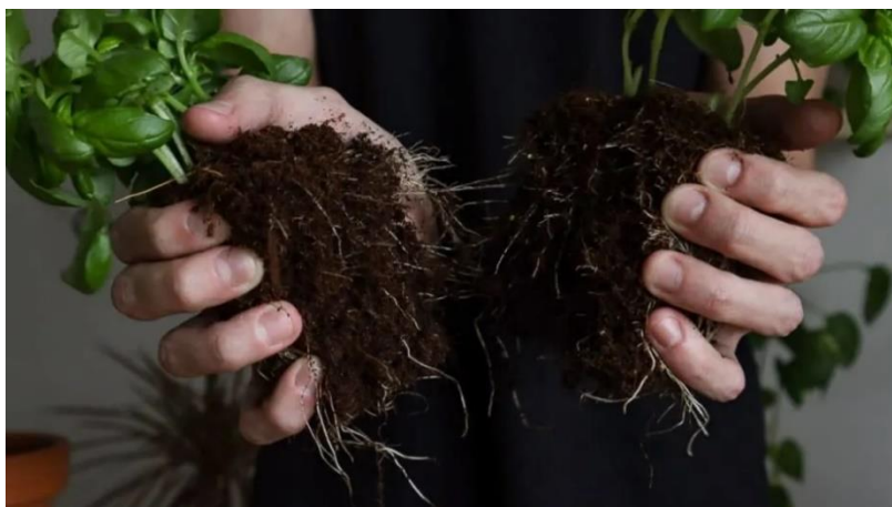
Slika 14. Presadnice bosiljka dobivene dijeljenjem