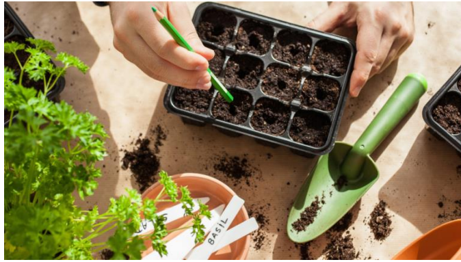
Slika 3. Optimalno pozicioniranje sjemena u posudi za sjetvu