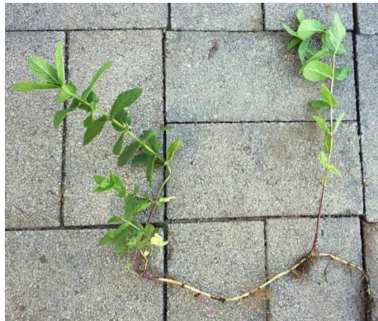
Slika 17. Vriježe mente

te više nisu pogodne za sadnju. Postupak pripreme podrazumijeva rezanje na komade duljine 8 do 20 cm te spremanje u perforirane plastične vreće. Potrebno je osigurati dovoljan protok kako bi mogle prezimiti. Za cijeli proces, počevši od vađenja vriježa do sadnje, ne smije proći više od 18 sati te se obavezno moraju držati u hladu (Šilješ i sur., 1992.).