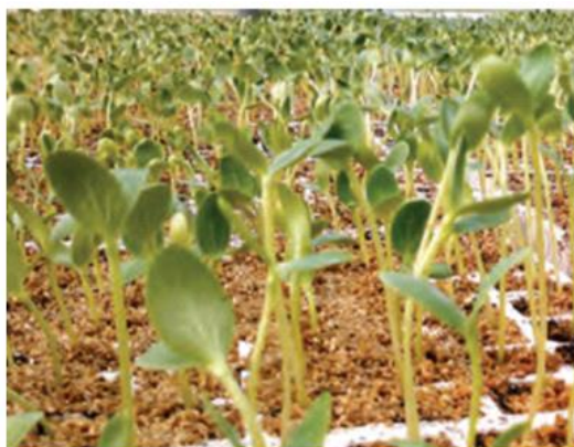
Slika 5. Izduživanje stabljike presadnica zbog kašnjenja vađenja posude iz prostorije za klijanje

Temperaturni režim je vrlo važan za dobro i ravnomjerno klijanje. Stoga je važno pratiti temperaturu tijekom klijanja. Za većinu usjeva temperatura u prostoriji za klijanje mora biti stabilna. Samo nekoliko vrsta zahtijevaju oscilirajuću temperaturu (Kubota i sur., 2013.). Posude treba premjestiti u zaštićeni prostor nakon što sjemenka popuca i mladice počnu izbijati, kako bi se spriječilo prekomjerno izduživanje (Slika 5.). Optimalna temperatura i vrijeme za klijanje variraju ovisno o usjevu.