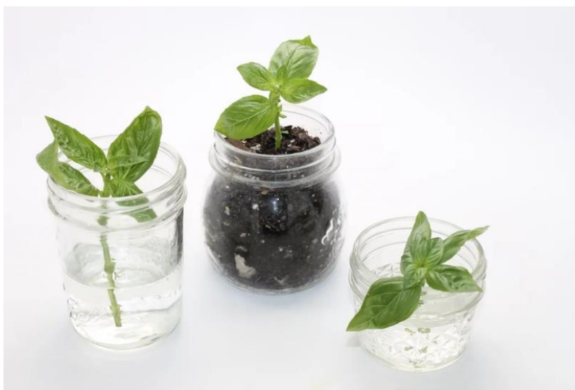
Slika 13. Ožiljavanje reznice bosiljka

Biljke koje imaju više od jedne stabljike koja izlazi iz tla mogu se podijeliti i ponovno posaditi kako bi još brže povećali broj biljaka. Njihovo odvajanje je daleko najbrži način za dobivanje nove biljke. Bolje je to učiniti kada su biljke mlade nego s većim i zrelijim biljkama (Slika 14.).