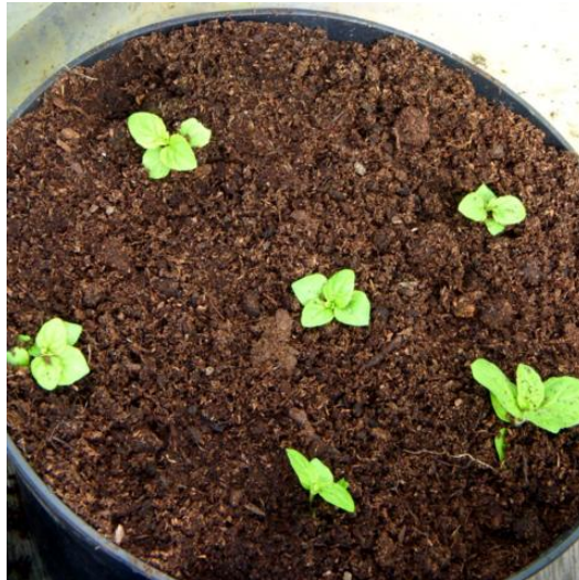
Slika 15. Klijanci mente