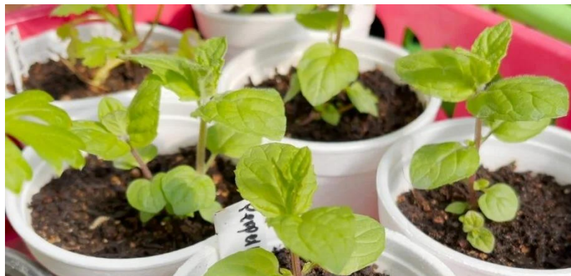
Slika 16. Presadnica mente