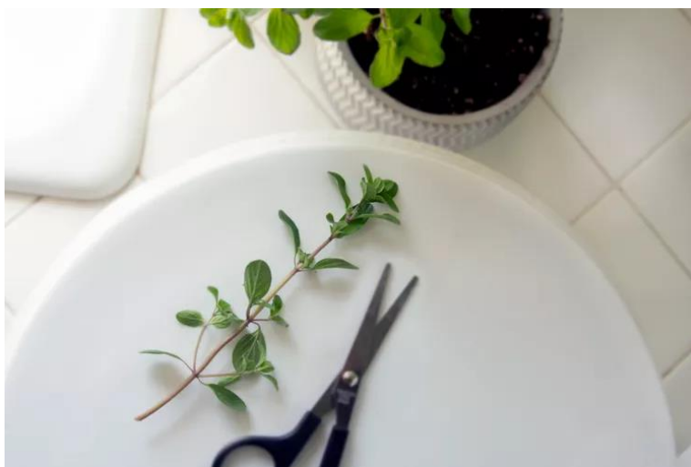
Slika 19. Reznica mažurana