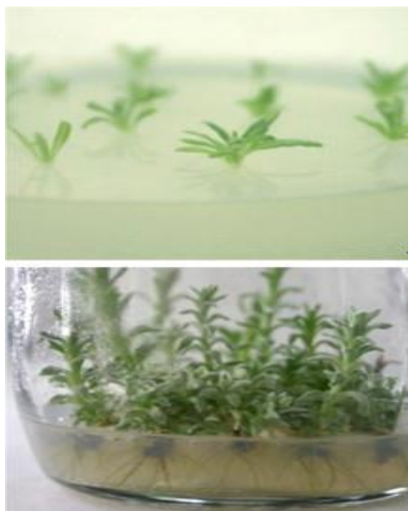
Slika 21. Smilje in vitro