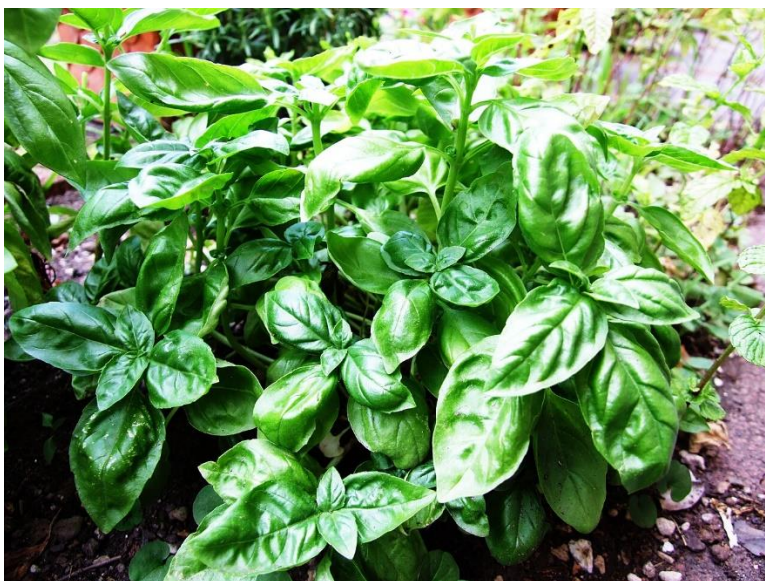
Slika 11. Bosiljak

Bosiljak ima antibakterijska djelovanja, umirujuće djeluje protiv teškoća probave, grčeva i bolova (Slika 11.). Upotrebljava se za liječenje bolesti mokraćovoda, upala crijeva, povraćanja, nadimanja, zatvora i migrene ( https://tinyurl.com/4kp53x87 ).