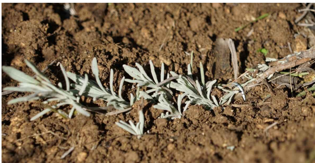
Slika 9. Položnica lavande