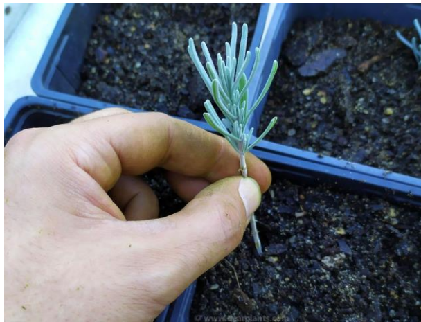
Slika 8. Proizvodnja presadnice lavande reznicama

dana kada se presađuju u lončice veličine 9 cm. Nakon 6 do 8 tjedana spremni su za presađivanje (Davis, 2022.).