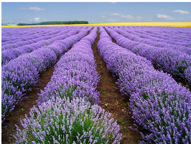
Slika 6. Lavanda

Lavanda ima ljekovita svojstva koja su otkrili i stari Rimljani. Posebno blagotvoran utjecaj lavanda ima na živčani sustav te su je koristili u obliku eteričnog ulja za kupke ( https://tinyurl.com/4jyupwny ).