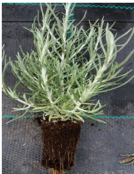
Slika 20. Presadnica smilja