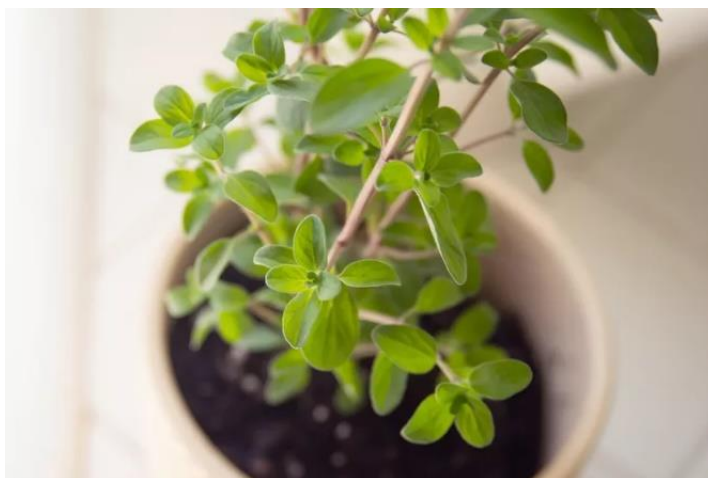
Slika 18. Presadnica mažurana

Prevladava razmnožavanje mažurana koje počinje krajem veljače proizvodnjom rasadnica u toplim lijevama. Razmak između redova mora iznositi 6 do 7 cm te je za sjetvu 1 m 2 potrebno 0,5 grama sjemena. Trajanje klijanja sjemena traje od 10 do 12 dana. Rasadnice u lijevama ostaju do početka mjeseca svibnja, u periodu u kojem biljke dosegnu visinu od 10 do 15 cm te su sposobne za rasađivanje (Slika 18.). Ako je nasad pravilno uzgojen, na 1 m 2 trebalo bi se nalaziti od 1.500 do 1.800 biljaka (Šilješ i sur., 1992.).