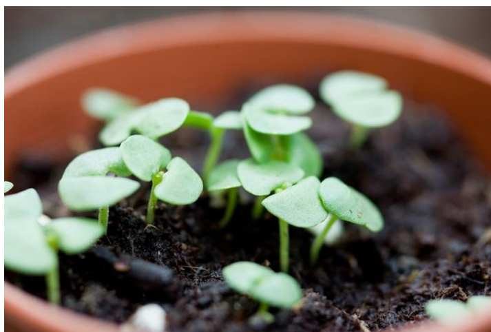
Slika 12. Klijanci bosiljka