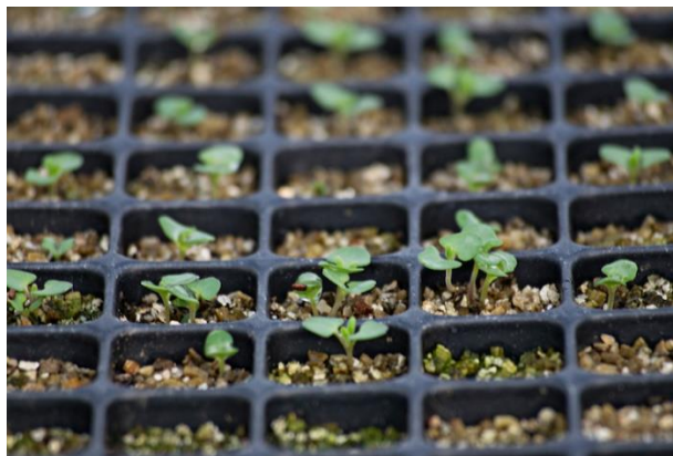
Slika 7. Uzgoj presadnica lavande iz sjemena

do srpnja postavljanjem na vlažan treset te prekrivanjem tankim slojem vermikulita (Slika 7.). Kontejneri s sadnicama postavljaju se u komore na 21 do 25°C uz redovito zalijevanje do faze klijanja, što može potrajati do 21 dan. Kada sadnice dosegnu dovoljnu veličinu za rukovanje, potrebno ih je presaditi u lončiće veličine 7,5 cm te ih održavati na nižim temperaturama. Kada prođe rizik od mraza, postupno se aklimatiziraju mlade biljke lavande na vanjske uvjete tijekom 7 do 10 dana prije sadnje na otvorenom.