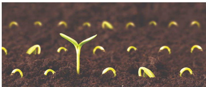
Slika 4. Klijanje sjemena

klijanje mora održavati stanje gotovo zasićene vlage zraka pomoću uređaja za isparavanje (Balliu i sur., 2017.).