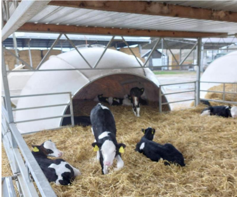
Slika 8. Grupni iglu na farmi Niza d.o.o