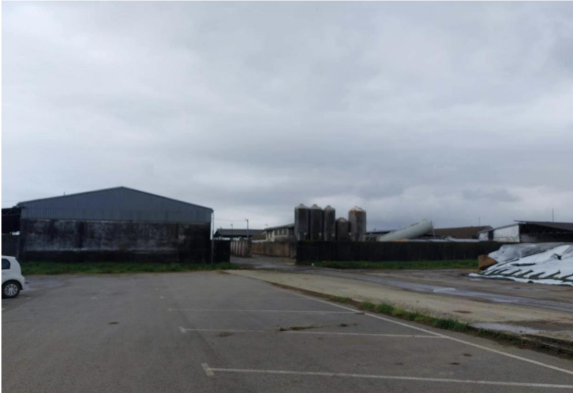
Slika 4. Stari dio farme Niza d.o.o

Stari dio farme prilikom adaptacije 2020. godine adaptiran je i transformiran u sektor za uzgoj teladi, kao i za krava koje se ne muzu. Služi za goveda koja se nalaze u fazi suhostaja. Također, služi za svježe krave te krave koje su iz različitih razloga na terapiji. Odnosi se na terapije kao što su enteritis, pneumonija i mastitis.