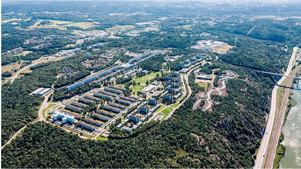
Slika 1: Urbano ruralno područje u Göteborgu u Švedskoj