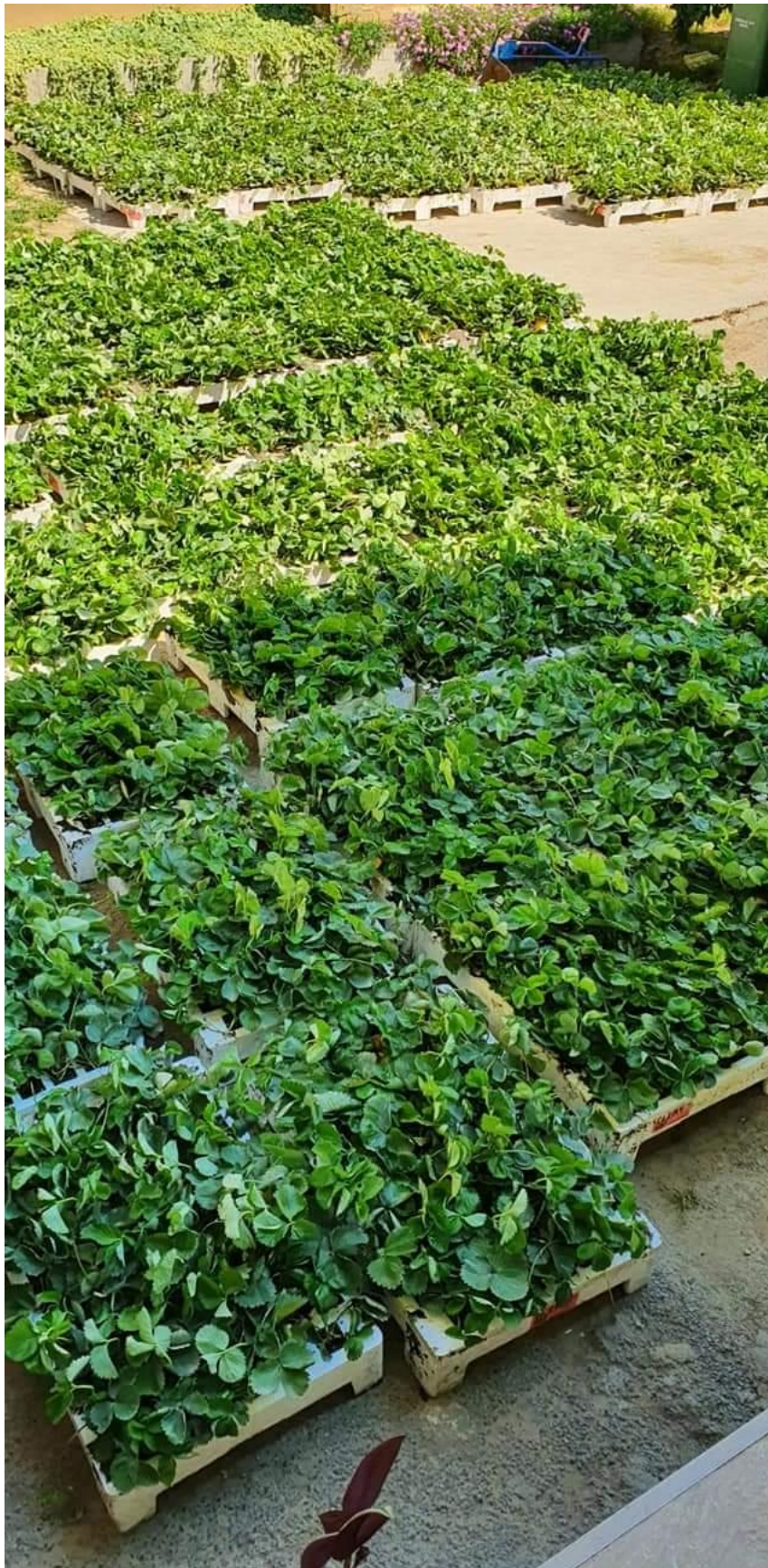
Slika 5. Zelene kontejnerske sadnice jagode