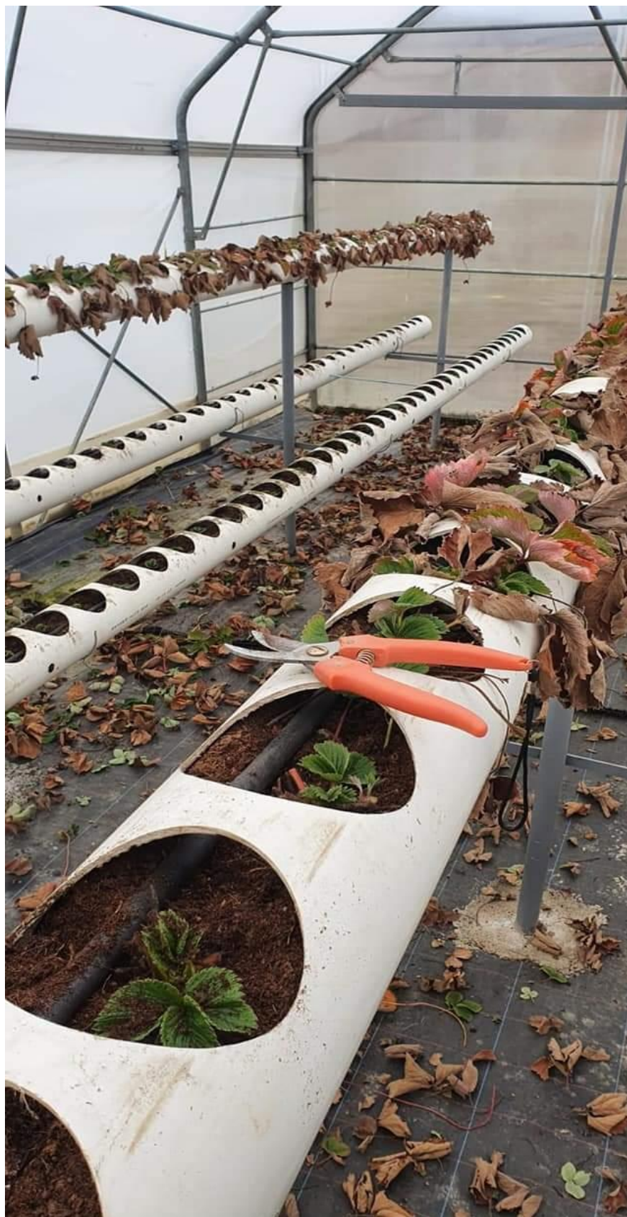
Slika 7. Šišanje sadnica