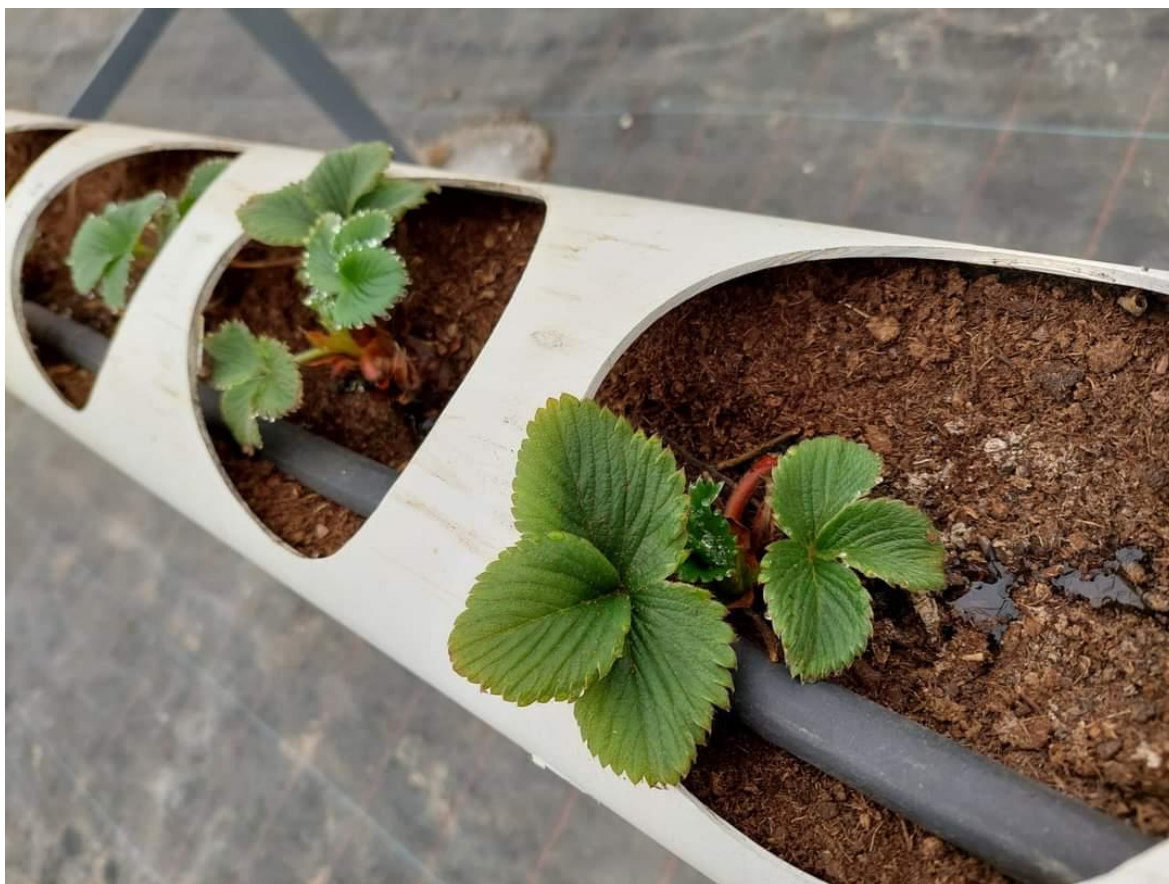
Slika 6. Prihrana sadnica

Radnje kojima pristupamo nakon sadnje su postavljanje sustava za navodnjavanje, putem kojega ćemo provoditi i prihranu biljke ( Slika 6. ). Na početku biljku prihranjujemo 2 puta, prvi put sredstvom na bazi fosfora, drugi put na bazi dušika, u razmaku od 21 dan. U razdoblju vegetacije i porasta, prihranu je potrebno dodavati svaka 4 dana. Obično početkom veljače obavljamo šišanje osušenih i suvišnih listova. Odstranjujemo sav list osim centralnog lista ( Slika 7. ). Preporuka glede navodnjavanja u vegetaciji je jednom dnevno 1 decilitar po sadnici , u vrijeme cvatnje 1,5 decilitar po sadnici, a u plodonošenju 2,5 decilitra po sadnici na dan. Zaštita nasada se vrši folijarno, putem lista. Protiv obične i crvene pjegavosti lista, sadnice tretiramo pred cvatnju i u periodu nakon berbe. U razvojnoj fazi početka i završetka cvatnje te prilikom formiranja plodova suzbijamo sivu plijesan. Nakon berbe, poslije šišanja sadnica radimo zaštitu protiv pepelnice. Najvažnije je naglasiti da se tretmani zaštite moraju obaviti na vrijeme, pridržavajući se propisane karence kao i korištenja pripravaka za zaštitu naizmjenično s ciljem sprječavanja pojave rezistentnosti.