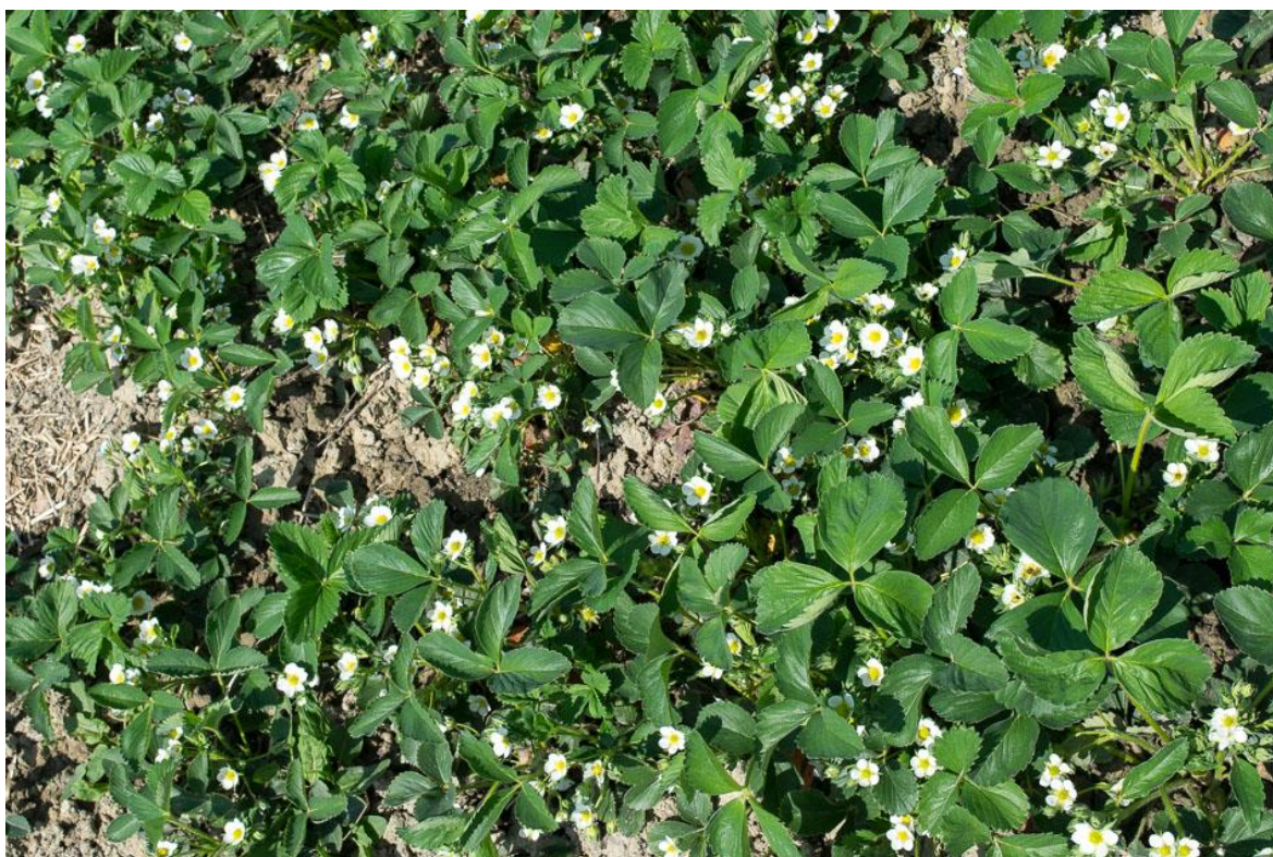
Slika 1. Vrtna jagoda ( Fragaria ananassa Duch. )

Jagoda ( Fragaria ) prisutna je diljem svijeta već stoljećima. Najraniji zapisi pojavljuju se u doba Rimskog carstva, kada su konzumirani plodovi šumske jagode ( Fragaria vesca ). U 18. stoljeću stvoren je hibrid Fragaria x ananassa nakon čega započinje širenje uzgoja voćne vrste i intenziviranje njezine proizvodnje. Vrtna jagoda ( Fragaria ananassa Duch.) predstavlja najznačajniju vrstu među jagodičastim voćem u svijetu ( Slika 1. ). Pripada porodici Rosaceae ( ruže ), a nastala je kao hibrid dvije vrste, Fragaria chiloensis i Fragaria virginiana ( Hancock, 1999. ).