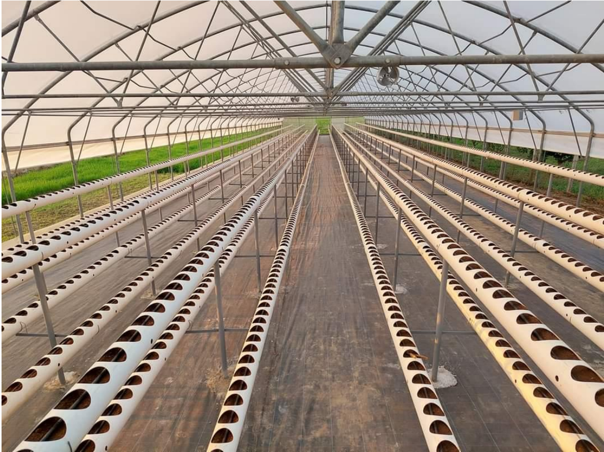
Slika 3. Završeno postavljanje plastenika i unutarnje konstrukcije