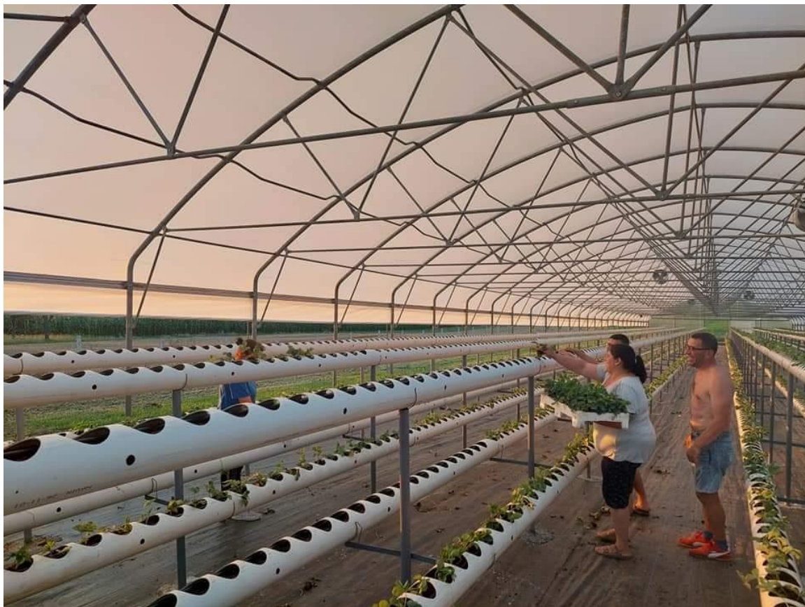
Slika 4. Sadnja u tijeku

prinosi po sadnici su visoki. Mogu doseći urod od čak 1 kilogram po sadnici ( www.gospodarski.hr ).