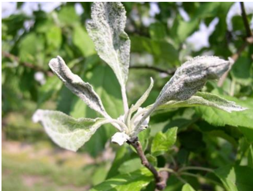
Slika 5. Simptomi pepelnice jabuke na listu

Latice poprime zelenkastu boju, manje su, a latice su pokrivene pepeljastom prevlakom, dok tučak posmeđi (simptomi na listu vide se na slici 5.). U jednom cvatu najčešće su zaraženi svi cvjetovi i nakon zaraze postaju sterilni. Plodovi također mogu biti napadnuti, a na njima se vide ožiljci svijetlo smeđe boje koji prekrivaju površinu ploda u obliku mrežice, premda su zabilježeni i slučajevi pojave pepeljaste prevlake (Agrios, 2004.).