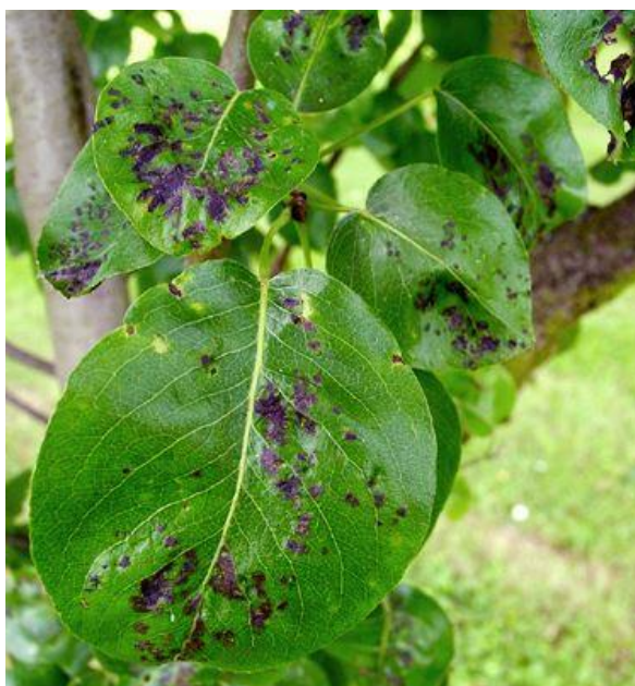
Slika 7. Simptomi krastavosti kruške na listu

Simptomi oboljenja u vidu tamnozelenih kružnih pjega mogu se uočiti na zareženim listovima već rano u proljeće i to najčešće na licu lista (vidljivo na slici 7.). Posljedice bolesti su znatno veće ako se zaraza pojavi ranije i u većem obujmu na mlađem lišću jer dolazi do zastoja u porastu tkiva, u okviru pjega uslijed čega nastaju deformacije lista. Sve to na kraju za posljedicu ima onemogućavanje normalnog proticanja fotosinteze i ostalih fizioloških procesa (Mratinić, 2016.).