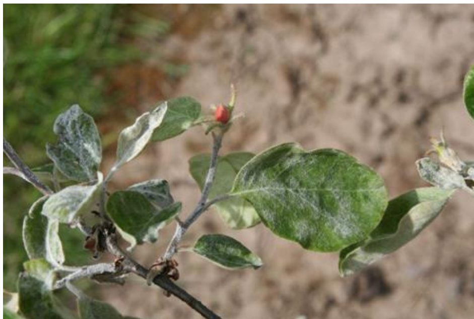
Slika 11. Simptomi pepelnice dunje na listu

Napada mladice i listove stvarajući na njima sivkastu prevlaku, koja se lako skine (slika 11.).