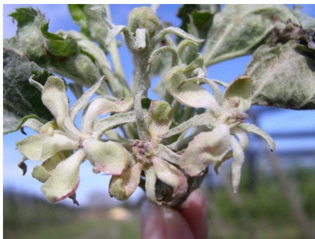
Slika 4. Simptomi pepelnice jabuke na cvjetnoj stapci, čaški i lapovima

Na naličju lista sekundarno zaraženih listova razvija se bjelkasti micelij, a na istom mjestu na licu nastaju svijetlo zelenkaste klorotične zone. Sekundarne zaraze mogu se ostvariti već drugog dana nakon što list izađe iz pupa pa se takvi listovi deformiraju, postaju valoviti jer zaraženi dio raste sporije od zdravog dijela plojke. Važno je spomenuti da je list najosjetljiviji od 2 do 6 dana nakon izlaženja iz pupa. Na listovima starima 8 ili više dana zaraze su neznatne. Od izlaženja iz pupa do postizanja pune veličine lista potrebno je dvadesetak dana, a osjetljiv je na infekciju samo u razdoblju najintenzivnijeg porasta. Primijećeno je ako list brže prolazi kroz svoju "osjetljivu fazu", širenje parazit će biti manje. Međutim, ako list raste sporo, napad parazita može biti jači. Parazit napada i cvjetove (simptomi na cijetnoj stapci, čaški i lapovima vidljivi su na slici 4.). Cvjetovi (cvjetna stapka, čaška, latice), koji se razvijaju iz zaraženih pupova pokriveni su pepeljastom prevlakom micelija, zaostaju u razvoju i najčešće se suše (Cvjetković, 2010.).