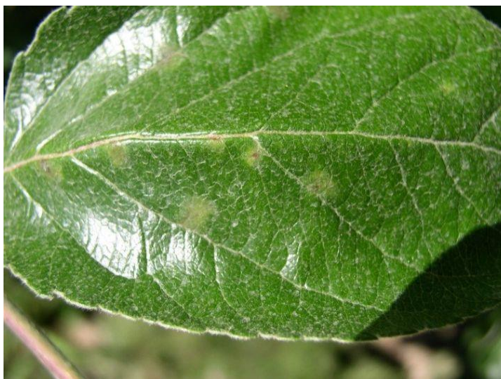
Slika 1. Simptomi bolesti vidljivi na listu jabuke