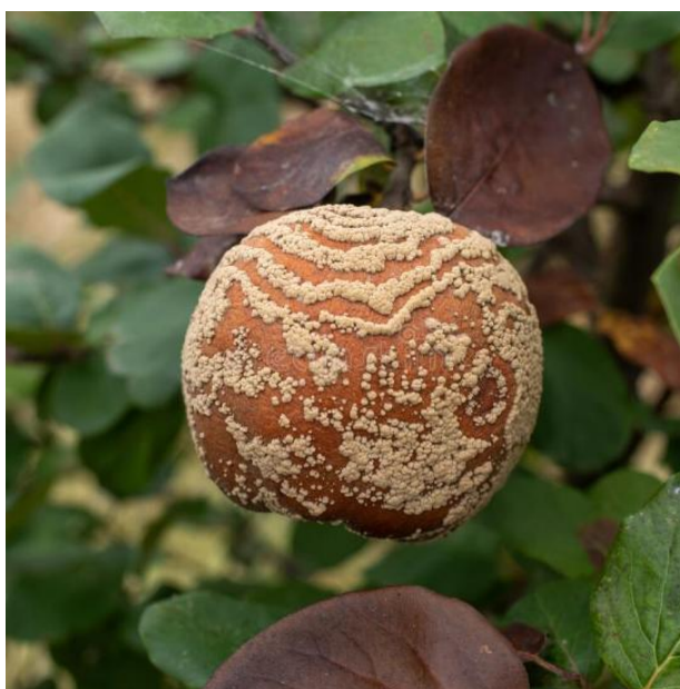
Slika 10. Simptomi monilije na plodu dunje

Parazit se u proljeće razvija na mladom lišću, odakle ga insekti (najviše pčele) prenose na tučkove cvijeta i tako se zarazi mladi plod, koji se ubrzo sasuši i mumificira. Ovako sasušeni plodovi ostaju na granama jako dugo, najčešće sa po 1-2 suha lista (vidljivo na slici 10.). S ovih mumificiranih plodova u toku ljeta zaraza se prenosi na razvijene plodove, koji počinju trunuti (Mratinić, 2016.).