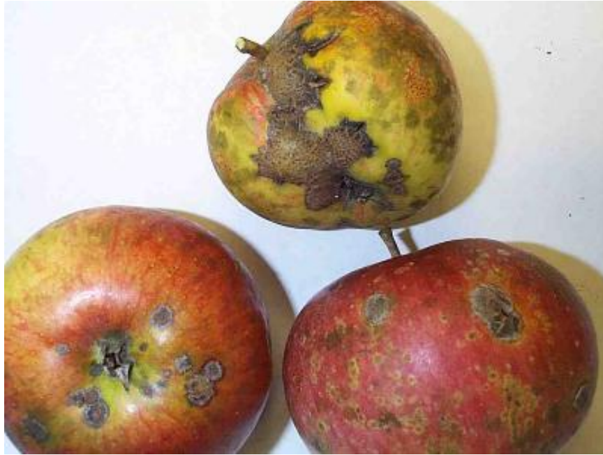
Slika 2. Simptomi bolesti vidljivi na plodu jabuke