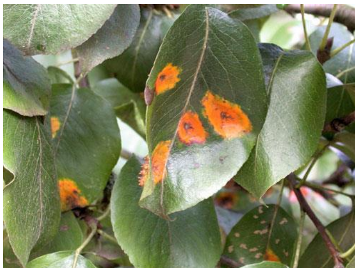
Slika 9. Simptomi hrđe kruške na listu