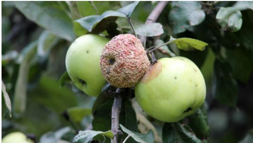
Slika 6. Simptomi monilije vidljivi na plodu jabuke

ispod koje tkivo posmeđi. Nastala pjega ispočetka je glatka, a zatim se na njoj pojavljuju gotovo u pravilnim koncentričnim krugovima male prljavo bijele bradavičaste nakupine, koje kasnije poprime sivkasto-žutu boju (simptomi na plodu vide se na slici 6.). Gušći micelij nastaje tijekom dana, a rjeđi tijekom noći, zbog čega nakupine nastaju u koncentričnim krugovima. Početna pjega postaje s vremenom sve veća, a na njoj nastaje sve veći broj koncentričnih krugova.