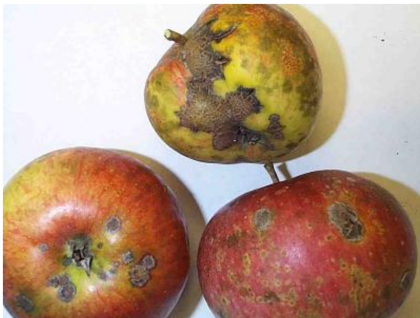
Slika 2. Simptomi bolesti vidljivi na plodu jabuke