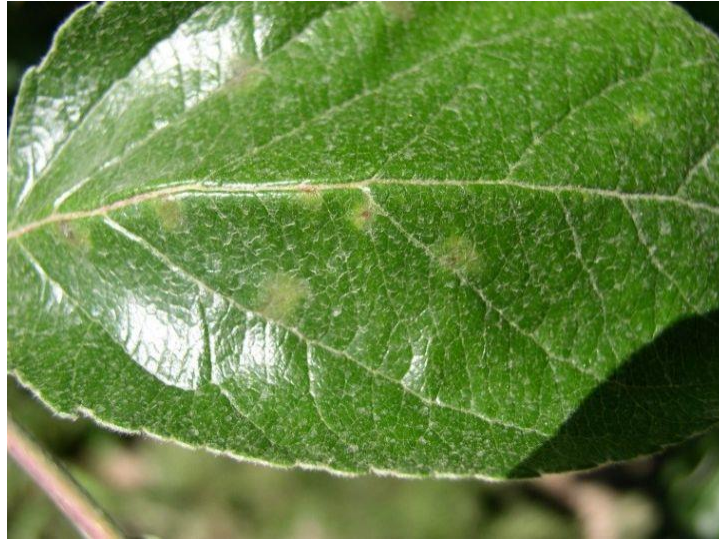
Slika 1. Simptomi bolesti vidljivi na listu jabuke