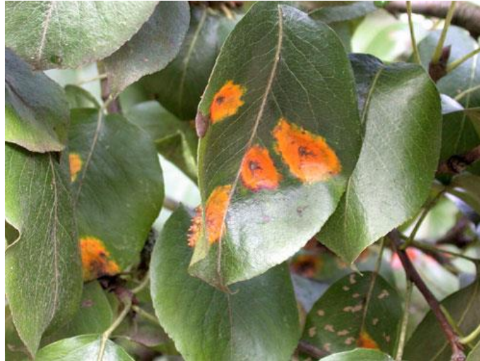
Slika 9. Simptomi hrđe kruške na listu