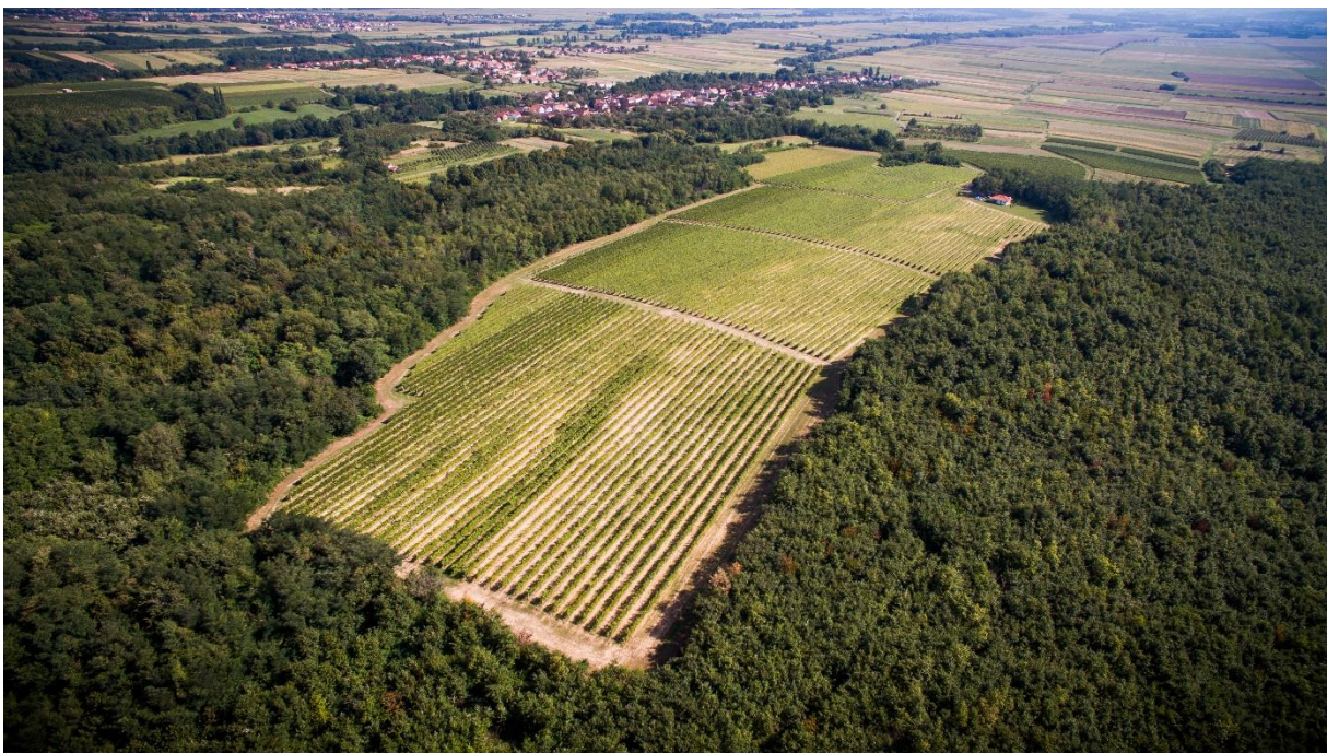
Slika 1. Vinograd vinarije Pavlović

Organoleptička analiza vina provedena je u vinariji Pavlović. Vinarija Pavlović svoje prve vinograde sadi 2003. godine. Vinarija se nalazi na području vinogorja Kutjevo, lokacija Češljakovci. Vinarija trenutno posjeduje 9 hektara vinograda gdje graševina zauzima 65% od ukupnih nasada vinograda. Od ostalih sorata zastupljeni su: pinot sivi, pinot bijeli, sauvignon, merlot, cabernet sauvignon, frankovka. Vinogradi su na južnoj ekspoziciji na 270 metara nadmorske visine što su odlične predispozicije za proizvodnju vrhunskih vina. Vinarija unazad nekoliko godina sa svojim graševinama bilježi zapažene rezultate na raznim ocjenjivanjem.