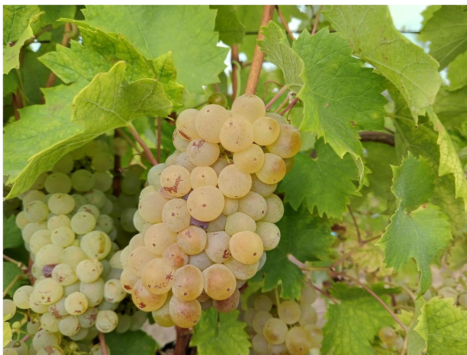
Slika 2. Graševina

U godinama normalne dozrelosti vino je jasne zelenkastožute do žute boje zelenih odsjaja, bistro. Fine je, srednje izražene do izražene, složene voćno-cvjetne arome, u kojoj se razabiru note banane, jabuke, kruške, malo citrusa i grejpa, tragovi biljnih a i cvjetnih mirisa bagrema... Potječu one od acetatnih estera viših alkohola i etil estera pojedinih masnih kiselina nastalih pretežito u tijeku alkoholnog vrenja. Povoljno na pojavu estera utječe sastav mošta dobiven od zdravoga grožđa kao i niže temperature vrenja. Prvi dojam pri kušanju vina je živa svježina koju uravnotežuje umjerena toplina alkohola, najčešće zastupljenog u količini od 11,5 do 12,5 vol%. Obično su to suha, iznimno polusuha, puna vina, dobre strukture, harmonično povezanih aroma s okusom, srednje dugoga do dugoga, čistog, blagogorkastog završetka (Premužić, 2011.)