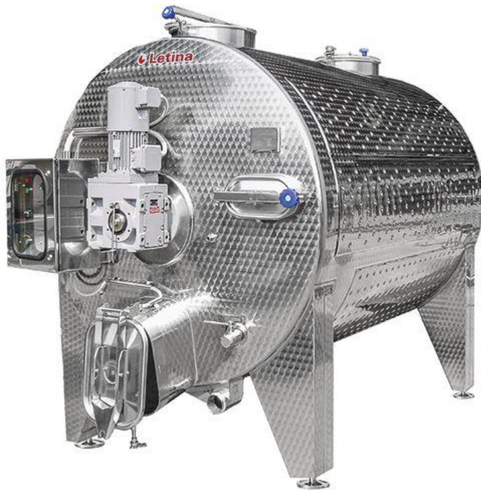
Slika 5. Vinifikator

Kod obje vinarije vršena je maceracija u vinifikatorima. U njima se klobuk potapao okretanjem lopatica koje se nalaze na osovini duž sredine vinifikatora. Klobuk se potpao svakog dana 2 do 3 puta. Mošt se otakao odmah nakon završene fermentacije.