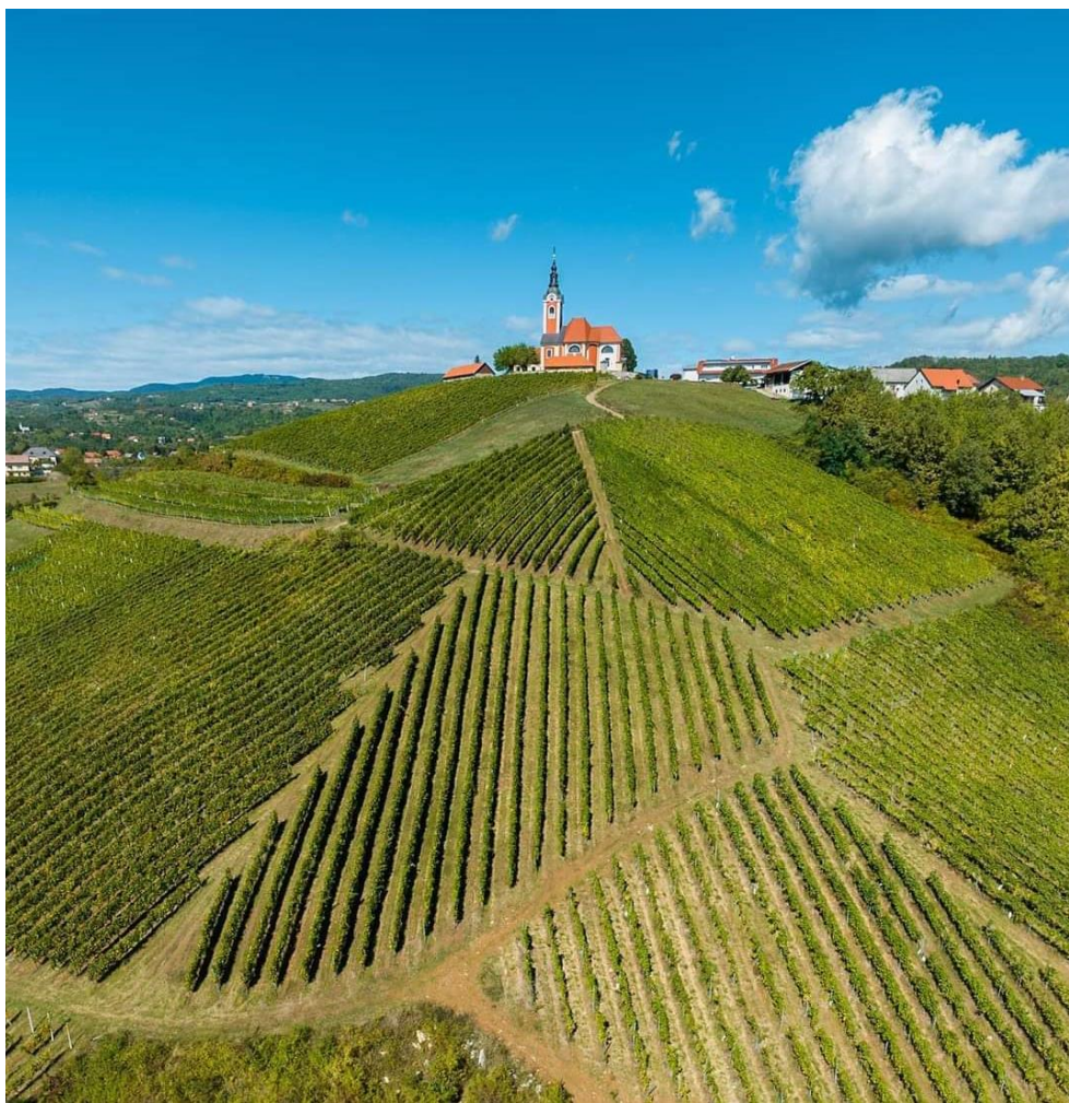
Slika 2. Vinogradi vinarije OPG-a Frlan

Vinarija se nalazi u Vinogorju Ozalj – Vivodina. U mjestu Vivodina. Obiteljsko gospodarstvo ima dugu tradiciju, razvija se od 1905. godine kad je otvorena gostionica. Za potrebe gostionice razvijaju vinogradarstvo i vinarstvo. Trenutno obiteljsko gospodarstvo posjeduje oko 5,5 ha vinograda. Vinogradi su južne ekspozicije na nadmorskoj visini od 250 m do 310 metara. Zasađene su sorte: graševina, pinot sivi, sauvignon, chardonnay, rajnski rizling, muškat žuti, hibernal od bijelih sorata i frankovka i pinot crni od crnih sorata grožđa.