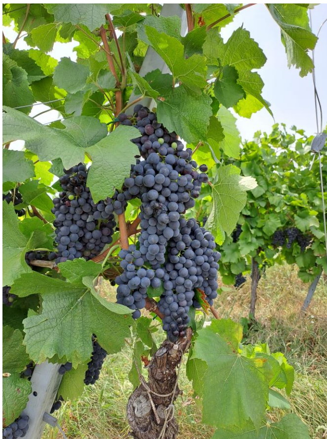
Slik 3. Pinot crni

Pinot crni podrijetlom je iz Burgundije, Francuske, gdje se spominje još u 14. stoljeću i jedan je od najstarijih kltivara. ( Mirošević i Karoglan Kontić, 2008.). Danas se uzgaja u mnogim vinskim regijama širom svijeta. Smatra se sortom koju je dosta teško uzgojiti, jer je visoko osjetljiva na vrstu tla i klimu. Voli dobro ocjedita tla te hladniju klimu s umjerenim temperaturama. Neki od sinonima su: Pinot noir, Pinot nero, Burgunder, Black Burgundy.