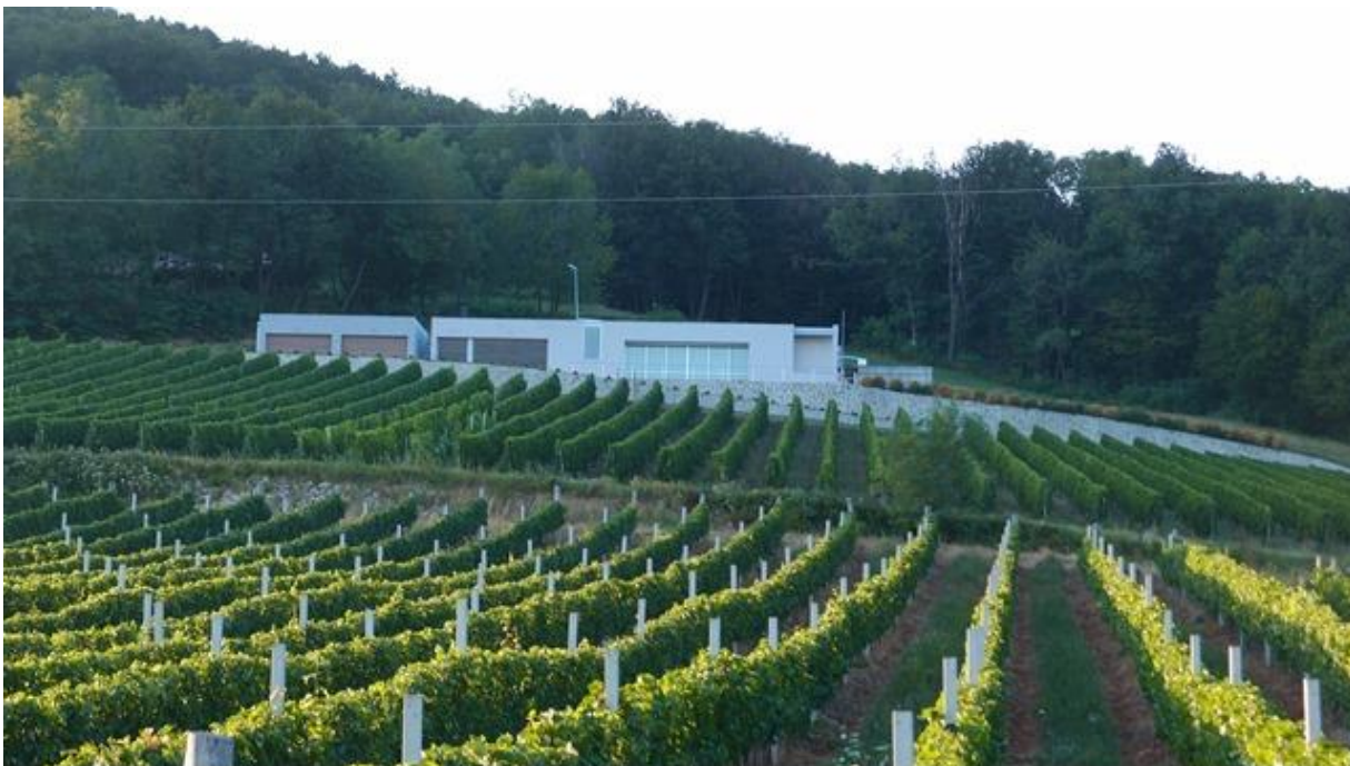
Slika 1. Pogled na vinograd i nastavnu bazu vinarije Vinum Academicum