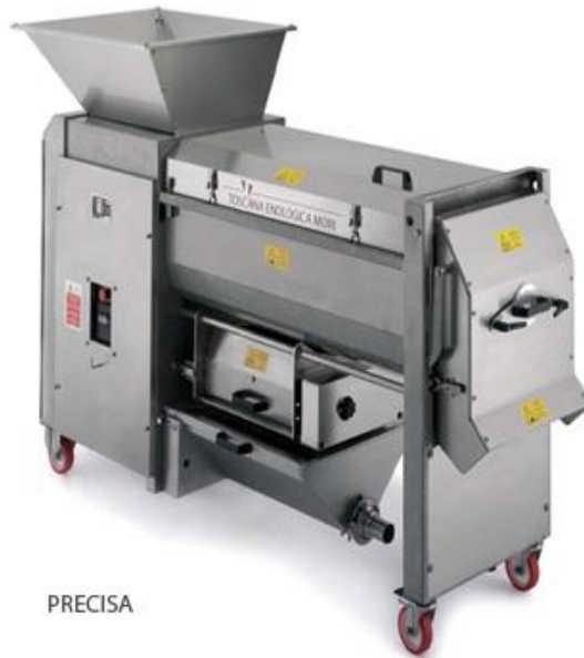
Slika 4. Runjača – muljača