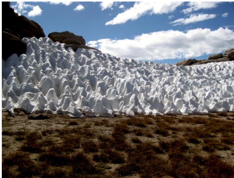
Slika 3. Snježni valovi

zračenja koje dolazi do njega. Mala provodljivost topline snježnih kristala i poroznost snijega, točnije velika količina zraka, koji je sam po sebi odličan izolator, sadržanog između snježnih kristala, snježnom pokrovu daju odlična izolatorska svojstva. Zato on sprječava odvođenje topline iz tla u hladniju atmosferu, odnosno smanjuje na minimum noćno izgaravanje. Kao dobar izolator, snijeg utječe i na dubinu smrzavanja tla; tlo pokriveno snijegom zamrznut će se do znatno manje dubine nego gola, nepokrivena tla. Temperature tla ispod snježnog pokrivača stalnije su i jednoličnije nego bez njega (Šegota, 1956.).