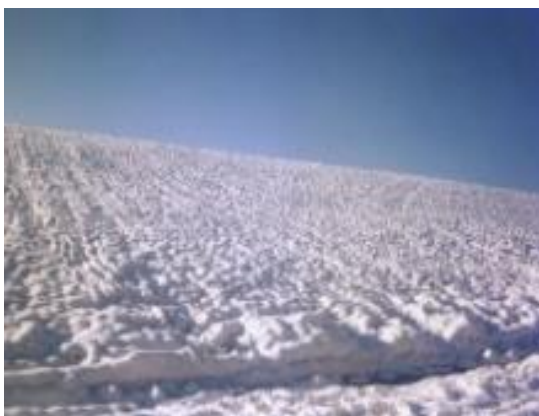
Slika 2. Omekšani i odležani snijeg

Na visini od oko 3000 m, kada je temperatura zraka između 5 i 10 °C ispod nule, u oblacima nastaje snijeg koji počinje padati, dok tijekom padanja prolazi kroz toplu zonu na visini između 800 i 2000 m, gdje se pahuljice snijega otapaju i padaju kao kiša. Prolazeći kroz zonu hladnog zraka ispod 800 m visine, one se više nikada ne mogu vratiti u pahuljice snijega, već padaju i dalje kao kiša koja se na tlu prilikom dodira s hladnim predmetima odmah ledi. To je prema meteorološkom obrazloženju tzv. prehladna kiša, jer je temperatura kapi ispod 0 °C (može biti i ispod -40), no ledi se čim dotakne tlo (Uvodnik, 2014.).