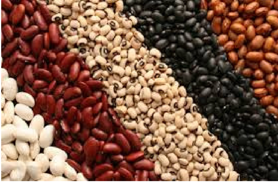
Slika 2. Grah zrnaš