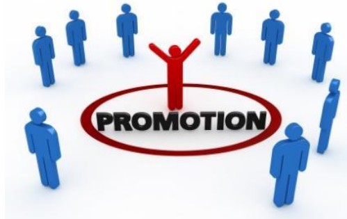
Slika 9. Promocija

Sve promotivne aktivnosti koje gospodarski subjekt koristi moraju biti usuglašene i koordinirane kako bi kupcu bilo naglašeno postojanje proizvoda kako bi on stvorio pozitivan stav prema proizvodu, a i samom gospodarskom subjektu.