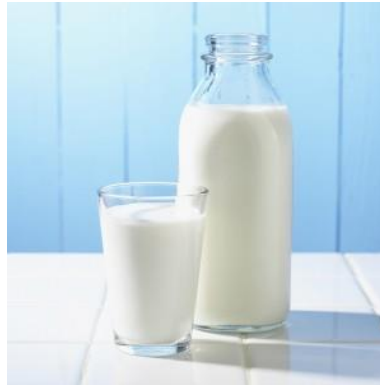
Slika 1. Mlijeko

Danas se mlijeko smatra najsavršenijom prirodnom hranom i jedna je od najpopularnijih namirnica uopće, što dokazuje i činjenica da se godišnje u svijetu proizvede oko 700 milijardi litara mlijeka 1 .