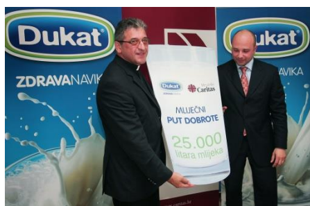
Slika 16: Odnosi s javnošću