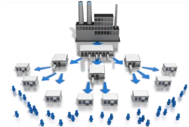
Slika 8. Distribucija

Distibucija obuhvaća načine prodaje, odnosno posrednike i aktivnosti kojima je funkcija povezivanja proizvođača s kupcima i zbog toga govorimo o kanalima distribucije. Odabir kanala distribucije za proizvođača je važna odluka i ima dugoročne posljedice jer je te odluke nekada teže promijeniti od odluka o promjeni cijene.