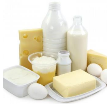
Slika 4. Mliječni proizvodi