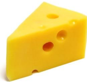
Slika 6. Sir

Sir je namirnica koja je u literaturi obično definirana kao prirodni proizvod dobiven zgrušavanjem mlijeka i obradom sirnoga zrna koji se jede svjež ili u različitim stupnjevima zrelosti. 8