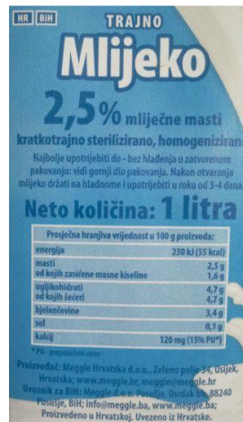
Slika 11. Označavanje