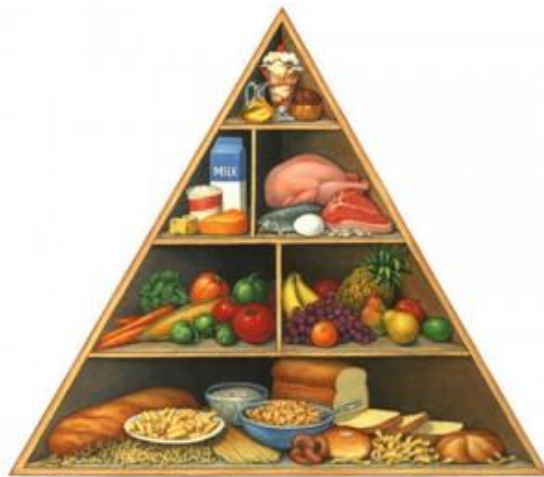
Slika 2. Piramida prehrane

Vitamin B, magnezij i fosfor organizam koristi za oslobađanje energije iz hrane, dok su vitamini A i D važni za održavanje zdravlja kose, kože, kostiju i zuba.