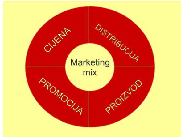
Slika 7. Marketing mix

Kako bi se ostvarili ciljevi tržišne politike, tj. tržišnog poslovanja gospodarskih subjekata, pa tako i proizvođača poljoprivredno prehrambenih proizvoda nužno je definiranje marketing-instrumenata, odnosno marketing mixa.