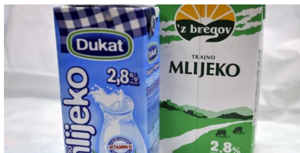
Slika 3. Mlijeko proizvod

Proizvod je važan kako za potrošača, tako i za proizvođača, te ga možemo definirati da je proizvod svaka roba koja se može odrediti po kvaliteti i količini ili da je proizvod sve ono što se može ponuditi tržištu da bi izazvalo pažnju, nabavu, upotrebu ili potrošnju, a što bi moglo zadovoljiti neku želju ili potrebu.