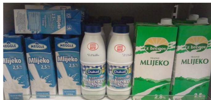
Slika 10. Ambalaža

Mlijeko je proizvod podložan kvarenju, pa je nužno da bude zaštićeno određenom ambalažom i pakiranjem. Transportna ambalaža štiti mlijeko od utjecaja nečistoća, mikroorganizama, svjetlosti i topline, odnosno čuva kakvoću mlijeka. Osim zaštitne potrebno je istaknuti i promotivnu funkciju pakiranja.