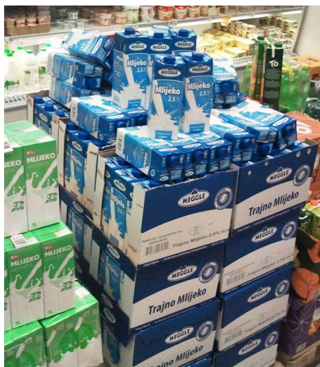
Slika 14: Stupnjevi ambalaže