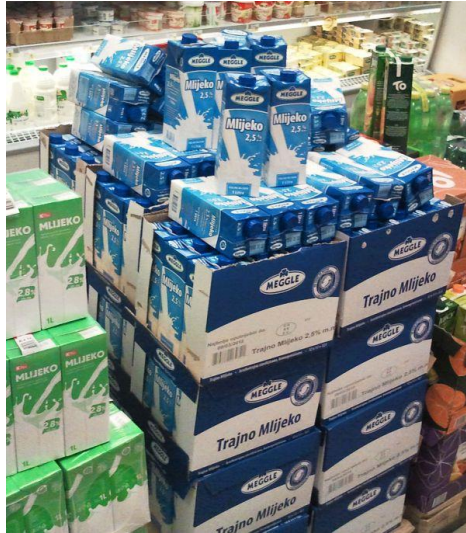
Slika 14: Stupnjevi ambalaže