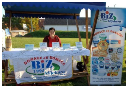
Slika 15: Izložba mlijeka

Sajmovi su marketinški događaj određenog trajanja koji se održavaju u intervalima, odnosno mjesto na kojem velik broj tvrtki predstavlja proizvodni asortiman jednog ili više industrijskih sektora radi pružanja informacija te unapređenja prodaje.