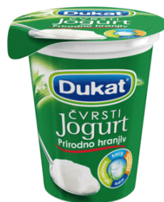
Slika 5. Jogurt

Pod pojmom jogurt kao namirnica podrazumijeva se polutečni mliječni proizvod koji se dobiva zagrijavanjem mlijeka pri višim i trajnijim temperaturama od postupka pasterizacije i dodavanjem bakterija mliječne kiseline koje djeluju kao konzervansi, uzrokuju zgrušavanje i daju kiselost.