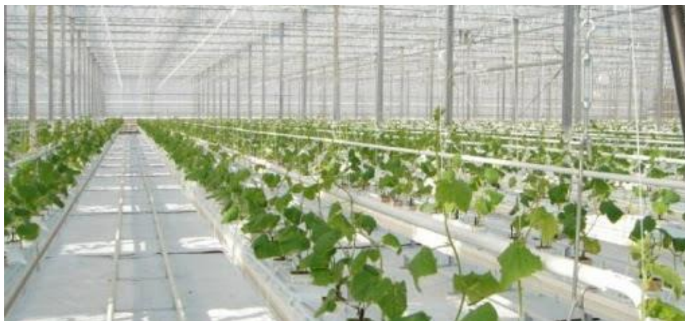
Slika 8. Hidroponski uzgoj krastavaca

Hidroponski uzgoj (slika 8) predstavlja uzgoj povrća u zaštićenim grijanim prostorima u hranjivoj otopini (sa ili bez supstrata). Ovim načinom moguć je kontrolirani uzgoj tijekom cijele godine. Za proizvodnju u hidroponima potrebna su velika ulaganja u automatiziranu opremu, posebna gnojiva i supstrati (npr. kamena vuda, vermikulit, perlit rižine ljuske, vlakna kokosa) koji moraju biti visoko kvalitetni. Ishrana biljaka vodotopivim gnojivima se provodi pomoću sustava za navodnjavanje kap po kap .