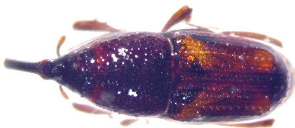
Slika 8. Sitophilus oryzae L. – rižin žižak

Rižin žižak (Slika 8.) je primarni štetnik iz reda Coleoptera , porodice Curculionidae - pipe koji najčešće oštećuje sjeme leguminoza, rasprostranjen je po cijelom svijetu, pogotovo u tropskim područjima. Veličine je od 2,5 – 4,0 mm, crno smeđe boje sa 4 ovalne crvenkasto žute pjege na pokrildju ispod kojega ima drugi par krila kojima može letjeti. Ekonomski je značajna vrsta, te oštećuje cijelo i zdravo zrno žitarica. Za razvoj pogoduju visoke temperature od 24 do 28°C. Ženke jaja odlažu u zrno, a ličinka je nepokretna te se hrani i živi u zrnu. U našim uvjetima ima 3 – 4 generacije, no može imati i više ovisno o temperaturi zrnate mase. Ličinke i imaga ovoga štetnika oštećuju zdrava zrna te time omogućuju infestaciju zrnate mase sekundarnim štetnicima. Upravo zbog smanjenja skladišne mase te njezinog zagrijavanja djelovanjem ovoga štetnika, ona postaje neprikladna za daljnje korištenje. Ženka S. oryzae liježe 300 – 600 jaja, a razvoj uz optimalne uvjete traje 24 dana (Korunić, 1990.).