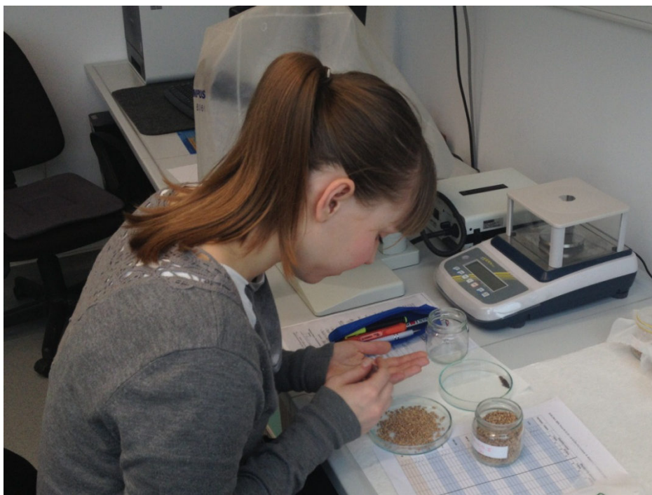
Slika 10. Pregled tretmana