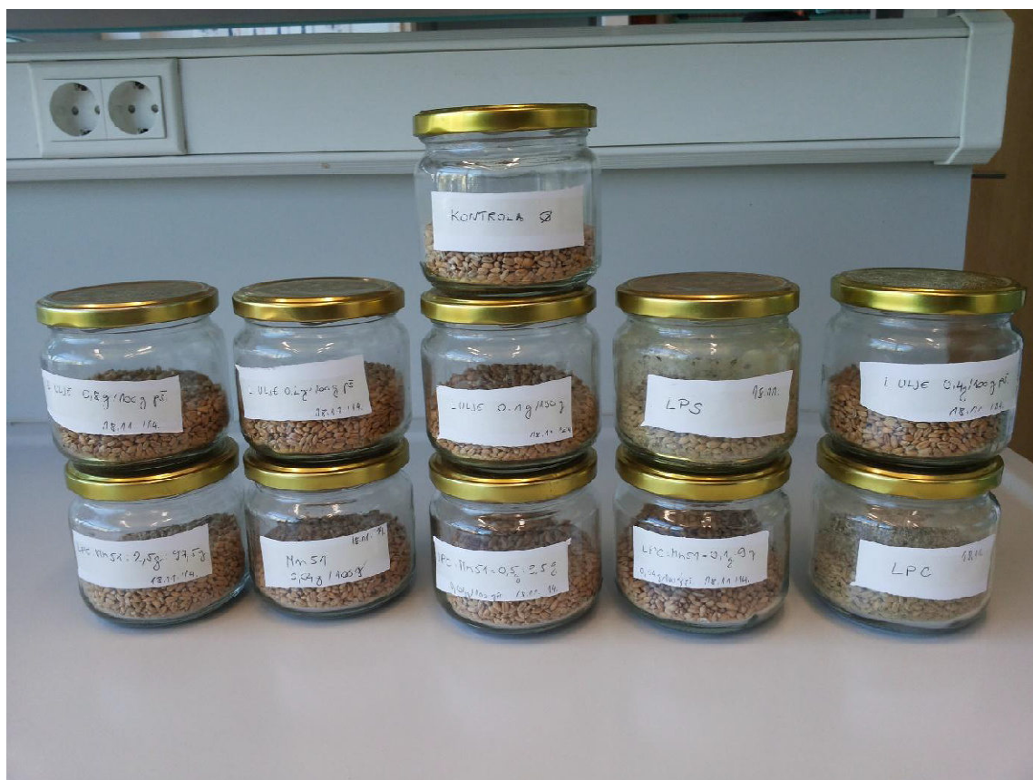
Slika 12. Tretmani – testovi A, B i C

U svaki tretman dodano je po 5 odraslih jedinki od svake vrste kukaca, a staklenke su prekrivene perforiranim poklopcima i stavljene u kontrolirane uvjete. Očitanje mortaliteta izvršeno je nakon 3, 6 i 14 dana (Slika 12.).