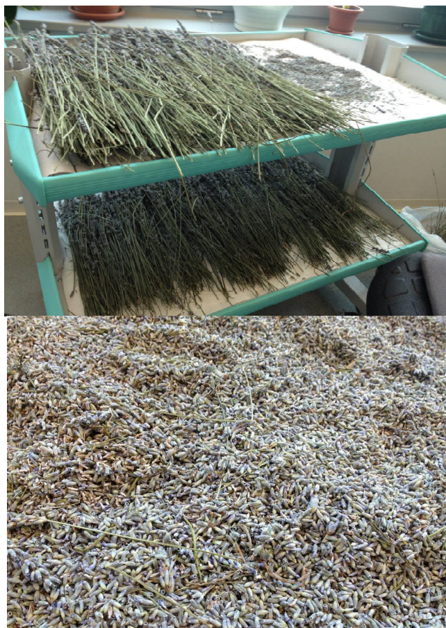
Slika 11. Sušenje lavandina

Istraživanje je provedeno na tri vrste kukaca: rižin žižak Sitophilus oryzae (Linnaeus), žitni kukuljičar Rhizopertha dominica (Fabricius) i kestenjasti brašnar Tribolium castaneum (Herbst). Korišteni su odrasli kukci starosti 7 – 21 dan pomiješanoga spola, a u svaki uzorak dodano je 5 jedinki od svake vrste. Svi kukci uzgajani su u kontroliranim uvjetima na 28 do 30 °C i rvz 60-70%. Za svaki tretman korištene su 4 doze (prašiva lavandina – cvijet, stabljika, DZ, eterično ulje lavandina).