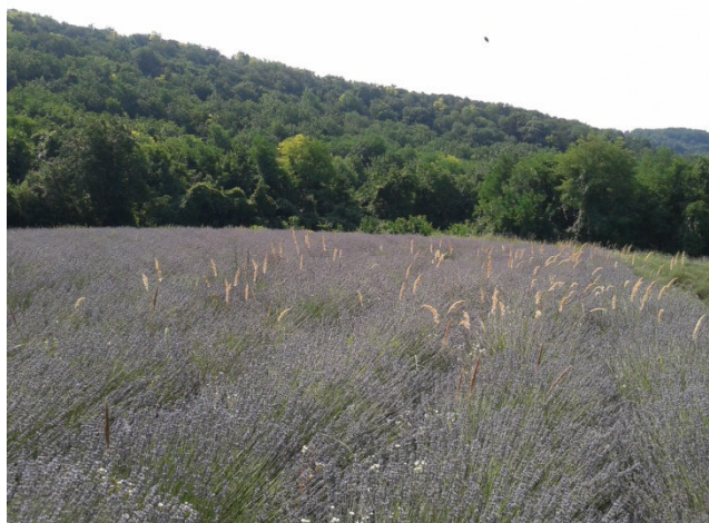
Slika 4. Banovo brdo, polje lavandina ( Lavandula x intermedia )

Raste kao grm (Slika 4.) visine 80-100 cm, a promjera i do 150 cm. Cvjetne stabljike su dužine od 60-90 cm, a listovi su zeleni, dužine od 5-7 cm. Karakterizira ga cvijet kao i kod prave lavande, ali je sjeme sterilno stoga se ne može iz njega razmnožavati. Kod hibrida, razmnožavanje se vrši vegetativno (Šilješ i sur., 1992.).