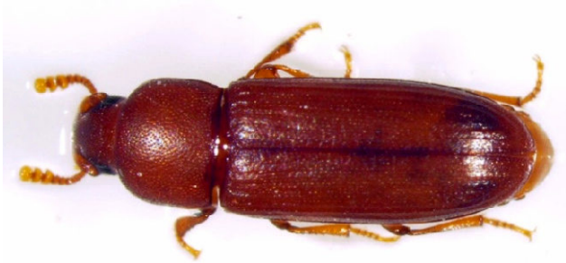
Slika 9. Tribolium castaneum Herbst. – kestenjasti brašnar