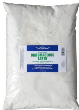
Slika 6. Komercijalni pripravak na osnovi dijatomejske zemlje