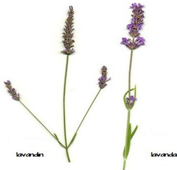
Slika 3. Razlika između lavandina i lavande