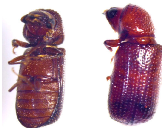
Slika 7. Rhyzopertha dominica F. - Žitni kukuljičar

Žitni kukuljičar (Slika 7.) je primarni štetnik iz reda Coleoptera , porodice Bostrichidae - bušaći koji najčešće napada uskladištenu zrnatu robu (pšenica) ali i sušeno korjenasto bilje, sušeno voće, te drvo. Veličine je od 2,3 - 3,0 mm, tamnosmeđe do hrdaste boje, a svoj životni ciklus provodi unutar zrna. Ličinka je bijele boje s dobro razvijena 3 para nogu. Termofilna je vrsta, a optimalna temperatura za razvoj iznosi 30°C, te se pri temperaturama od 15 – 17°C razvoj zaustavlja. Zaražena skladišna masa (pšenica) poprima slatkasti miris zbog izlučevina ličinki za vrijeme ishrane. Ženka R. dominica odlaže od 300 – 500 jaja, a razvoj u optimalnim uvjetima traje 24 dana (Korunić, 1990.).