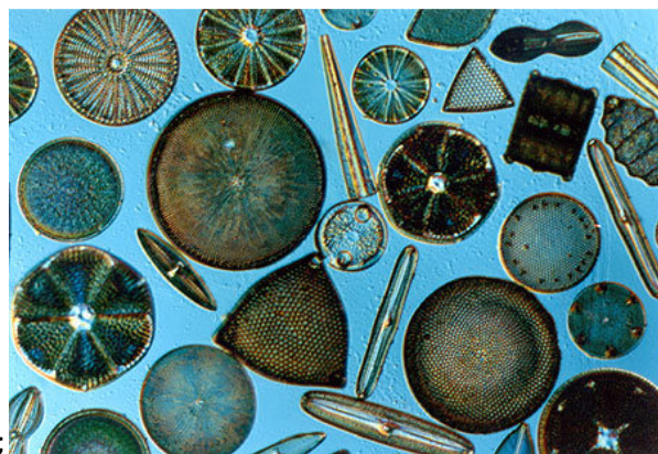
Slika 5. Različite vrste dijatoma