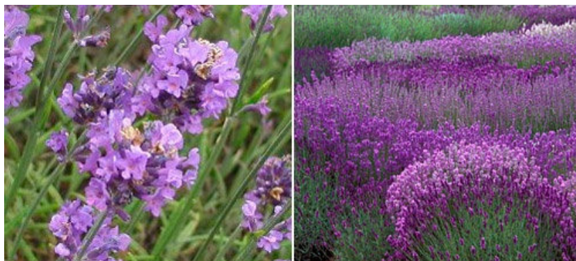
Slika 1. Lavanda ( Lavandula angustifolia Mill.)

Lavanda je višegodišnja biljka koja raste u obliku grma, a životni vijek samonikle i kultivirane lavande je oko 30 godina. Raste u obliku poluloptastog sitnog grma visine 40-60 cm i promjera 80-120 cm. Cvjetne grane su duge 20-40 cm, listovi nasuprotni, uski i dugi 3-5 cm, sivozelene boje (Slika 2.). Cvjetovi su zigomorfni, a latice ljubičasto plave boje. Termofilna je biljka kojoj pogoduju visoke temperature zraka zbog nagomilavanja eteričnog ulja. U slučaju kišovito i hladnog vremena u vrijeme cvjetanja, udio eteričnog ulja se može smanjiti i za 50%. Na istom mjestu se uzgaja 15-20 godina, stoga nema mjesta plodoredu. Razmnožavanje se vrši sadnicama dobivenim iz sjemena, ali može se razmnožavati i vegetativno, te zelenim sadnicama (Šilješ i sur., 1992.).