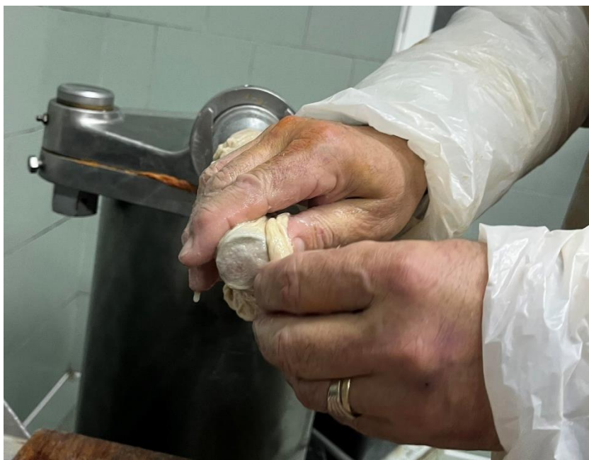
Slika 4. Navlačenje svinjskog crijeva