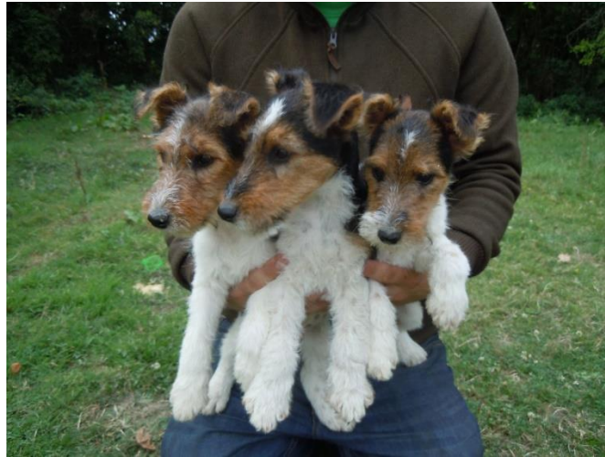
Slika 6. Prikaz štenaca oštrodlakog foksterijera

Za foksterijere, kako bi se spriječila prekomjerna težina, postoje dani posta na niskokaloričnom povrću i krekerima. Ne preporučuje se ostavljanje hrane na vidljivom mjestu, dok svježa voda mora biti uvijek dostupna.