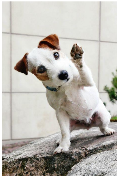
Slika 7. Prikaz štenaca kratkodlakog foksterijera