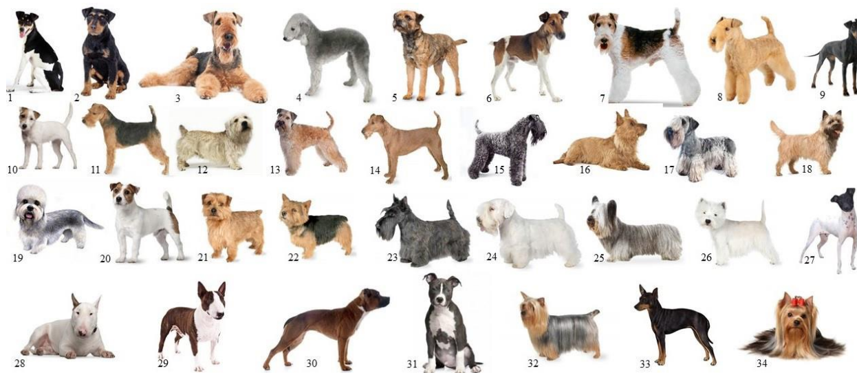
Slika 3. FCI grupa 3: Terijeri.

Iako su se mnogi jamari razvili u više europskih zemalja, većina svjetskih terijera potječe iz Velike Britanije. Njihovo ime potječe od riječi „ terra “ što na latinskom jeziku znači zemlja. Svi su terijeri mladog postanka. Vrlo se malo spominju prije 1560. godine kad ih je britanski pisac dr. John Caius opisao kao prgave i oštre pse koji se mogu podnijeti jedino ako žive u staji (Fogle, 2007 u Janeš, 2020.). Dok su jazavčari imali glatku, priljubljenu dlaku, terijeri što ih opisuju dr. Caius i drugi britanski pisci 18. stoljeća kao Thomas Bewick imali su oštru dlaku koja je obično bila crna s paležom ili riđa. Imali su uspravne uši i živahan temperament. Ove robusne i mišićave pse privlačila je sva divljač: lisice i jazavci, ali i štakori, lasice, tvorovi, vidre, svisci, miševi i zmije. (Janeš, 2020.)