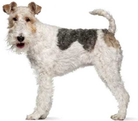
Slika 5. Prikaz oštrodlakog foksterijera

Rep je prije bio uobičajeno kupiran. (Hrvatski kinološki savez, 2022.) Rep bi trebao biti prilično visoko postavljen i nošen veselo, ali ne uvijen. Također trebao bi biti čvrsti tj. snažan te pristojne duljine. Vrlo kratak rep nije prikladan ni za posao ni za izložbu. Gledano sprijeda, ramena bi se trebala strmo spuštati prema dolje od svog spoja, s vratom prema vrhovima, što bi trebalo zadovoljavati kriterije. Gledano sa strane, trebala bi biti duga, dobro položena unatrag i trebala bi se koso spuštati unatrag od vrha do grebena, koji bi uvijek trebao biti čisto ošišan. Laktovi bi trebali visjeti okomito na tijelo, radeći slobodno od strane. Gledano iz bilo kojeg smjera, noge bi trebale biti ravne, a kosti prednjih nogu jake sve do stopala. Najgori mogući oblik stražnjih nogu sastoji se od kratkog drugog bedra i ravnog koljena, kombinacije koja uzrokuje da stražnje noge djeluju kao oslonci, a ne kao pogonski instrumenti. Šape su okrugle s čvrstim kompaktnim, malim i dobro podstavljenim jastučićima. (Hrvatski kinološki savez, 2022.) Terijer s dobro oblikovanim prednjim nogama i šapama skratit će nokte u kontaktu s površinom tla, pri čemu je težina tijela ravnomjerno raspoređena između jastučića prstiju i pete.