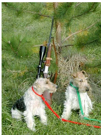
Slika 8. Oštrodlaki foksterijeri u lov.