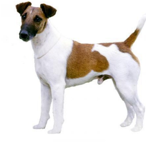
Slika 4. Prikaz kratkodlakog foksterijera

prema van. Rep je prije uvijek bio skraćivan pa je on izgledao visoko nasaden i uspravno nošen. (Hrvatski kinološki savez, 2022.)