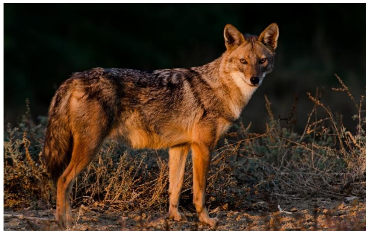
Slika 2. Prikaz čaglja Canis aureus

Charles Darwin vjerovao je da su preci pasa čagalj Canis aureus i vuk Canis lupus . Njegovo mišljenje podupirao je i Konrad Lorenz, nobelovac poznati po istraživanju ponašanja životinja. Međutim, zbog suočavanja s novim spoznajama priklonio se danas utemeljenom mišljenju da je vuk zajednički predak svim psima. (Tucak i sur., 2003.)