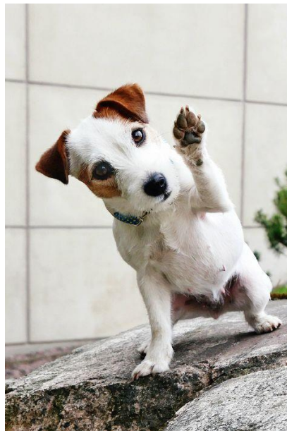
Slika 7. Prikaz štenaca kratkodlakog foksterijera