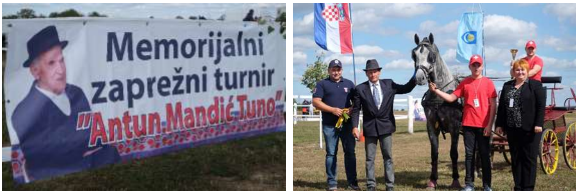
Slika 6. Memorijalni zaprežni turnir „Antun Mandić Tuno“

Konjička manifestacija se održava u spomen staromu i istaknutom konjogojcu Antunu Mandiću Tuni, te se u njegovu čast održava turnir u vožnji dvoprega i jednoprega u Čepinu. Uz stol ukrašen peharima stoji i stolica s ležerno postavljenom Tuninom šokačkom rekljom (štrikanac bundur) i obaveznim šokačkim šeširom.