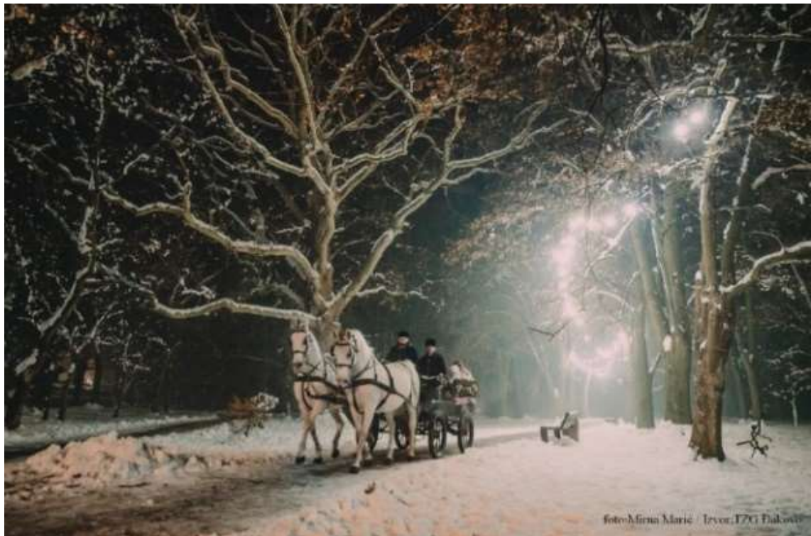
Slika 11. Vožnja fijakerom tijekom Adventa

U Pastuharni u Đakovu su smješteni pastusi za dresurno jahanje te vožnju jednoprega, dvoprega i četveroprega. Korabi i sur. (2017., 2019.) navode da kulturno-folklorne manifestacije imaju osnovnu djelatnost, a to je očuvanje genetskoga potencijala lipicanske pasmine i korištenje vrhunskih grla u zaprežnome i dresurnom sportu. Konjičke predstave održavaju se tijekom cijele godine, a tematske predstave odnose se na Božićni bal lipicanaca, Đakovačke vezove, Uskrs na Ergeli Đakovo, Dane otvorenih vrata i Manifestaciju Sv. Huberta, kao i na vožnje kočijama i zapregama te razne ponude i programi za djecu (Deže i sur., 2019.). Posebna ponuda je najam konja i fijakera za vjenčanja pod nazivom „U zajednički život fijakerom i lipincima“. Ergelu godišnje u prosjeku posjeti oko 20 000 turista kojima se u pastuharni pruža mogućnost obilaska štala, jahaonice, vanjskoga hipodroma, šetalice za konje, terena za dresurno jahanje, te mogu vidjeti fijakere za sportsku zaprežnu vožnju. Vrijeme trajanja obilaska traje između trideset i četrdeset i pet minuta. Programi su prilagođeni djeci vrtićkog uzrasta, obiteljima s djecom, učenicima osnovnih i srednjih škola, umirovljenicima te stručnim ekskurzijama.