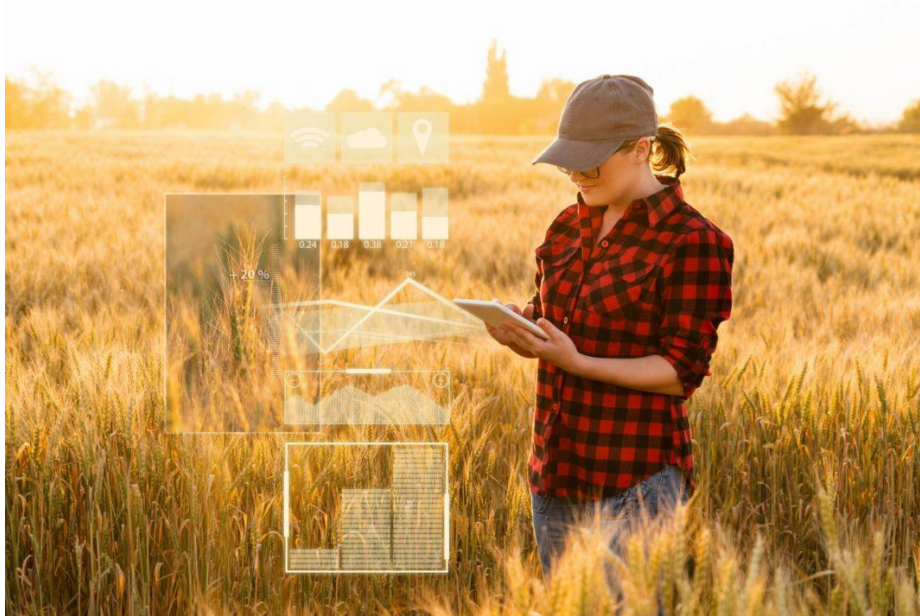
Slika 10. Savladavanje budućih izazova u poljoprivredi