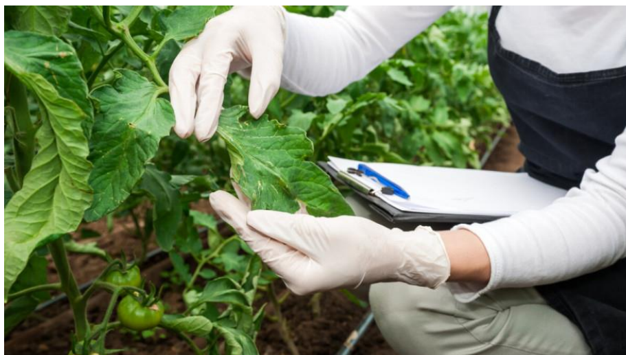
Slika 9. Suvremeni postupci zaštite bilja