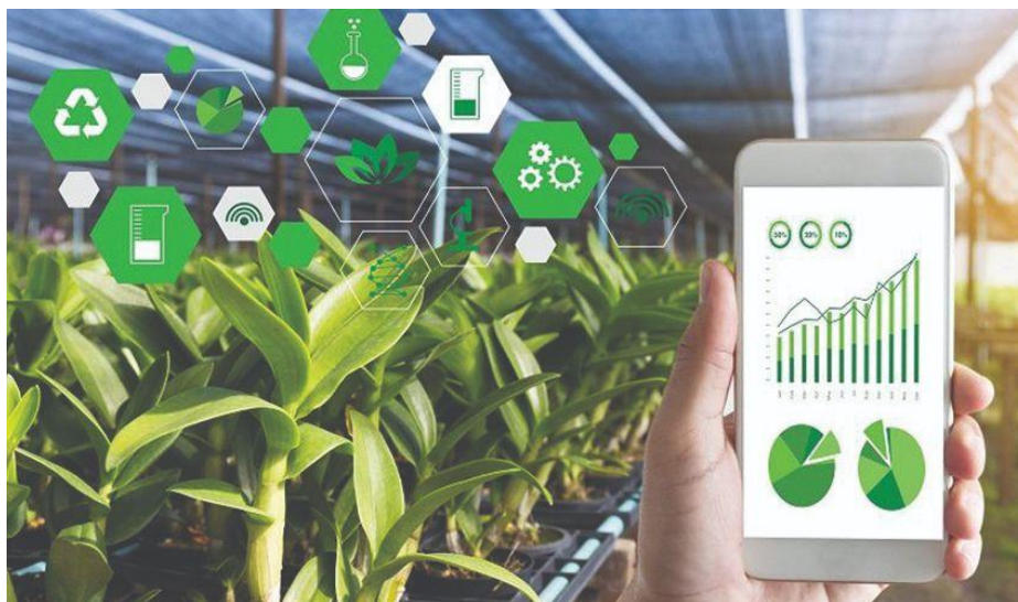
Slika 6. Strojno učenje i digitalne tehnologije