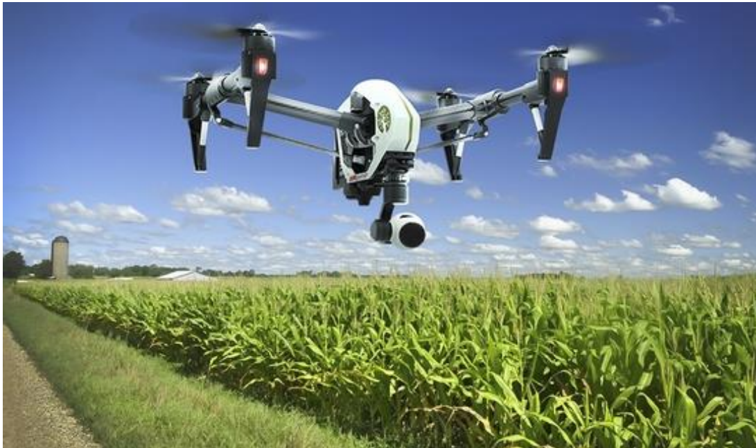
Slika 2. Snimanje iz zraka u preciznoj poljoprivredi

Zbog svoje svestranosti, kao i nevjerojatne tehnologije snimanja koja pokriva od mogućnosti isporuke do fotografiranja, upravljanja pomoću daljinskog upravljača i spretnosti uređaja u zraku, omogućeno je da se s navedenim uređajima učini mnogo više. Tako dronovi ili UAV-ovi postaju sve više popularni za dostizanje velikih visina i udaljenosti i izvođenje nekoliko primjena.