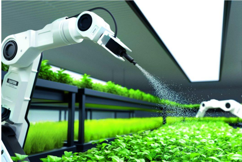
Slika 4. Primjena robota u poljoprivredi