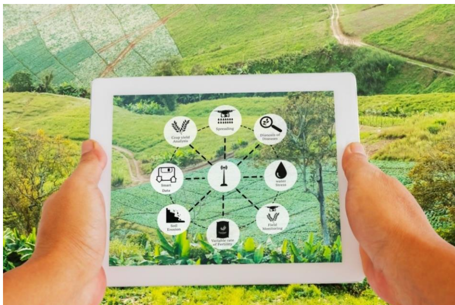
Slika 7. Analiza komponenti i sustava tla

Usavršavanje tehnika strojnog učenja u svrhu predviđanja karakteristika tla i prinosa usjeva omogućeno je stručnom suradnjom, praćenjem modela i modificiranjem. Primjena tehnika strojnog učenja na analizu informacija o tlu može dovesti do optimizacije upotrebe gnojiva, predviđanja izbijanja štetočina i bolesti te preporuke preciznih strategija navodnjavanja. To može rezultirati povećanom poljoprivrednom produktivnošću i učinkovitim upravljanjem zemljišnim resursima (Wolfert i sur., 2017.).