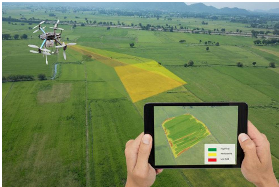
Slika 5. Volodrone – megadron za poljoprivredu

Daljinska detekcija uz korištenje dronova za snimanje, obradu i analizu slike ima veliki utjecaj na poljoprivredu. Čini se da je ruralno poduzeće s velikim entuzijazmom shvatilo nesvakidašnju inovaciju, koristeći te pokretačke instrumente za promjenu trenutnih poljoprivrednih metoda. Potpuna adresabilna procjena aranžmana potaknutih automatizacijom u svakoj pojedinoj relevantnoj industriji je kritična. Razvoj dronova povezan je s bežičnim senzorskim mrežama. Podaci prikupljeni od strane senzora omogućuju dronovima da unaprijedi njihovu upotrebu, na primjer za ograničavanje raspršivanja sintetičkih spojeva na pažljivo određena područja. Budući da postoje nagle i stalne promjene u ekološkim uvjetima, kontrolni krug gotovo sigurno mora reagirati onoliko brzo koliko se razumno može očekivati (Talaviya i sur., 2020.).