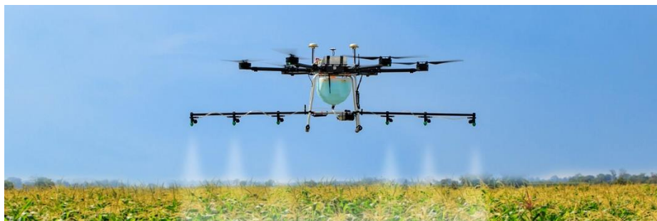
Slika 8. Aplikacija pesticida dronom

Zhu i sur. (2010.) razvili su ujedno prvi kontroler preciznog prskanja za bespilotne letjelice. Dron se može daljinski kontrolirati ili automatizirati unaprijed modificiranim planovima leta. Prema ovom ispitivanju, kontroler se razvija kao sustav visoke točnosti za primjene prskanja. Dodatno je zadužen za smjernice mjere pesticida kako bi se održala strateška distanca od ekstremne primjene. Neumjerena uporaba pesticida može pokazati neučinkovitost ili štetu za prinos.