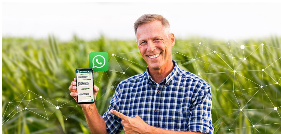
Slika 3. AGRIVI chatbot za poljoprivrednike