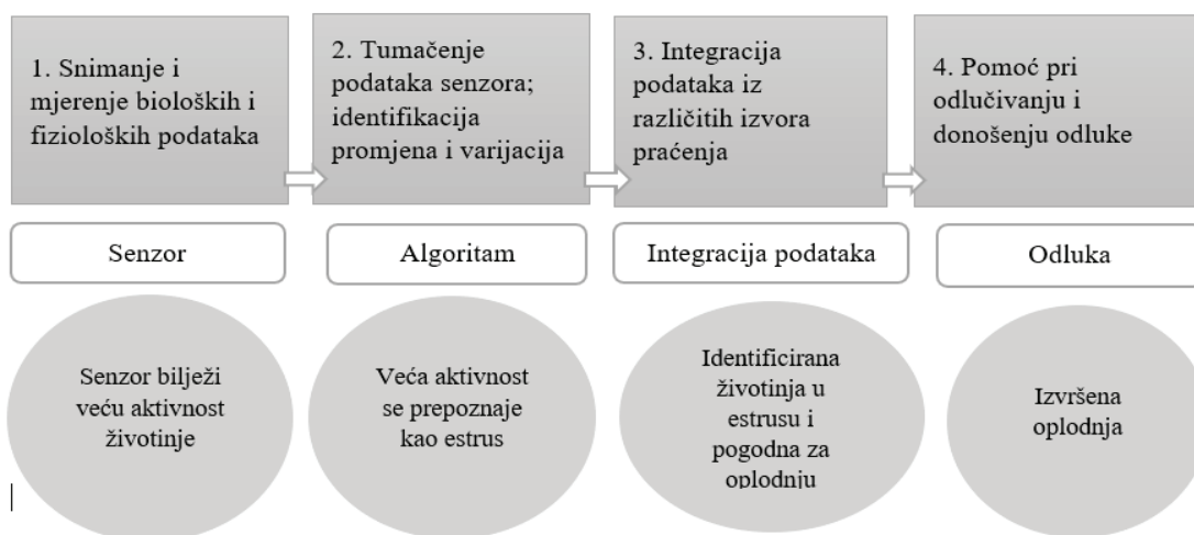
Slika 2. Shematski prikaz funkcioniranja PLF sustava na primjeru otkrivanja estrusa kod krava (Rutten i sur., 2013.)

Iako je za farmera primarno značenje ima informacija dobivena primjenom PLF sustava, u novije se vrijeme sve više opravdava potreba i da sustavi preciznoga praćenja proizvodnje na farmi svoje podatke ne zadržavaju samo za sebe, nego da ih prosljeđuju i drugim subjektima uključenim u proces proizvodnje (odnosno proizvođačima hrane, veterinarima, prerađivačima i potrošačima), što može doprinijeti poboljšanju poslovanja unutar većega proizvodnog sustava. Može se reći da podatci dobivaju takozvanu novu dodanu vrijednost, jer bi u protivnome bili nepotpuno iskorišteni. Na ovaj način sustavi PLF-a povećavaju transparentnost proizvodnje, što je važno za potrošača. Farmerova spoznaja da su on i njegova proizvodnja nadzirani dovodi do minimaliziranja broja nepoželjnih postupaka tijekom proizvodnje. Istodobno, kao posljedica stalnoga nadzora farmera i proizvodnje te brojnih upozorenja, kod određenoga se broja farmera javlja i stalna pojava frustracije i stresa, a to svakako dugoročno ne mogu biti poželjni uvjeti farmerova rada te mogu, u određenoj mjeri, izazvati i nepovjerenje prema preciznomu sustavu kontrole.