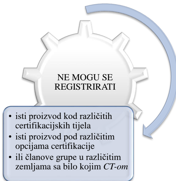
Slika 2. Slučajevi koji se ne mogu registrirati

Ugovor o uslugama između CT i proizvođača može važiti na razdoblje do četiri godine, s naknadnim produžetkom na periode do četiri godine. Poljoprivredno poduzeće ne može registrirati sve proizvod u slučajevima koje prikazuje Slika 2.