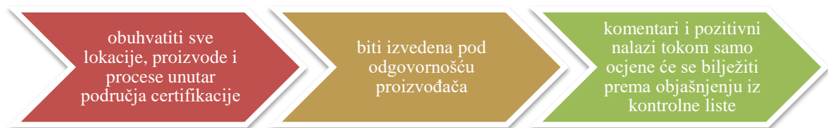
Slika 4. Elementi koje mora sadržavati ocjena

Registrirana strana, kako bi bila certificirana mora izvršiti samo procjenu (opcija 1 i opcija 1 više lokacija bez Sustava upravljanja kvalitetom; engl. Quality Management System ) ili internu inspekciju (opcija 1 više lokacija sa Sustavom upravljanja kvalitetom; engl. Quality Management System i opcija 2), te imati eksternu inspekciju od strane certifikacijskog tijela koje je odabrala. Samo ocjena mora sadržavati elemente koje prikazuje Slika 4.