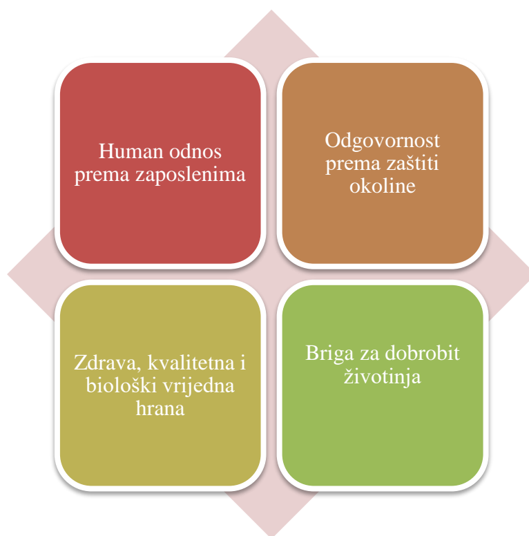
Slika 5. Uvjeti kupaca za kupnju poljoprivrednih proizvoda

Osnovni uvjeti, krajnjih kupaca, prilikom odluke o kupnji poljoprivrednih proizvoda su sve zahtjevniji jer se ipak radi o osnovnoj životnoj potrebi, tj. hrani. Ti uvjeti mogu se navesti u nekoliko važnih točaka, a prikazuje ih Slika 5.