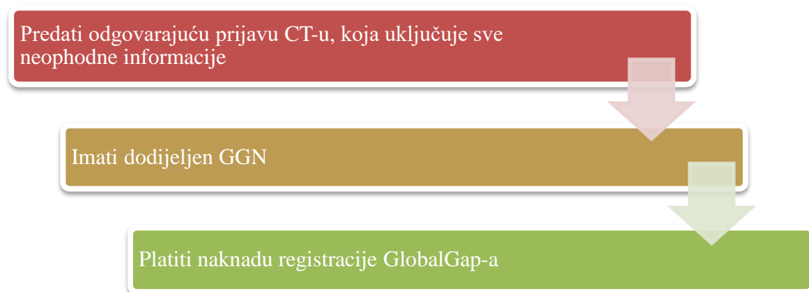
Slika 3. Uvjeti koji se moraju zadovoljiti za prihvaćanje registracije

Kako bi registracija bila prihvaćena i naplavljena u skladu sa GlobalGap pravilima , poljoprivredno poduzeće mora zadovoljiti sve uvjete koji su prikazani Slikom 3.