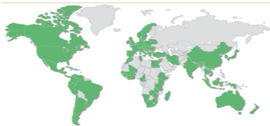
Slika 6. Rasprostranjenost certificiranih GlobalGap proizvođača u svijetu