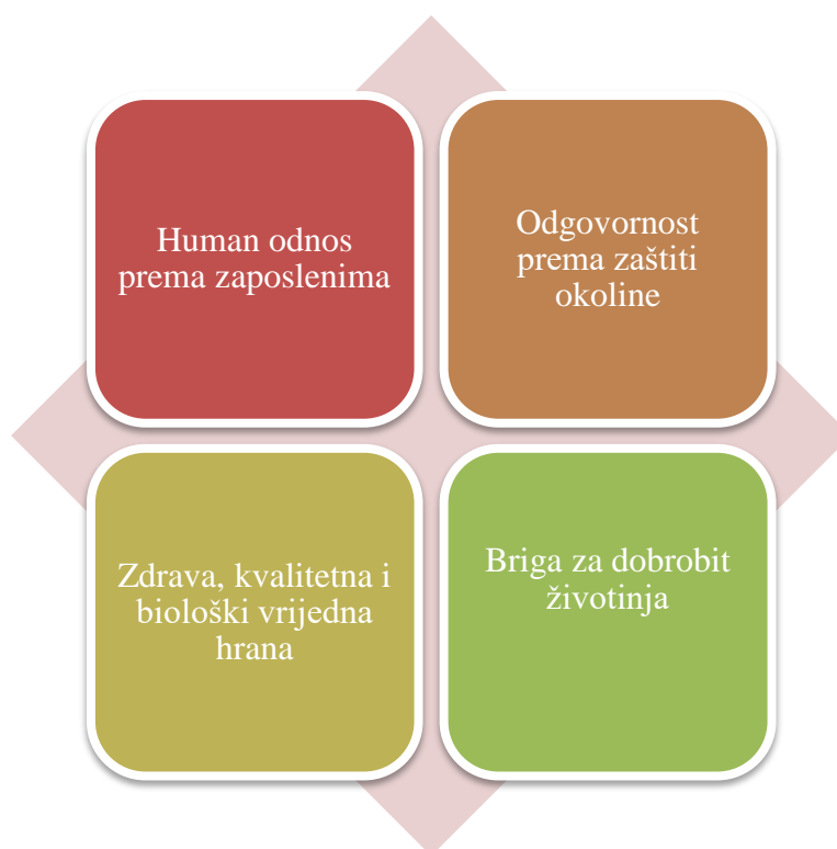
Slika 5. Uvjeti kupaca za kupnju poljoprivrednih proizvoda

Osnovni uvjeti, krajnjih kupaca, prilikom odluke o kupnji poljoprivrednih proizvoda su sve zahtjevniji jer se ipak radi o osnovnoj životnoj potrebi, tj. hrani. Ti uvjeti mogu se navesti u nekoliko važnih točaka, a prikazuje ih Slika 5.