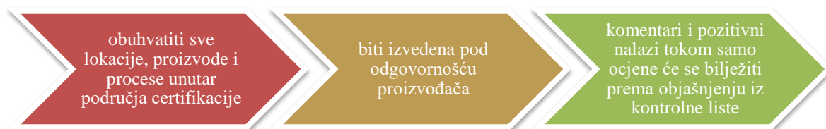
Slika 4. Elementi koje mora sadržavati ocjena

Registrirana strana, kako bi bila certificirana mora izvršiti samo procjenu (opcija 1 i opcija 1 više lokacija bez Sustava upravljanja kvalitetom; engl. Quality Management System ) ili internu inspekciju (opcija 1 više lokacija sa Sustavom upravljanja kvalitetom; engl. Quality Management System i opcija 2), te imati eksternu inspekciju od strane certifikacijskog tijela koje je odabrala. Samo ocjena mora sadržavati elemente koje prikazuje Slika 4.