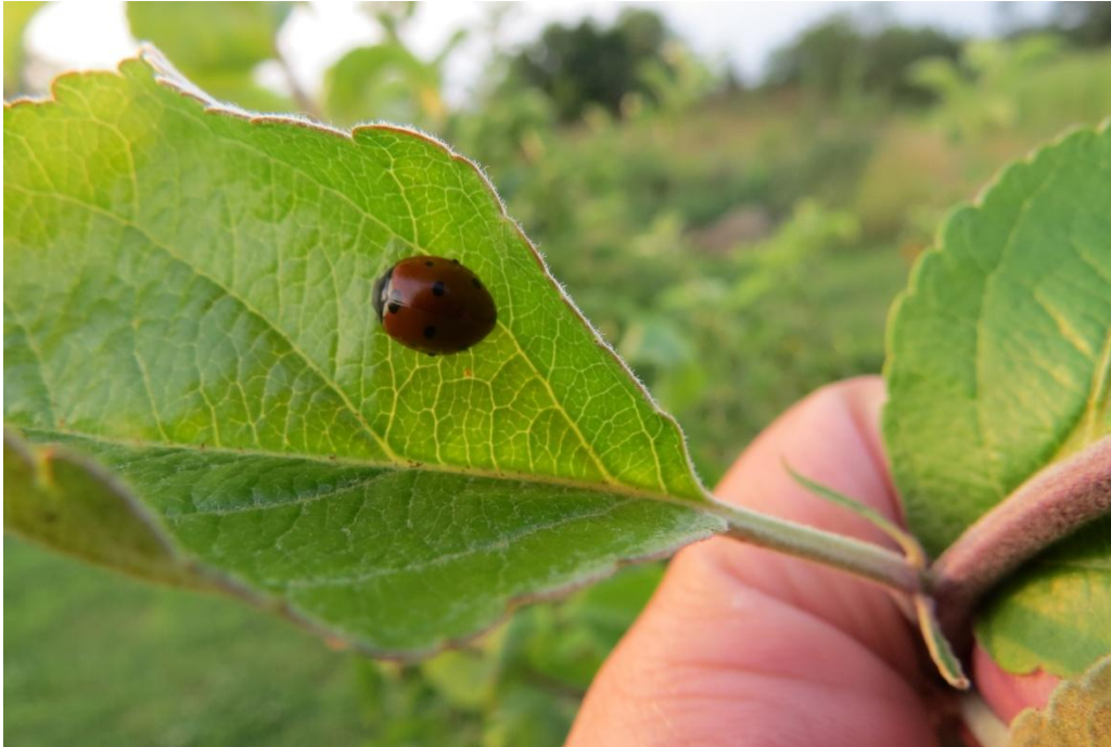
Slika 9a. Božja ovčica na listu jabuke