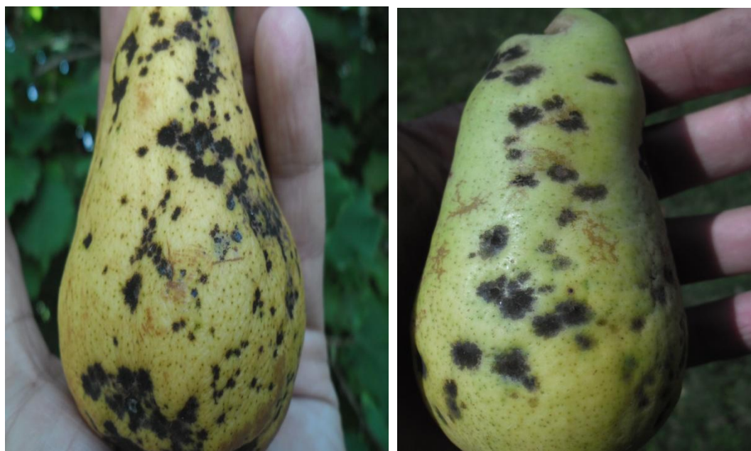
Slika 7. Štete od krastavosti na plodu kruške

Zaštita od krastavosti: Najbolji uspjesi u suzbijanju krastavosti postižu se preventivnom zaštitom u rano proljeće (bakrenim fungicidima).