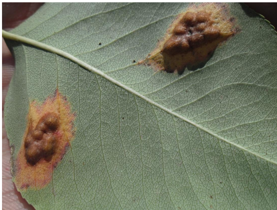
Slika 8e. Kruškin pikac na naličju lista kruške