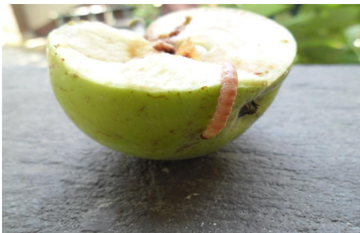
Slika 4b. Ličinka jabučnog savijača na plodu jabuke