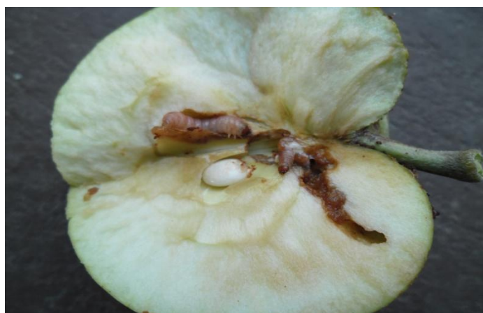
Slika 4c. Ličinka jabučnog savijača u plodu jabuke