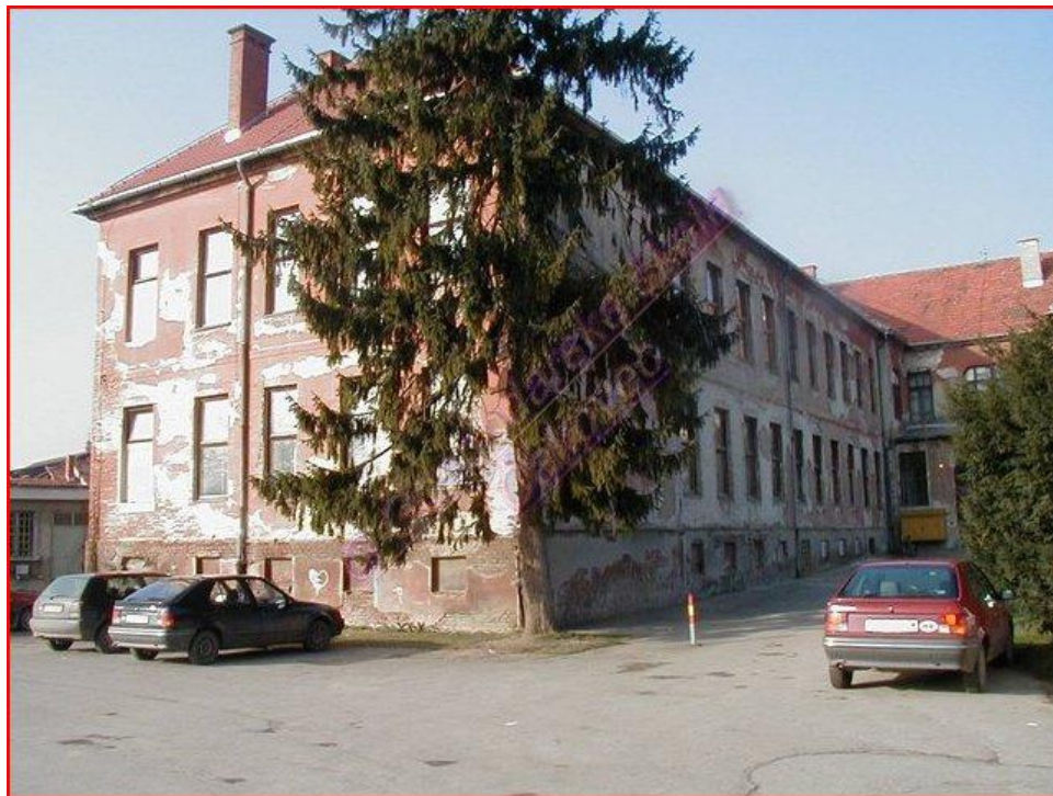
Slika 1. Pogled na staru zgradu Gospodaske škole