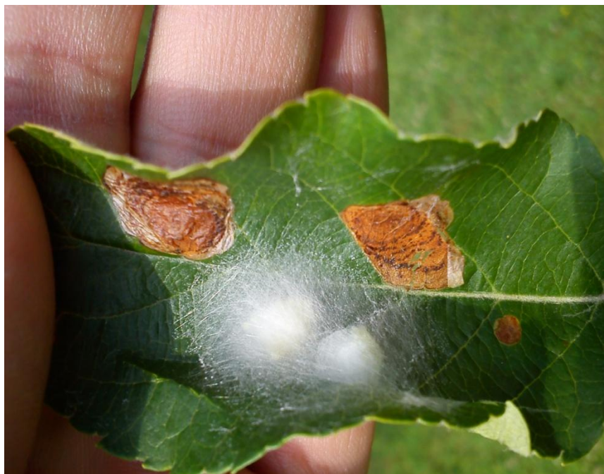
Slika 5a. Mine i kukuljice na listu