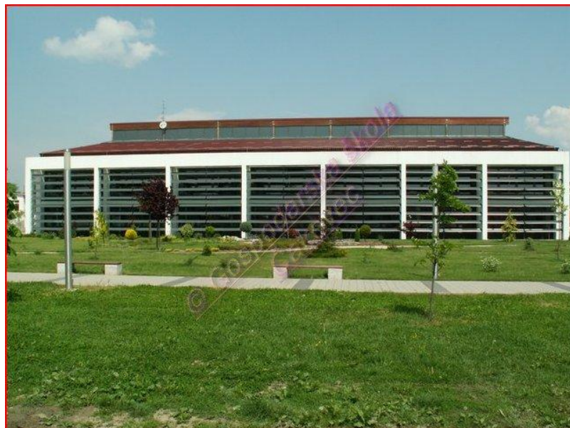
Slika 2. Nova zgrada Gospodaske škole