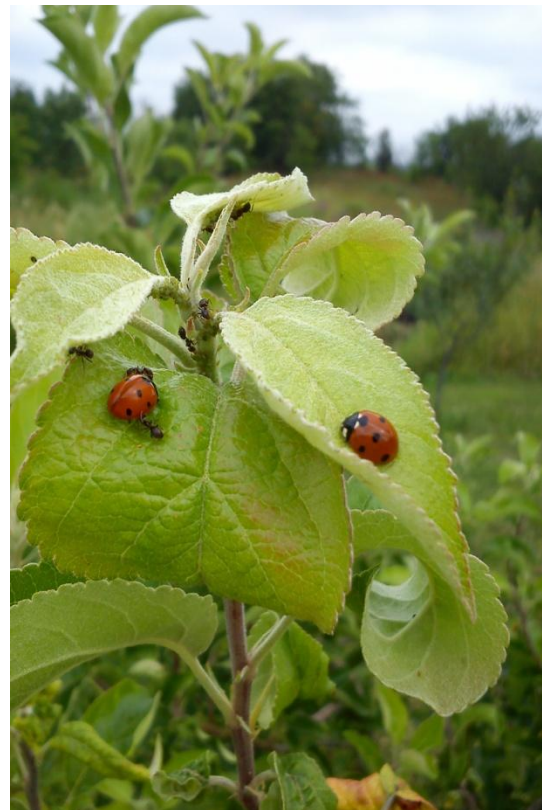
Slika 9b. Božja ovčica sa lisnim ušima