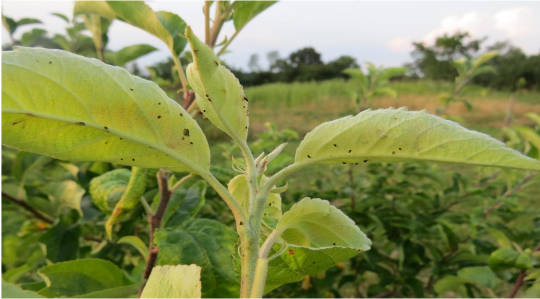
Slika 3a. Lisne uši na naličju lista jabuke