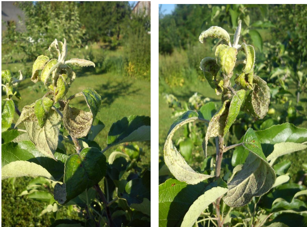
Slika 3b. Štete od lisnih uši