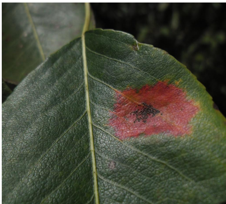
Slika 8c: Kruškin pikac na listu kruške