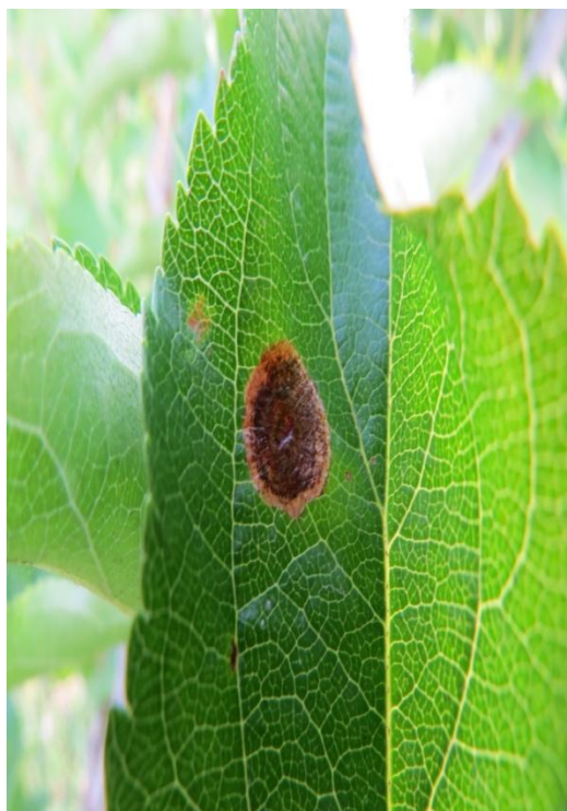
Slika 5b. Štete na licu i naličju lista od lisnih minera