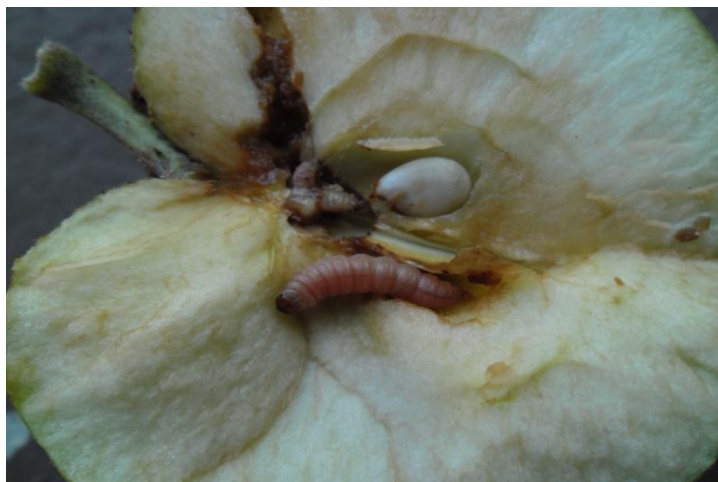
Slika 4a. Ličinka jabučnog savijača