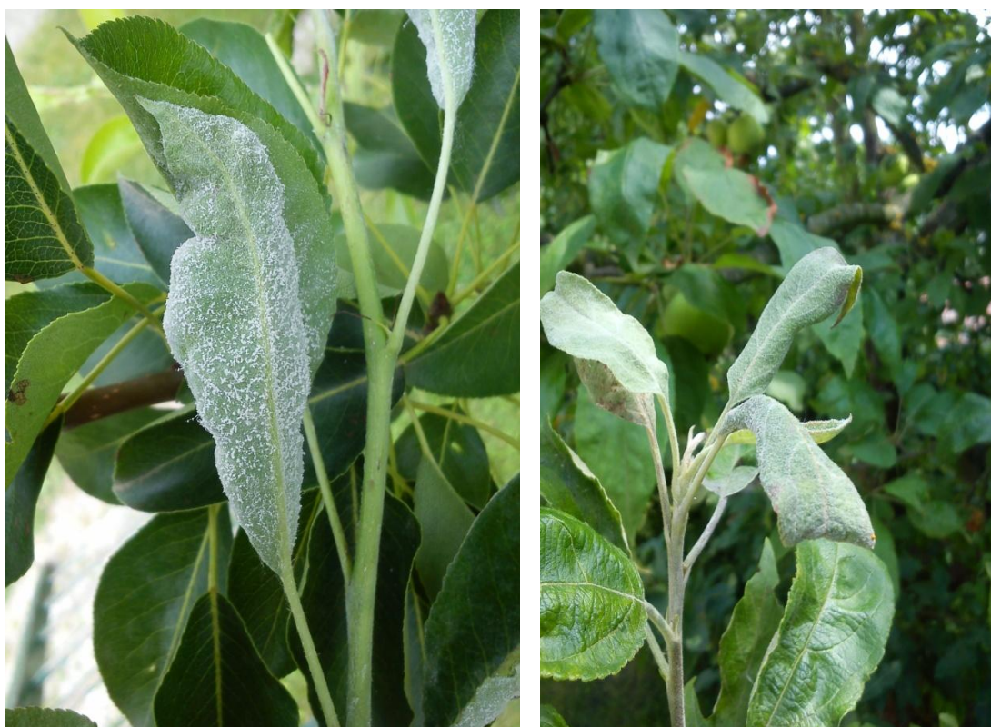
Slika 6b. Bijela prevlaka na naličju lista jabuke