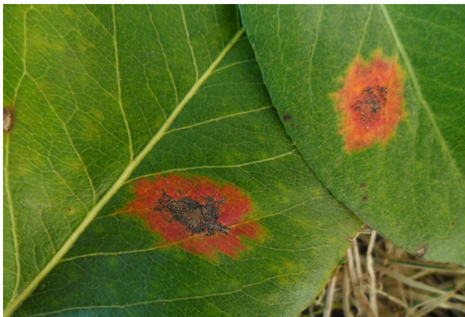
Slika 8b. Kruškin pikac na listu kruške