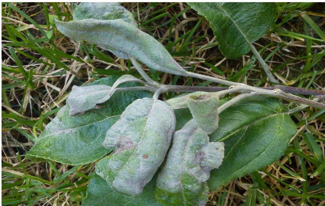
Slika 6a. Pepeljasta prevlaka na listu jabuke