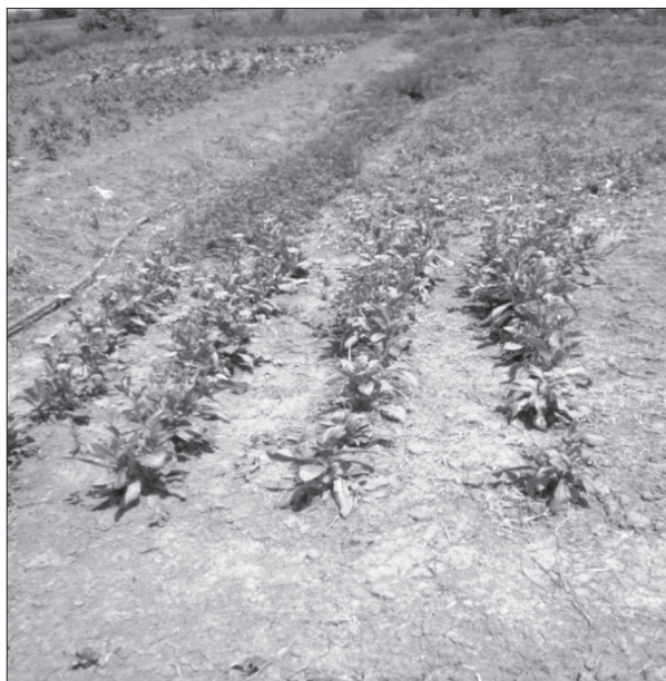
Slika 3. Sklop C

Figure 2. Plant density B