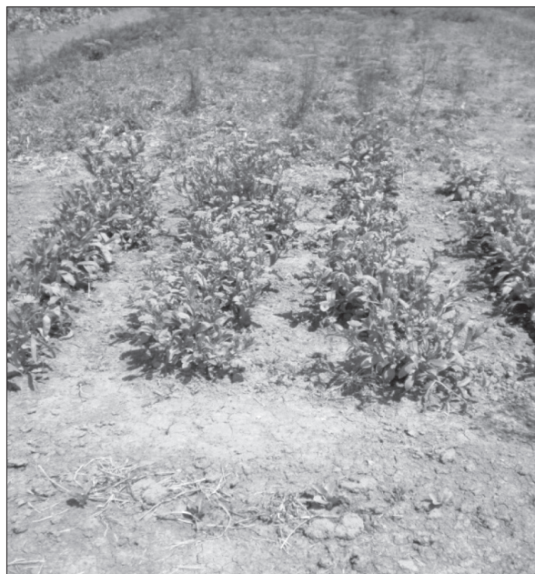
Slika 2. Sklop B

Figure 1. Plant density A