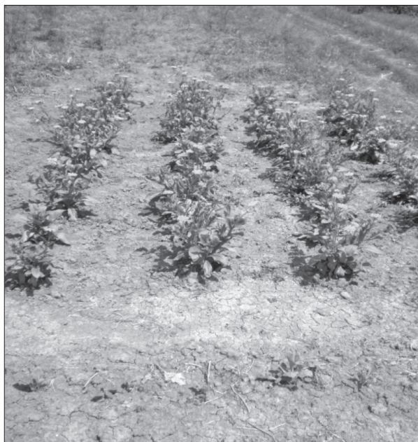
Slika 1. Sklop A

Figure 1. Plant density A