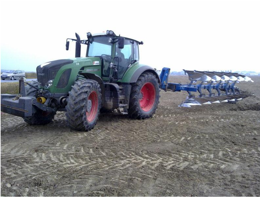
Slika 3. Traktor FENDT i plug LEMKEN (polunošeni) ( http://img230.imageshack.us/img230/8595/07092010119.jpg )