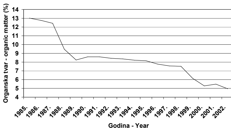
Organska tvar - organic matter

Postotni udio organske tvari za svaku godinu u nizu pokazuje statistički visoko značajan trend opadanja tijekom sedamnaestogodišnjeg perioda istraživanja ( P < 0,01 ; F = 87,954^{**} ; t_{(16)} = 13,977 ) i to za 0,92% ( y = 26,922 - 0,92x_i ) (Grafikon 1.). Istovremeno, i sadržaj humusa za svaku godinu u nizu ima statistički visoko značajan trend opadanja ( P < 0,01 ; F = 27,208^{**} ; t_{(16)} = 8,751 ) i to za 0,79% ( y = 21,865 - 0,79x_i ) (Grafikon 2.).