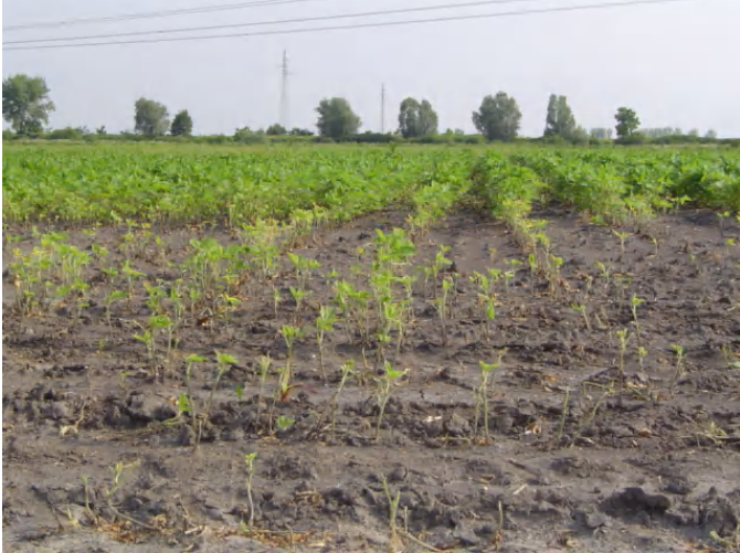
Slika 3. Oštećenja na soji od stričkovog šarenjaka 2006. godine

Zbog zakorovljenosti usjeva soje i jakog napada stričkovog šarenjaka, soja je bila ugrožena te je preporuka održavati usjeve bez korova i pratiti pojavu štetnika na polju