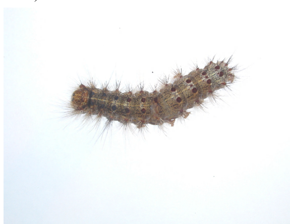
Slika 2. Ličinke stričkovog šarenjaka

Image 1. Adult painted lady