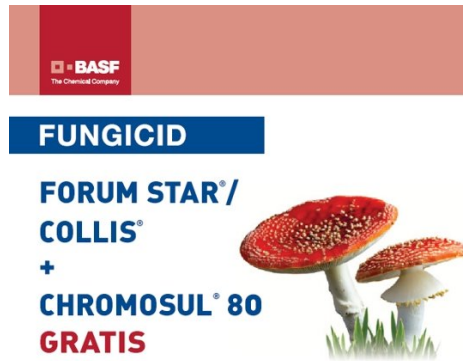
Slika 6. Kombinacija fungicida po preporuci tvrtke Chromos agro