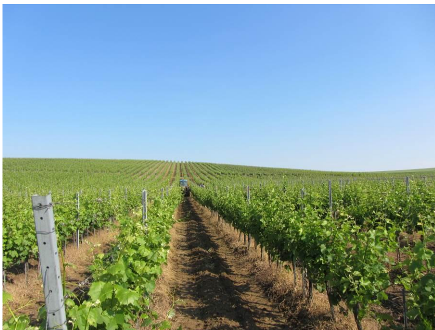
Slika 4. Vinogorje Baranja, položaj Zmajevac

grozdova te se potom pristupilo vaganju. Za svih 9 uzoraka određivana su četiri parametra (prinos po biljci, broj grozdova po biljci, masa grozdova i masa 100 bobica).