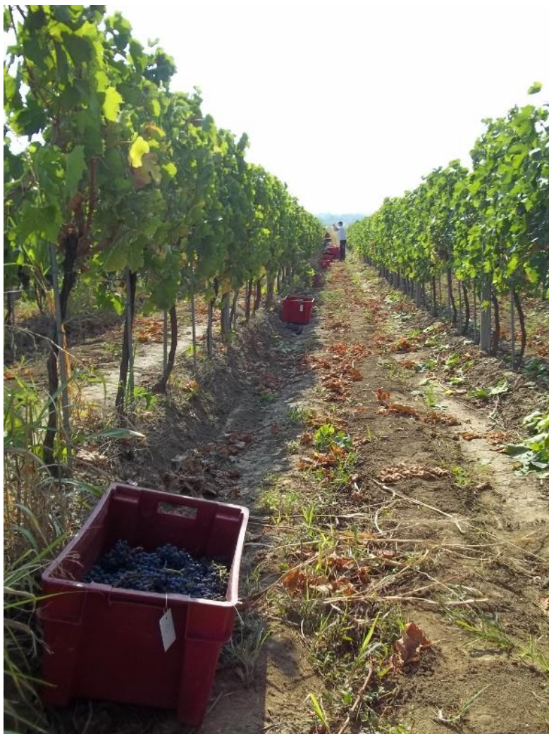
Slika 6. Odvajanje grožđa svakog tretmana u posebne PVC kašete