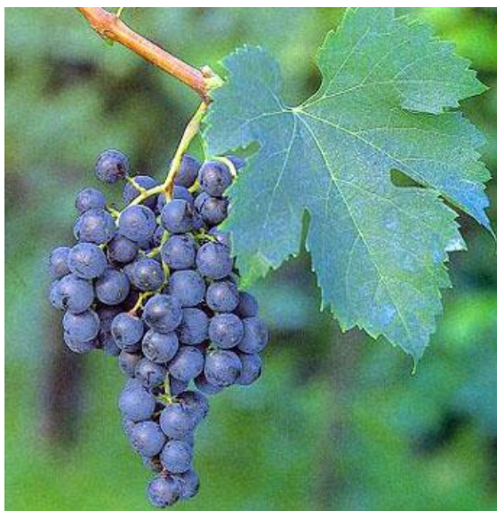
Slika 3. Izgled lista i grozda kultivara Merlot

Zreo grozd je srednje veličine, valjkast, moguće sa grozdićem na koljencu; peteljka grozda je duga, do koljenca odrvenjela. Zrele bobice su nejednake, okruglaste, modro-crne, modro-sivo oprasene; kožica je srednje debljine, izdržljiva; meso srednje gustoće; sok malo crvenkast, sladak, ugodna okusa. Rozgva je srednje debljine ili deblja, članci kratki ili srednje dugi; smeđe-crvene boje ( kao drvo mahagonij), ljubičasto oprasena, s crnim točkama. Rast je snažan, poliuspravan (Mirošević i Turković, 2003.).