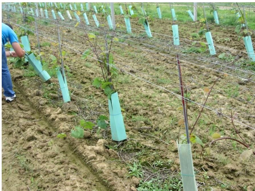
Slika 2. Podloga Kober 5 BB (Izvor: autor)