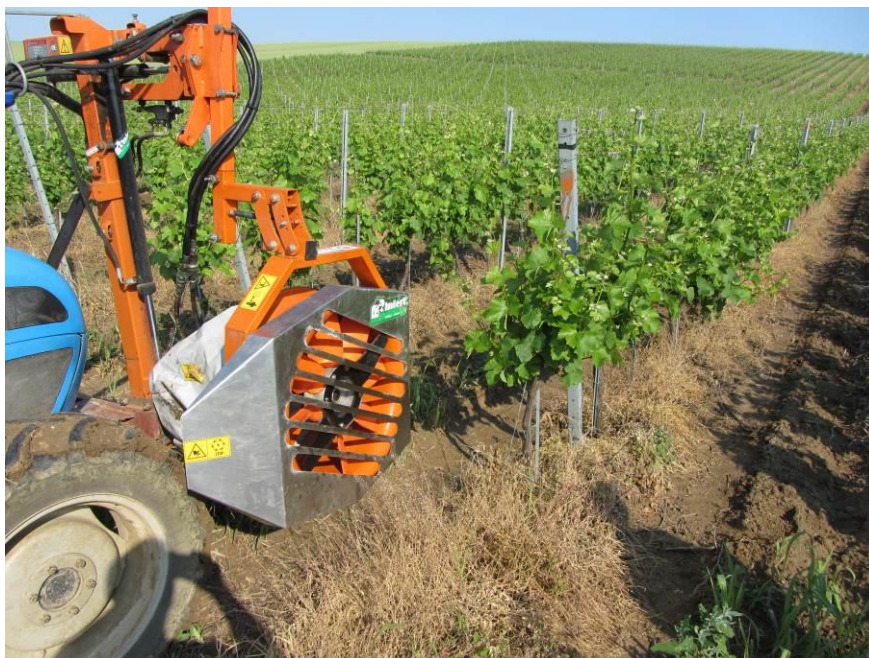
Slika 5. Bočni strojni defolijator u pokusnom redu