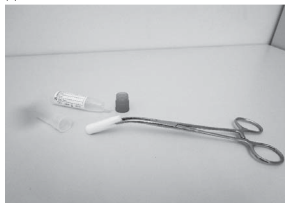
Slika 1. Uzimanje uzorka sline pomoću tampon vate (a) i oprema (b) (Salivette Cortisol, code blue) Picture 1 Sample collection with a buffer pad (s) and equipment (b) (Salivette Cortisol, code blue)