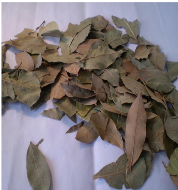
Slika 5. Biljka i sušeno lišće lovora ( Laurus nobilis L.)