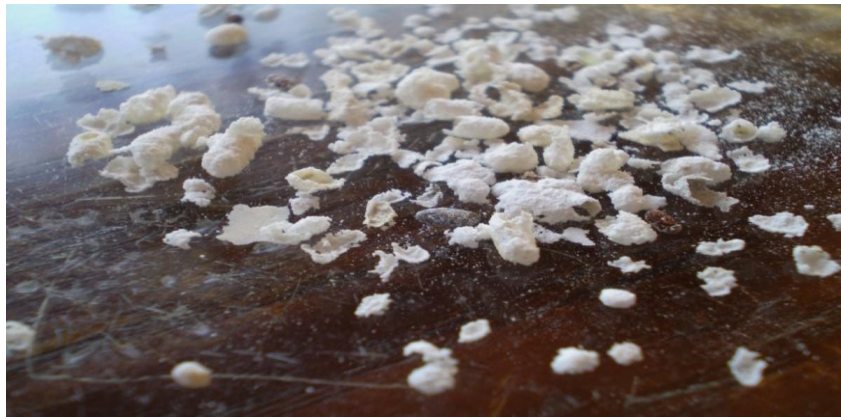
Slika 2. Proizvod oštećen od napada kukaca