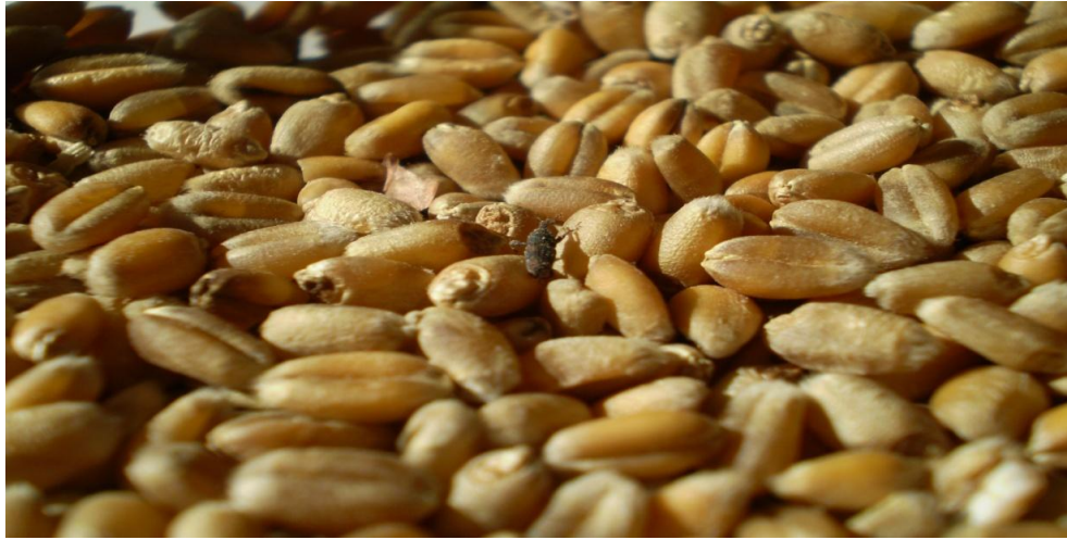
Slika 1. Prisutnost štetnika ( S. oryzae L.) u pšenici