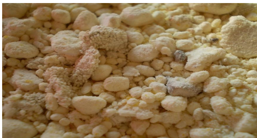
Slika 3. Prisutnost filtova i produkata u prerađevinama – brašno

U skladu s važećim propisima Pravilnika o žitaricama, mlinskim i pekarskim proizvodima, tjestenini, tijestu i proizvodima od tijesta (NN 78/05, 135/09, 86/10, 72/11) propisuje da se u