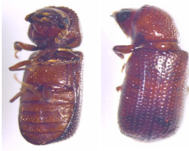
Slika 6. Rhyzopertha dominica Fabricius – Žitni kukuljičar

temperature, već i biokemijski na sastav zrna. Zbog svoje potrebe za visokim temperaturama R. dominica tipičan je štetnik silosno – skladišnih objekata. Osim pšenice tj. žitarica, napada suho voće i prerađevine, sjemensku robu. Ženka odlaže 300-500 jaja, te najkraći razvoj u optimalnim uvjetima traje 24 dana. Ima 2 generacije.