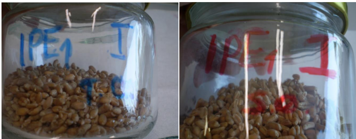
Slika 9. Staklenke s formulacijama pripravaka za pojedine štetnike

odvojilo zaostalo brašno. Od prosijanog loma dodano je 1% (odvagom) u ostatak cjelovitih zrna, te je sve dobro protreseno, kako bi se ujednačila pšenica s 1% loma. Staklenke s tako pripremljenim uzorcima su prekrivene mrežicom od mlinske svile kako bi se osigurao nesmetan pristup zraku, te su odložene u kontrolirane uvijete pri temperaturi od 29\text{ }^{\circ}\text{C}\pm 1^{\circ}\text{C} i rvz od 70%. Kontrola je postavljena na identičan način, samo je izostavljena aplikacija pripravaka.