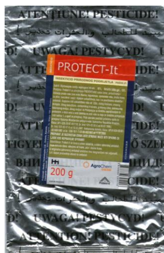
Slika 4. Komercijalno dozvoljen pripravak na osnovi dijatomejske zemlje u Republici Hrvatskoj - Protect-It™

Na tržištu Republike Hrvatske trenutno se nalazi jedan komercijalizirani pripravak na osnovi dijatomejske zemlje, pod nazivom Protect-It™, proizvođača Hedley Technologies Ltd. Ontario, Kanada (Slika 4.). To je insekticid prirodnog podrijetla, iz uputa klasificiran je kao insekticidno i akaricidno prašivo za suzbijanje kukaca i grinja u uskladištenim proizvodima.